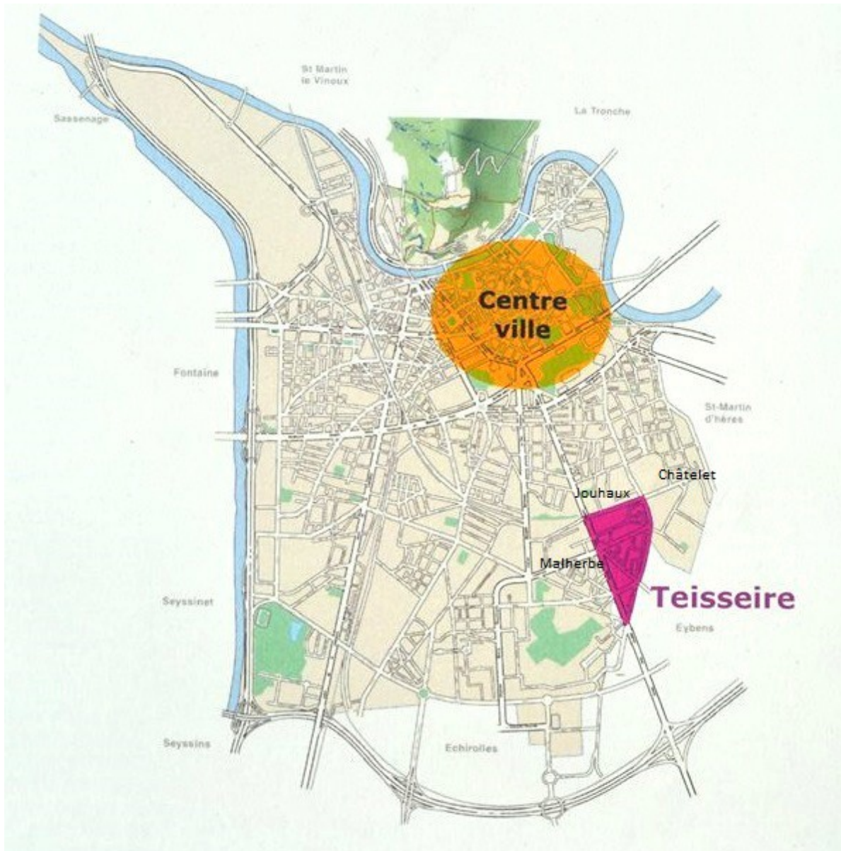
Carte de Grenoble : le centre ville et le quartier Teisseire