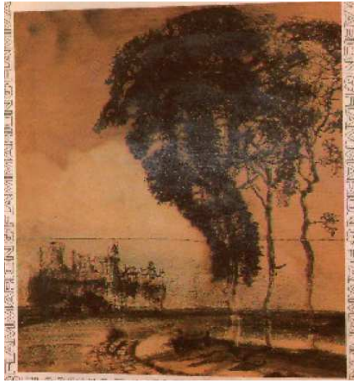
Burg en ruine, Musée Victor Hugo.