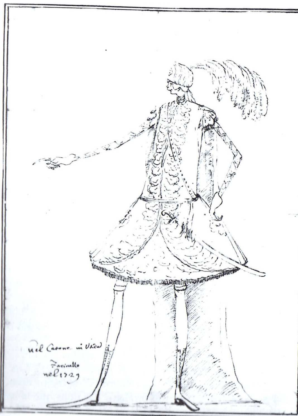
Farinelli dans Catone in Utica , 1729, (dessin d'A.M. Zanetti).

Farinelli dans Catone in Utica , 1729. Dessin d'A. M. Zanetti.