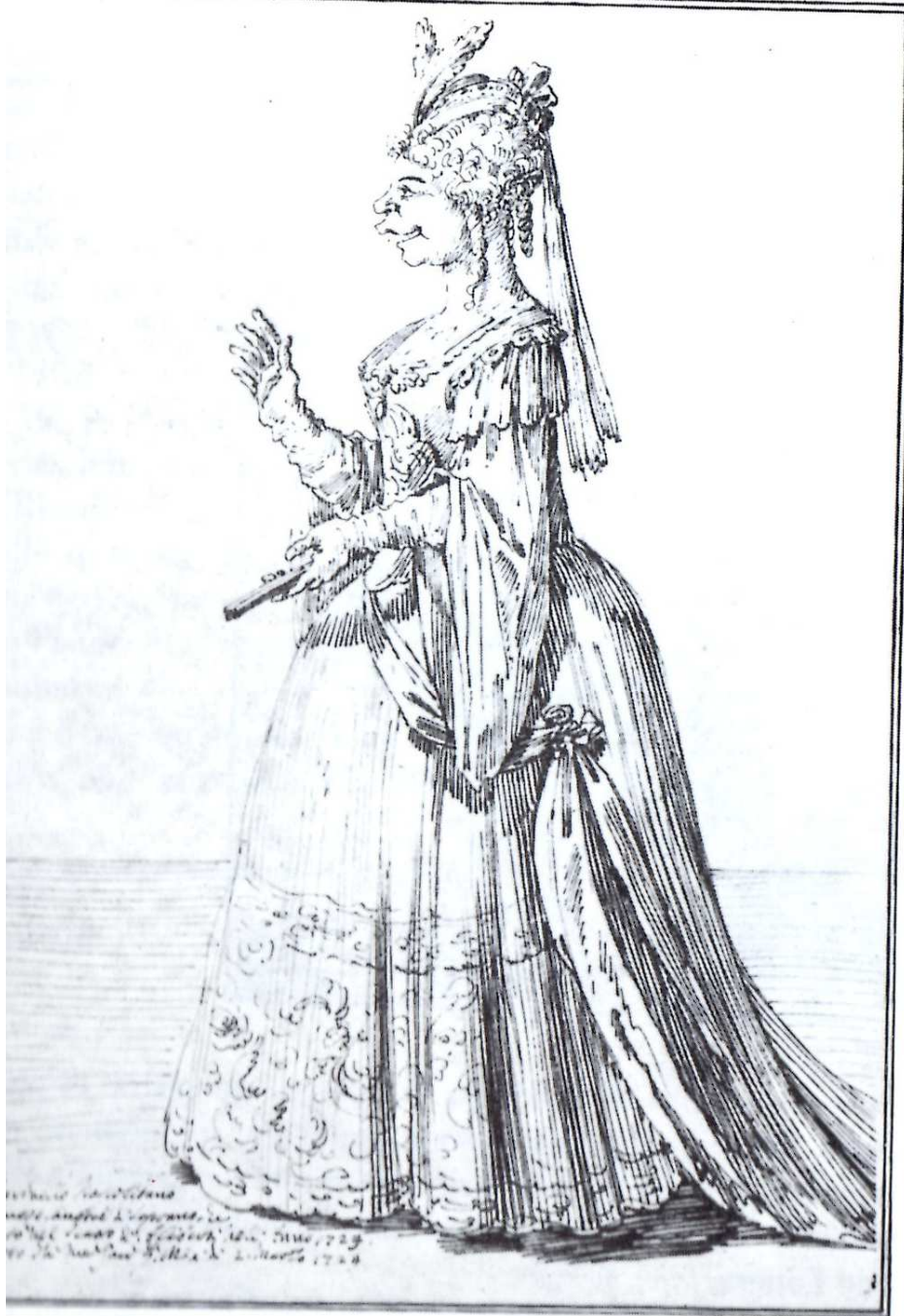
Farinelli au théâtre Alibert, en 1724, dessin de Pier Leone Ghezzi.

Farinelli au théâtre Alibert, 1724. Dessin de Pier Leone Ghezzi.