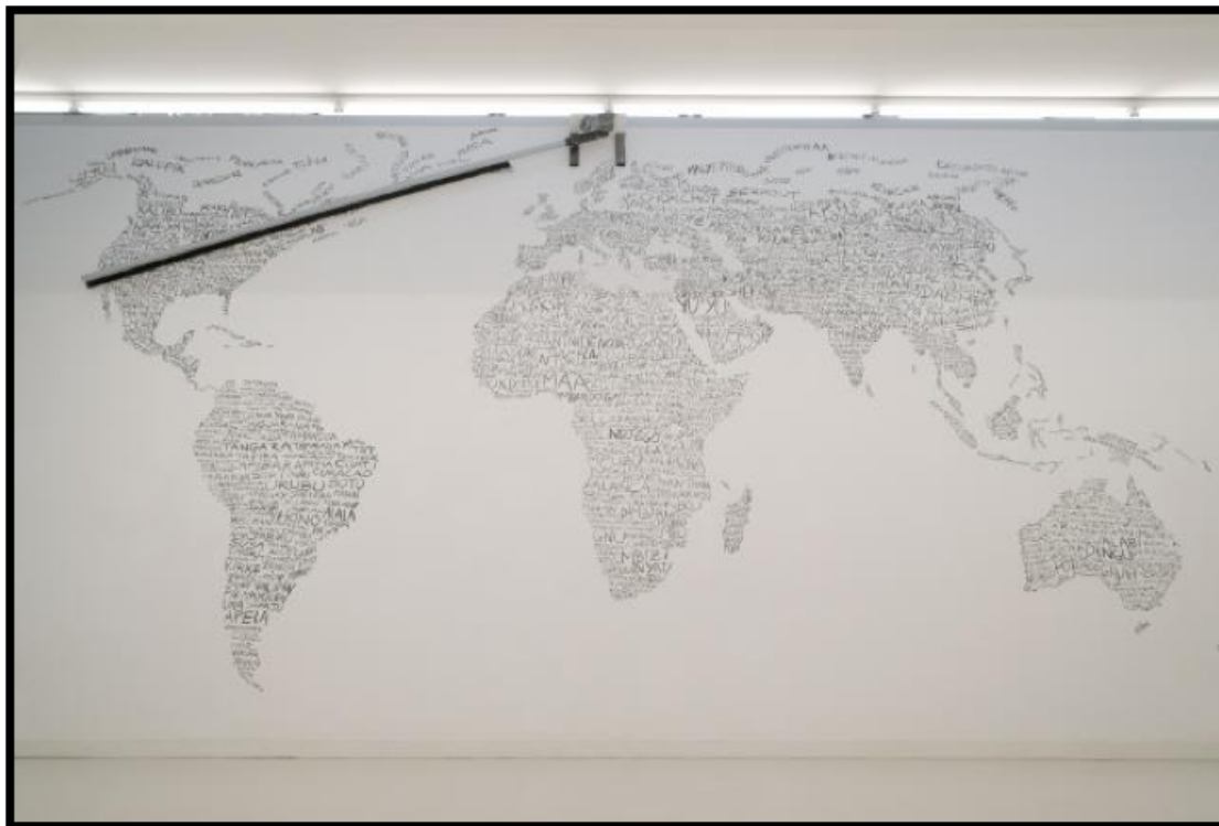
Figure 3: Art Orienté Objet intitulée « L'Alalie »

l'œuvre du collectif Art Orienté Objet intitulée « L'Alalie » (Figure 3). Cette œuvre est en fait un balai mécanique qui efface progressivement les noms des espèces en voie de disparition dans le monde, inscrites au fusain sur le mûr.