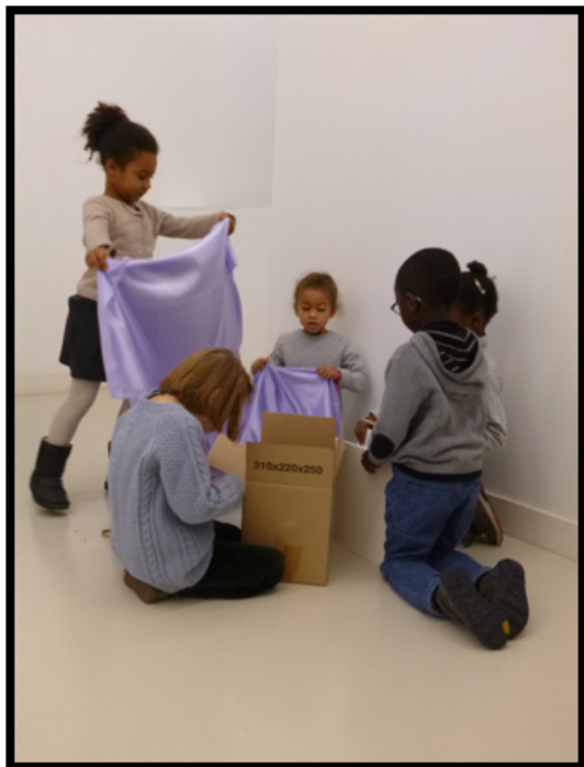
Figure 4:

laisser libre cours à leur imagination. A la fin, tous les groupes étaient invités à circuler entre les productions, et chaque groupe présentait son dessin et ce qu'ils avaient réalisés. Ils devaient donc justifier leurs choix, argumenter. Puis ce fut la fin de la visite.