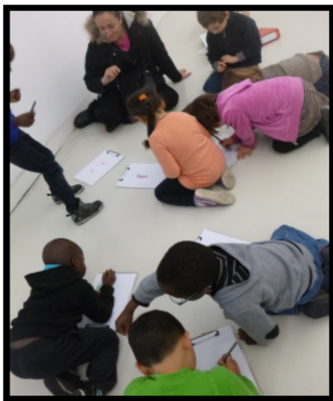
Figure 2:

tissu. C'est en réalité une chaise qui est dissimulée en-dessous. La médiatrice a demandé aux élèves de bien l'observer, de tourner autour. Elle a demandé aux élèves de s'imaginer ce qu'il y avait en-dessous. Cette œuvre, très colorée, ludique et mystérieuse, a beaucoup intrigué les élèves. Une première activité leur est alors proposée : ils devaient choisir un angle de vue, bien regarder, puis aller dans une autre pièce pour dessiner l'œuvre selon le point de vue qu'ils avaient choisis. (Figure 2).