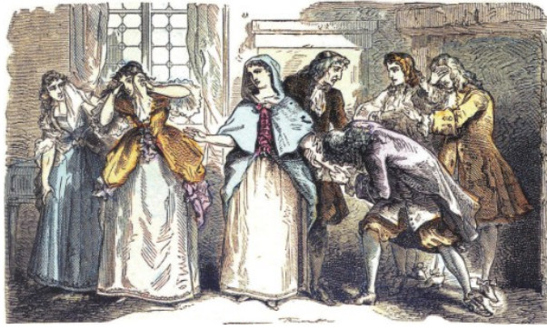
Anonyme, illustration du début du XX e siècle