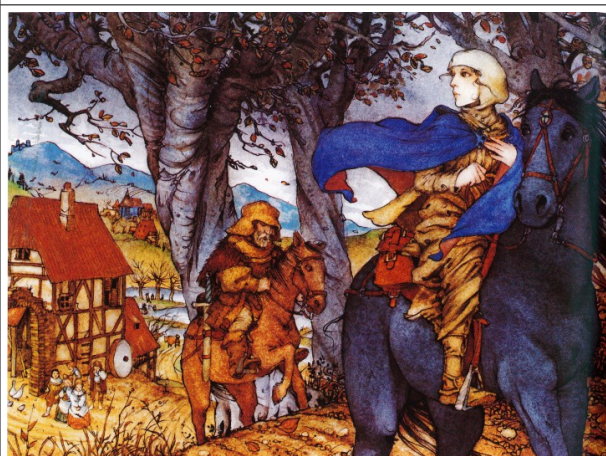
Mercer Mayer, 1978