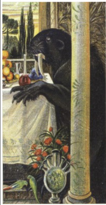
Eleanor Vere Boyle (1825 - 1916)

E. Illustrations de la scène où la Belle retrouve la Bête à l'agonie