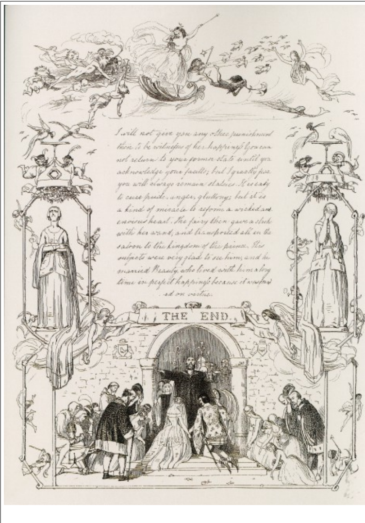
Richard Doyle, 1842