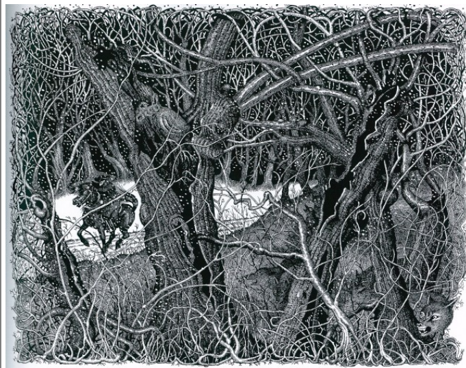
Nicole Claveloux, 2001