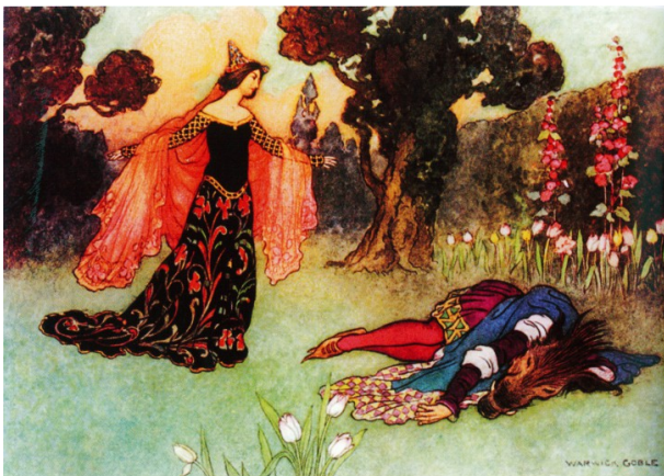
Warwick Goble, 1913