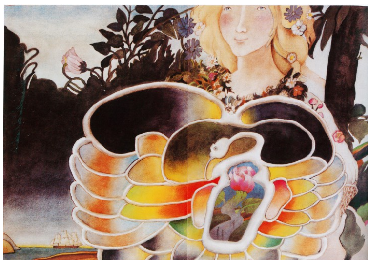
Étienne Delessert, 1984