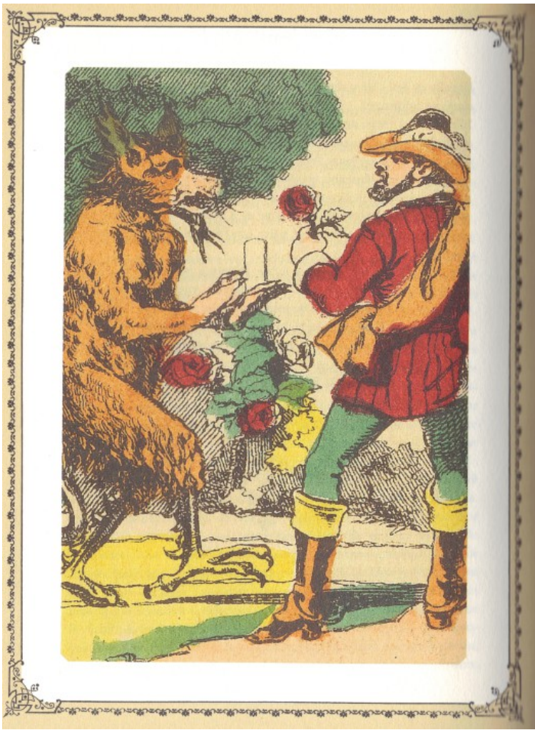
Estampe anonyme, XIXe siècle