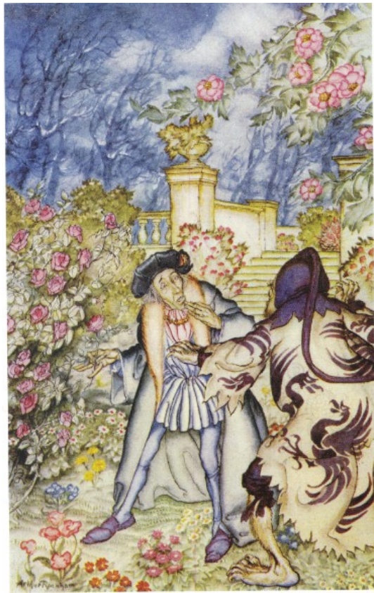
Arthur Rackham, 1933