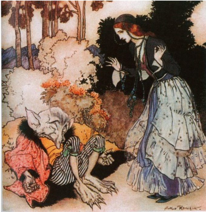
Arthur Rackham, vers 1915