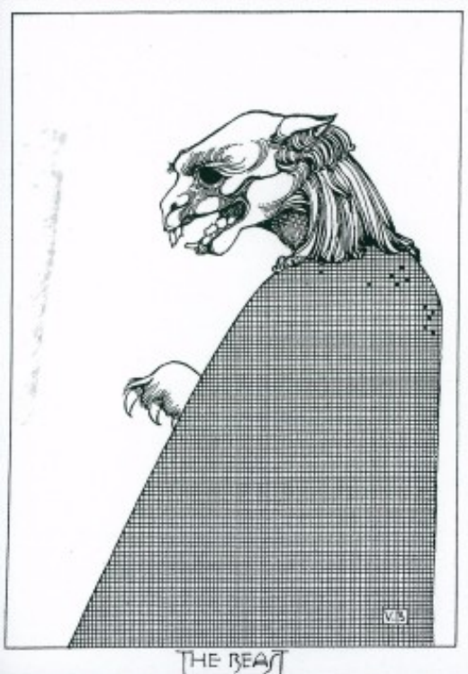
Violet Brunton, 1929