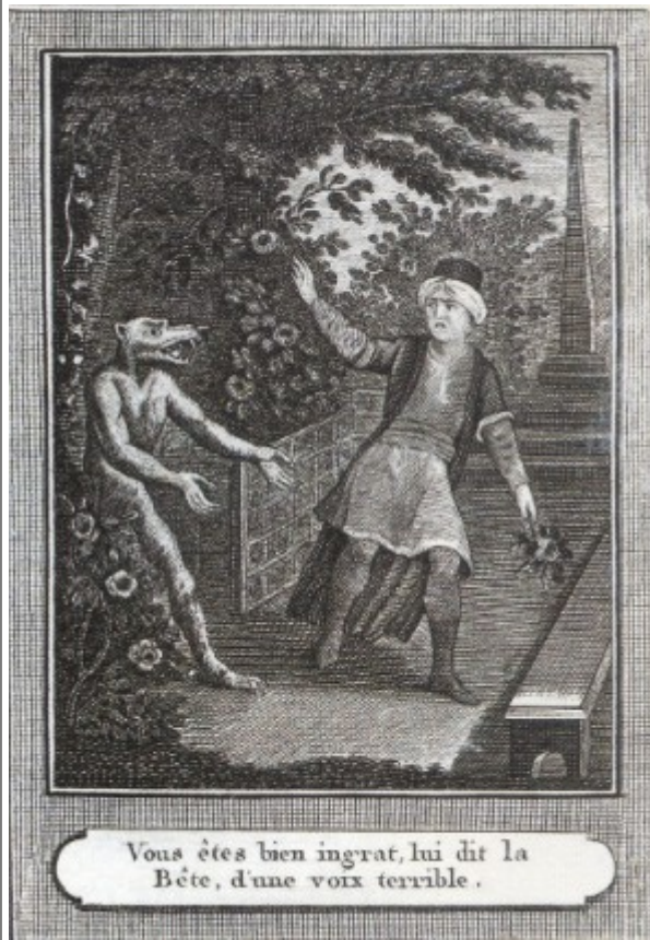
F. Hust, 1811