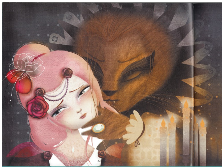
Magali Fournier, 2012