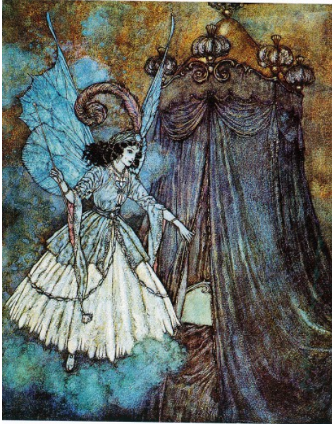
Edmund Dulac, 1910