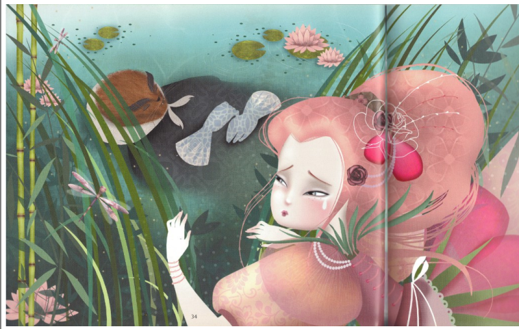
Magali Fournier, 2012