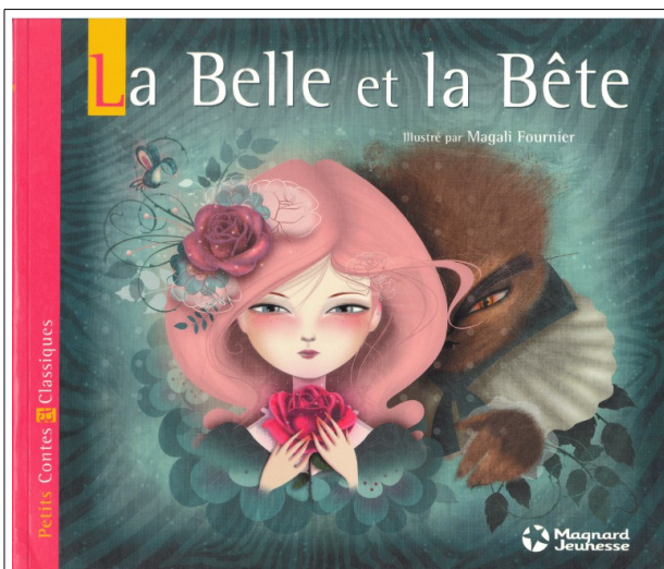
Magali Fournier, 2012