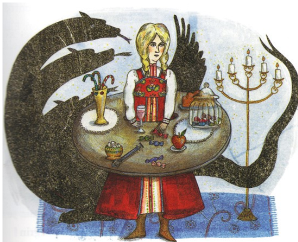
Delphine Jacquot, 2008