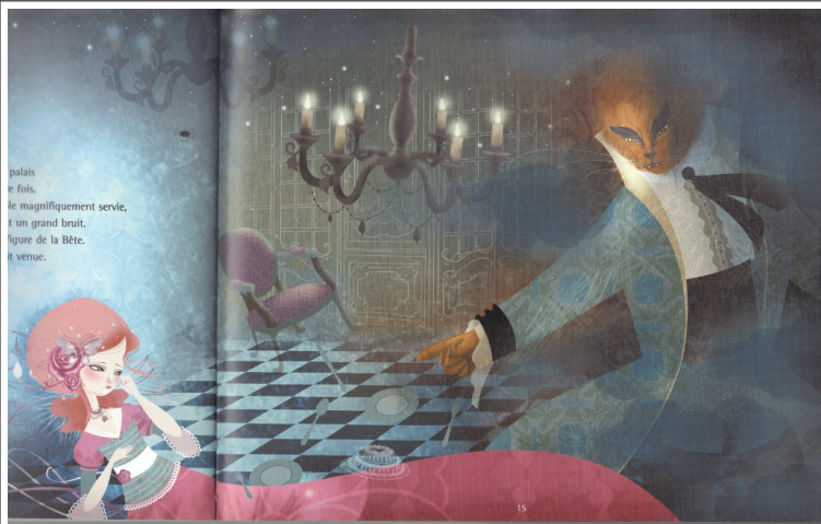
Magali Fournier, 2012