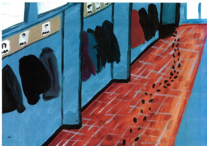
"Pipa le rat", peintures par Barbara Sperber