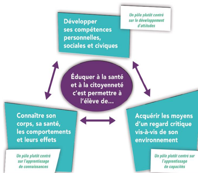
Figure 1 : Illustration des trois dimensions de l'éducation à la santé et à la citoyenneté à l'école. 9

Que les textes officiels ne mentionnent pas les contenus à enseigner souligne l'implicite transdisciplinarité de l'éducation à la santé (Lagneaux, 2012) et sa vocation à trouver un écho quotidien au sein des pratiques scolaires. La mission confiée par l'État à l'École en matière de santé (MEN, 2003) doit faire l'objet de réflexions pour être pensée de manière cohérente et structurée afin de permettre un développement global des compétences de l'élève.