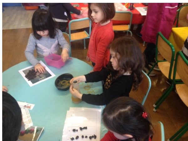
Un atelier d'éducation motrice : faire glisser des élastiques sur un tube conique Une élève attend qu'un atelier se libère.