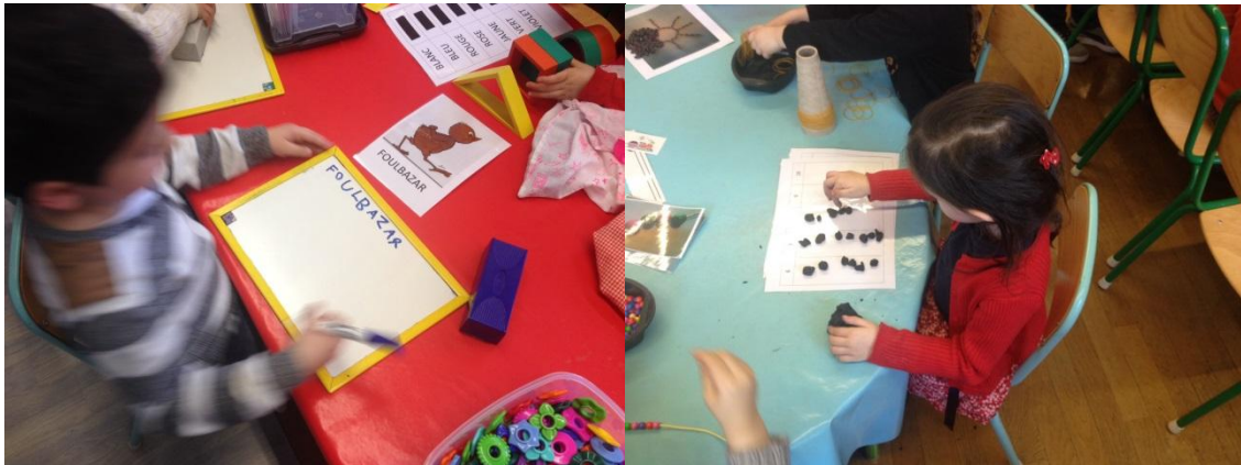
Des ateliers d'éducation intellectuelle : ardoise et boîte à mots (à gauche) et numération (à droite)