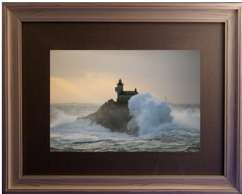
Phare de Tévenec Plisson P.

L'importance de la contenance et du cadre thérapeutique dans l'accompagnement de l'instabilité psychomotrice.