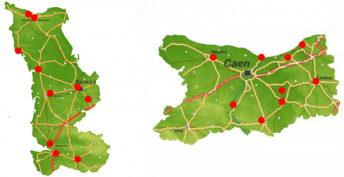
Figure 2: Répartition des centres de secours étudiés

Dans la Manche, le taux de réponse a été de 10% soit 46 pour 448 questionnaires distribués. Ces réponses concernaient des sapeurs-pompiers des centres de secours suivants : Cherbourg (4), Equeurdreville-Hainneville (1), Barneville-Carteret (2), Ducey (3), Lessay (1), Carentan (6), Saint-Lô (7), Avranches (5), Saint-Hilaire-du-Harcouët (2) et Torigni-sur-Vire (2). Pour 13 réponses, le centre de secours n'était pas précisé.