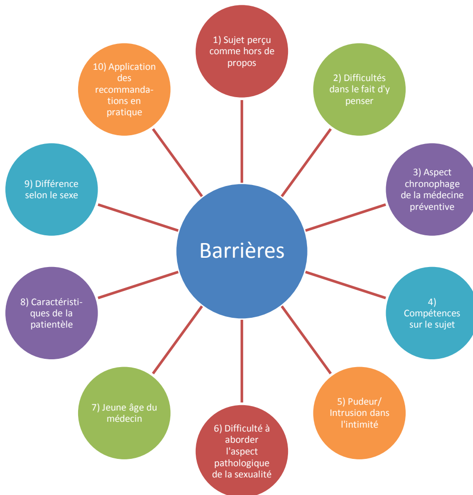
FIGURE 1 : BARRIERES POUR ABORDER LA SEXUALITE ET PROPOSER DES DEPISTAGES D'IST