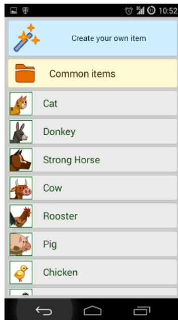
Menu d'objets à animer de l'application

possibilité aux familles de s'en servir à la maison). Pour cette séance, de façon à faciliter l'entrée dans le logiciel, la forme vectorielle à animer la plus simple a été choisie : un ballon. En limitant les mouvements de l'objet choisi à deux points (l'animation de ce ballon se fait via un axe permettant des déplacements, des homothéties et des inclinaisons), nous avons simplifié la tâche des élèves pour commencer.