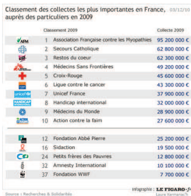
Figure 3 - Classement des collectes auprès des particuliers en France, en 2009 16

bénéficient très inégalement de la générosité du peuple (cf. Figure 3). Donc, le “marché du don” s’inscrit, comme tous les autres, autour d’une certaine concurrence.