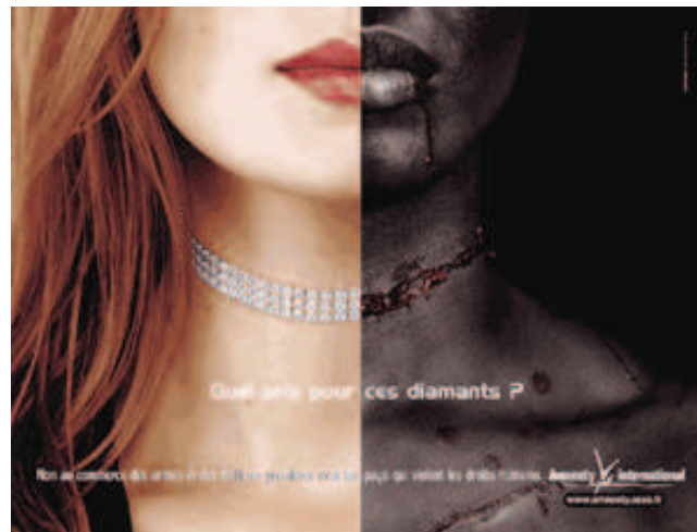
Figure 5 - Campagne Amnesty International : “Les diamants du sang”

Pour conclure cette dernière partie, nous soulignerons que notre enquête de terrain a réfuté nos hypothèses de départ. En effet, nous supposions que les adhérents des associations n’avaient pas réellement conscience de l’effet contre-productif que pouvaient avoir certaines campagnes “chocs” car ils les envisageraient uniquement comme un moyen efficace de favoriser la mémorisation, sans penser aux répercussions négatives sur les donations. Nos entretiens nous ont démontré que six adhérents sur sept avaient déjà entendu parler de retombées quelque peu négatives. Ils ne méconnaissent donc vraisemblablement pas le fait que les effets visés ne sont pas toujours atteints et qu’il existe des personnes que les campagnes “chocs” rebutent. Cependant, ils estiment tous qu’il est utile, voire nécessaire de marquer les esprits de la sorte pour obtenir des résultats satisfaisants.