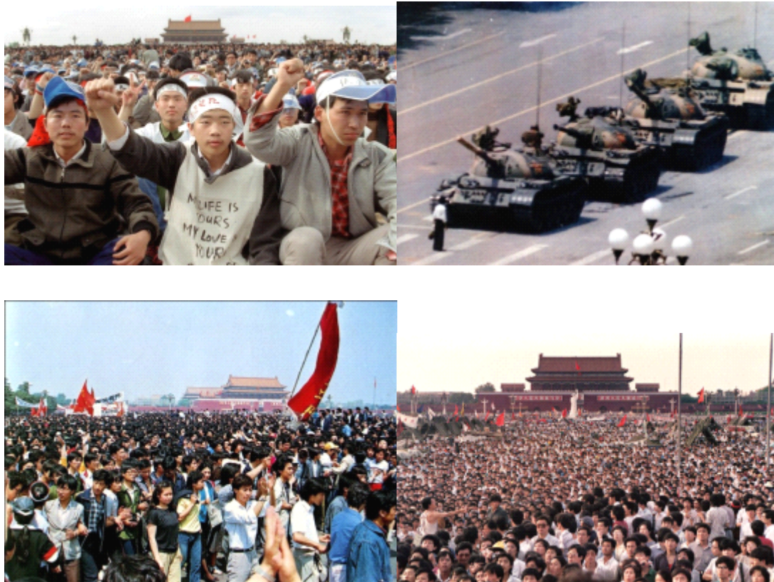
Figure 4 : la manifestation de Tian'anmen

Pendant la manifestation de Tian'anmen, les nouveaux médias n'ont pas paru, les médias classiques sont « les protagonistes ». Nous allons nous concentrer sur l'analyse des médias classiques.