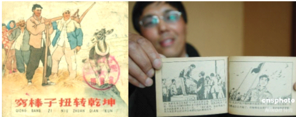
Figure1: Le Lianhuanhua

Durant cette époque, les médias sont le porte-parole “La gorge et la langue” du parti communiste, si bien que le rôle des médias est un outil propagande. Le journal joue un rôle principal, mais il y a quelques autres médias intéressants, par exemple le Lianhuanhua.