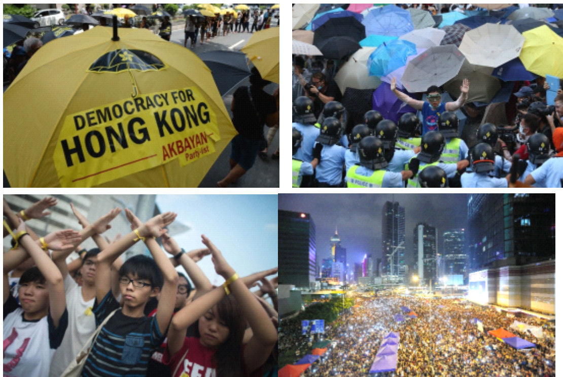
Figure 5 : la révolution des parapluies à Hongkong

Tandis que l'Europe célèbre le vingt-cinquième anniversaire de la chute du Mur de Berlin, Hong Kong connaît une période de contestation sans précédent, connue sous le nom de « mouvement des parapluies ».