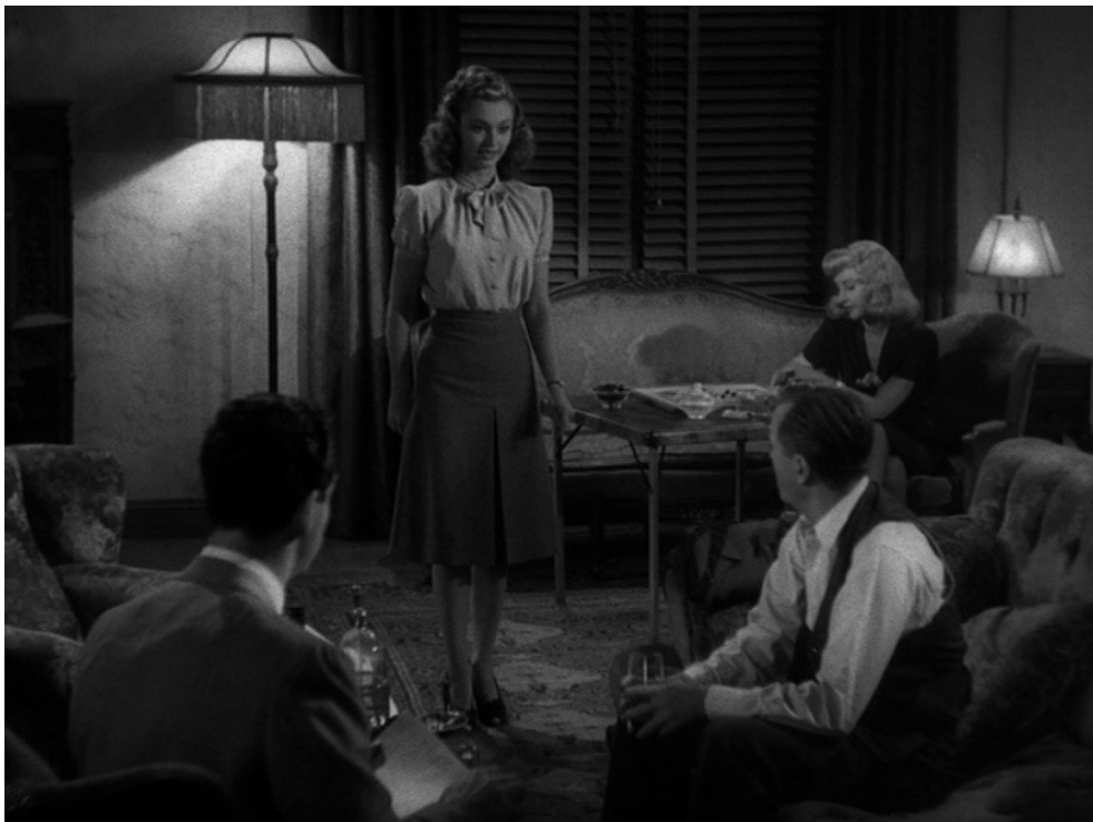
Salon, Assurance sur la mort , Billy Wilder, 1944.