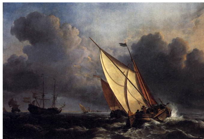
Turner, Joseph Mallord William, Dutch Fishing Boats In A Storm , National Gallery, Londres, 1801.