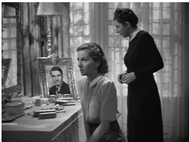
Chambre de Rebecca, Rebecca , Alfred Hitchcock, 1939.