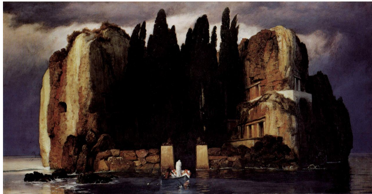
Böcklin, Arnold, L'Île des Morts , Museum der bildenden Künste, Leipzig, 1886.