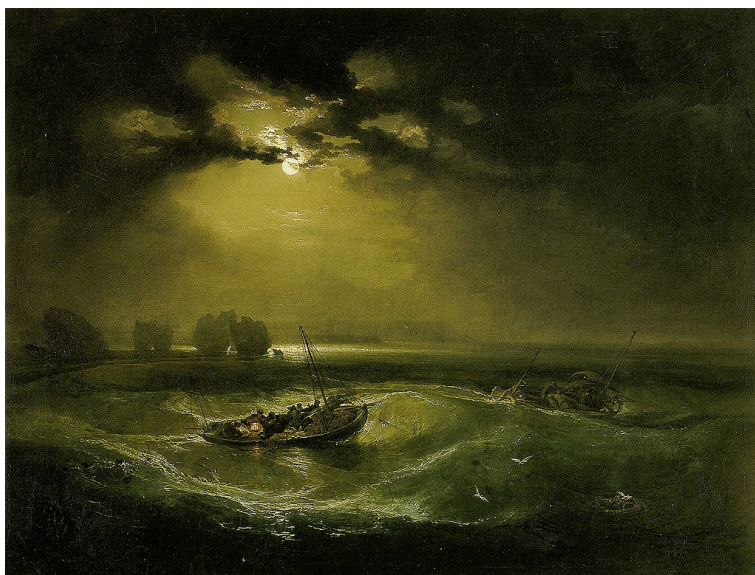
Turner, Joseph Mallord William, Pêcheurs en mer , Tate Gallery, Londres, 1796.