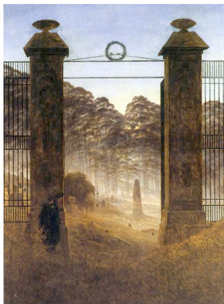
Friedrich, Caspar David, The Cemetery Entrance , Gemäldegalerie, Dresde, 1825.