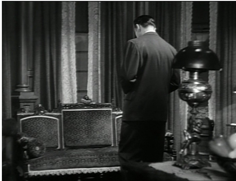
Salon, Angoisse , Jacques Tourneur, 1944.