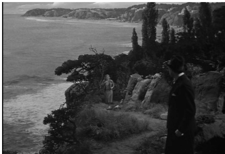
Maxim sur la falaise, Rebecca , Alfred Hitchcock, 1939.