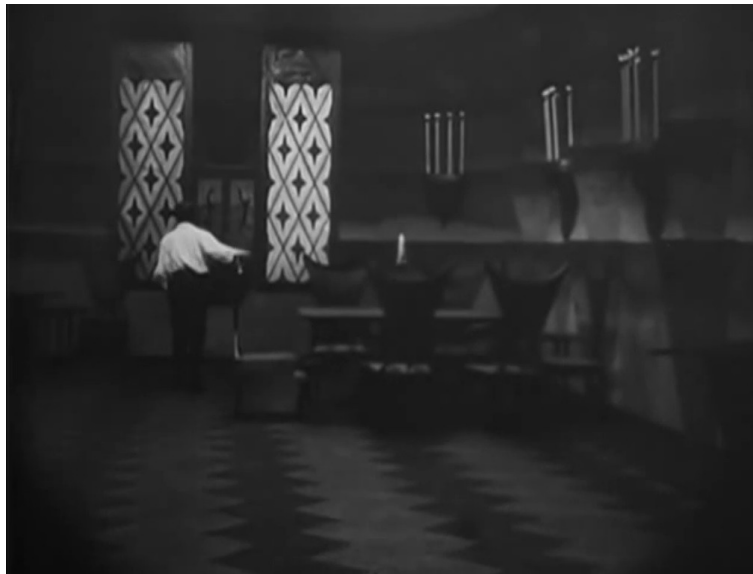
Salon, Le Docteur Mabuse , Fritz Lang, 1922.