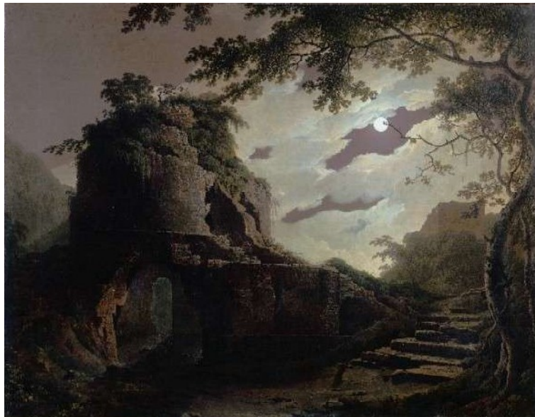
Wright of Derby, Joseph, Le tombeau de Virgile , Derby Museum and Art Gallery, Derby, 1782.