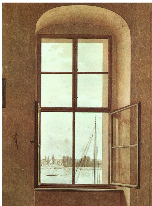
Friedrich, Caspar David, View From The Artists Studio Window On Left , Belvedere, Vienne, 1806.