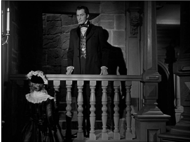
Escalier de la tour, Le Château du Dragon , Joseph L. Mankiewicz, 1946.