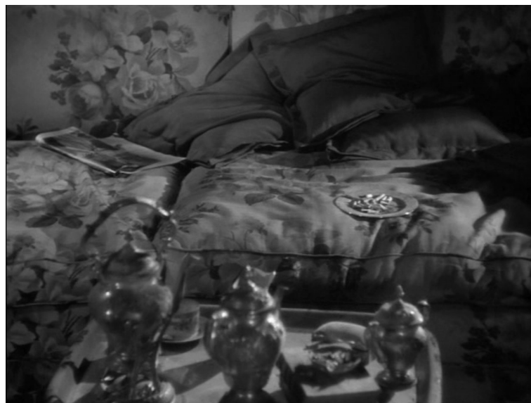
"Elle était assise sur le lit...", Rebecca , Alfred Hitchcock, 1939.