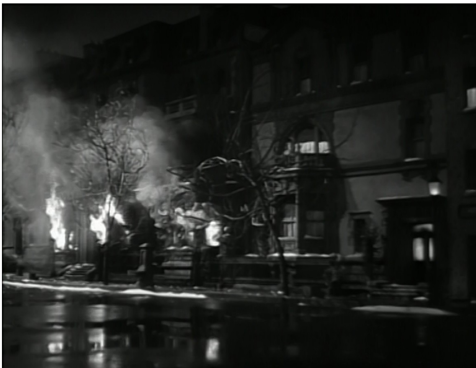
Incendie de la propri t , Angoisse , Jacques Tourneur, 1944.