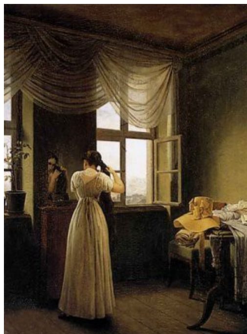
Kersting, Georg Friedrich, Devant le miroir , Kunsthalle, Kiel, 1827.