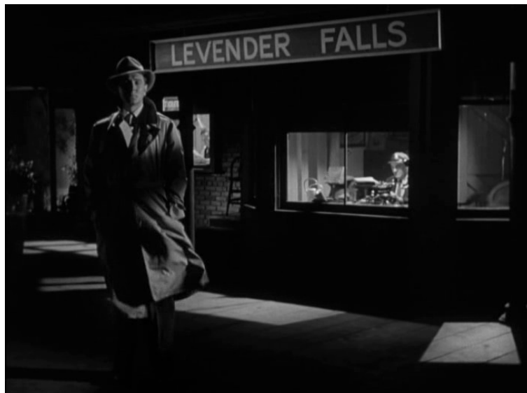
Quai de la gare, Le Secret derrière la porte , Fritz Lang, 1948.