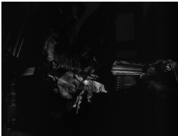
Découverte des diamants, Hantise , George Cukor, 1947.