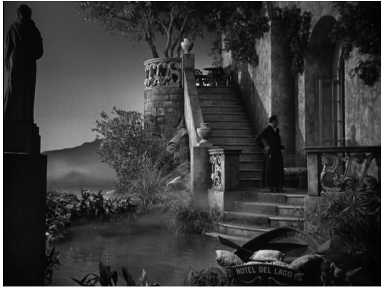
Hotel del Lago, Hantise , George Cukor, 1944.