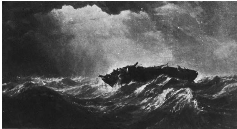
Stanfield, Clarkson Frederic, Les Abandonnés , 1856.