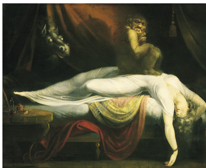
Füssli, Johann Heinrich, Le Cauchemar , Detroit Institute, Détroit, 1781.