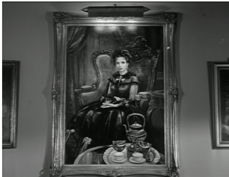
Portrait d'Allida, Angoisse , Jacques Tourneur, 1944.

Les Female gothic , des films noirs romantiques ?