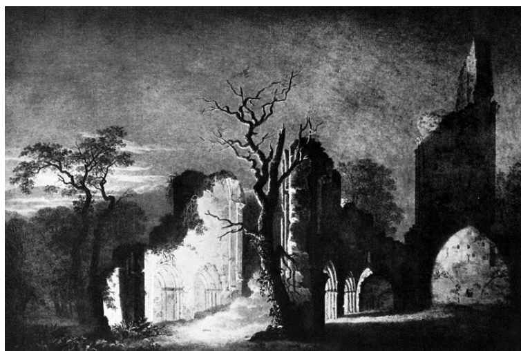
Friedrich, Caspar David, Façade ouest de la ruine d'Eldena , Musée des beaux-arts, Angers, 1806.