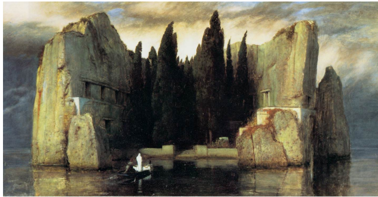
Böcklin, Arnold, L'Île des Morts , Kunstmuseum, Bâle, 1880.