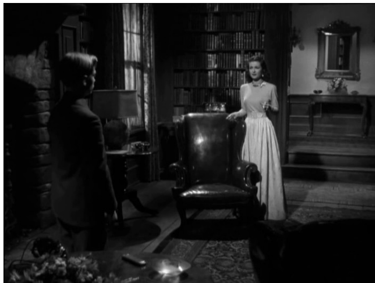
Salon, Le Secret derrière la porte , Fritz Lang, 1948.