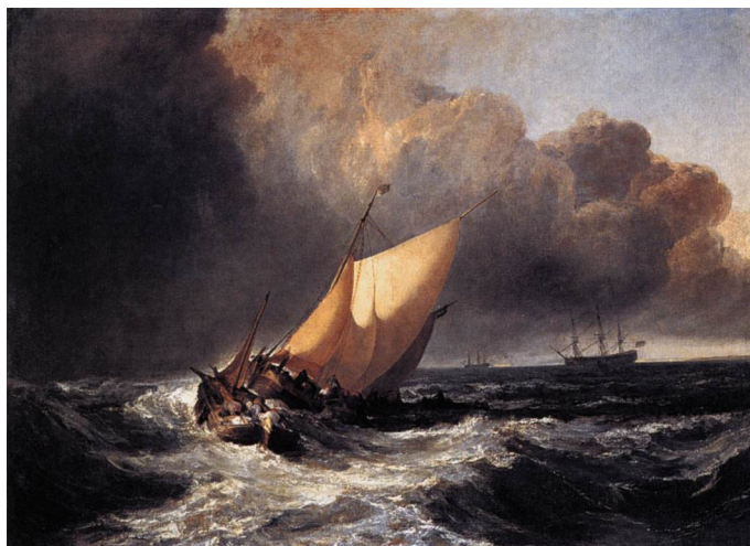
Turner, Joseph Mallord William, Dutch Boats In A Gale , National Gallery, Londres, 1801.