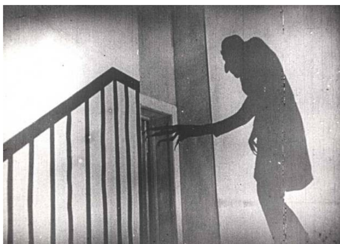
Nosferatu dans l'escalier, Nosferatu le vampire , Friedrich Wilhelm Murnau, 1922.