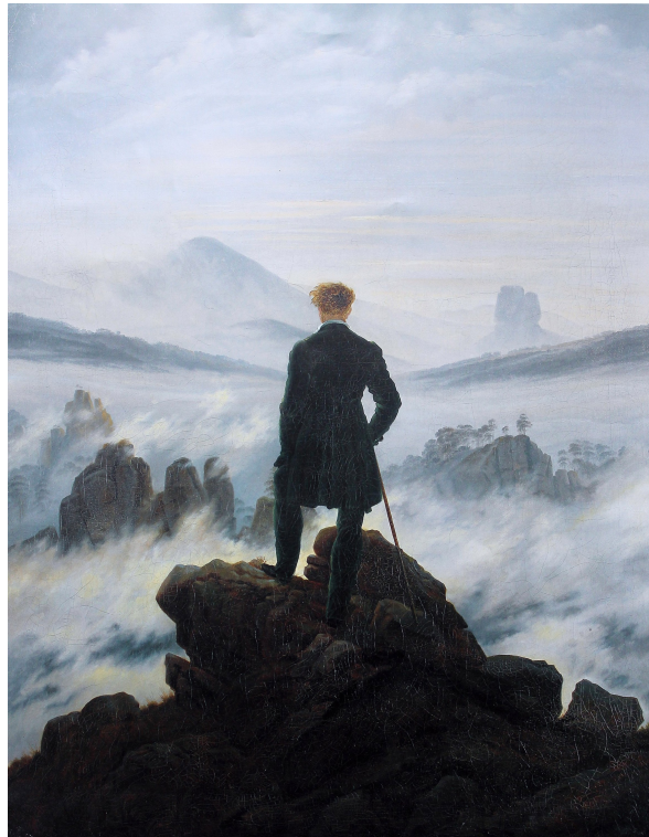
Friedrich, Caspar David, Voyageur contemplant une mer de nuages , Kunsthalle, Hambourg, 1818.