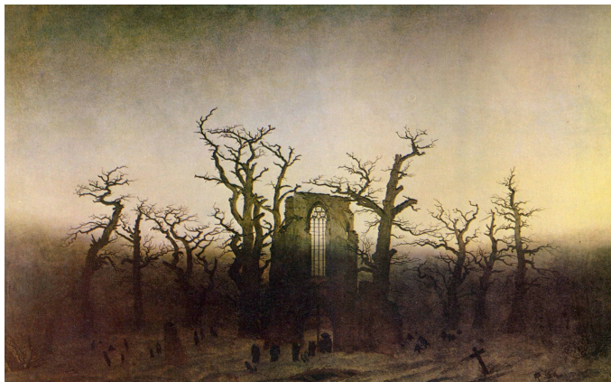
Friedrich, Caspar David, L'abbaye dans une forêt de chênes , Alte Nationalgalerie, Berlin, 1810.