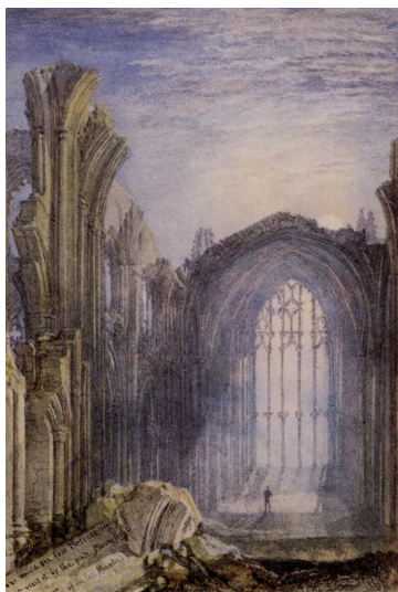
Turner, Joseph Mallord William, Melrose Abbey , The National Gallery of Scotland, Edimbourg, 1831.