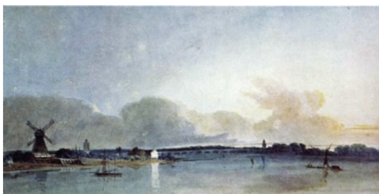
Girtin, Thomas, La Maison blanche à Chelsea , Tate Gallery, Londres, 1800.