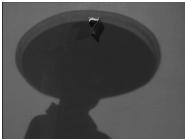
Porte n°7, Le Secret derrière la porte , Fritz Lang, 1948.