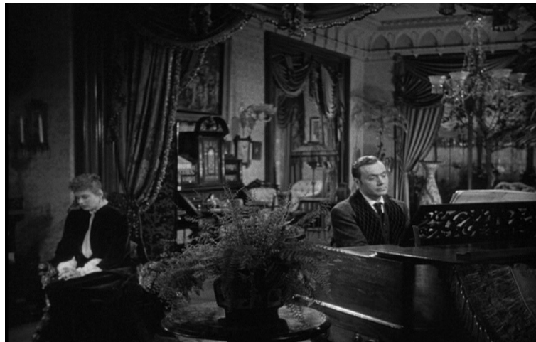
Salon, Hantise , George Cukor, 1944.