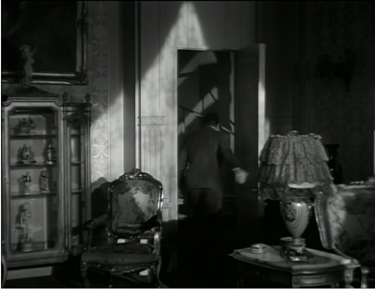
Montée de l'escalier, Angoisse , Jacques Tourneur, 1944.