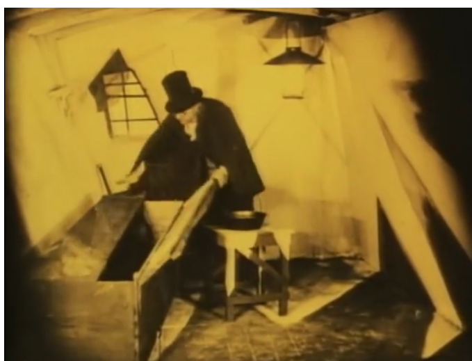
Le Cabinet, Le Cabinet du Docteur Caligari , Robert Wiene, 1920.