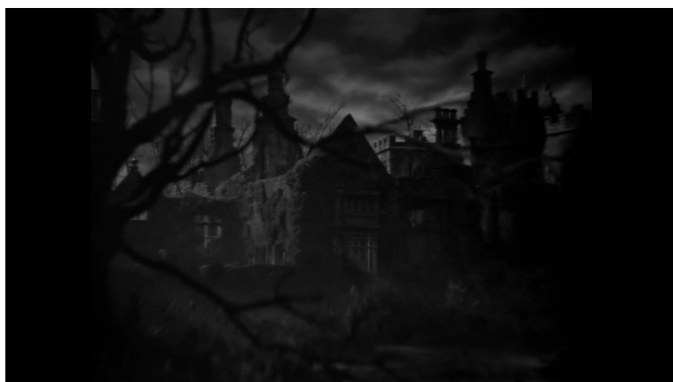
Manoir de Manderley, Rebecca , Alfred Hitchcock, 1939.