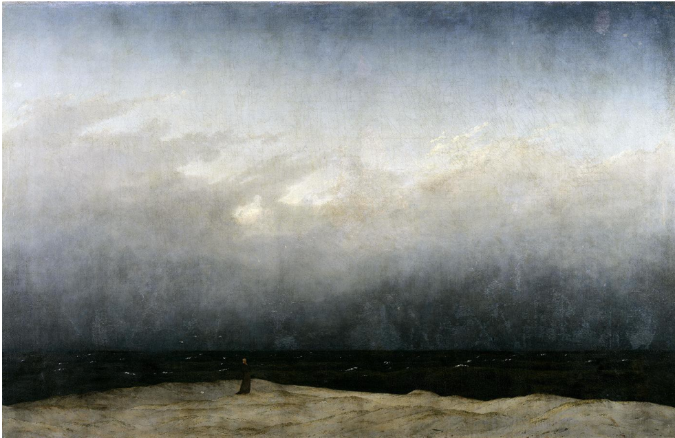
Friedrich, Caspar David, Le Moine au bord de la mer , Alte Nationalgalerie, Berlin, c. 1809.