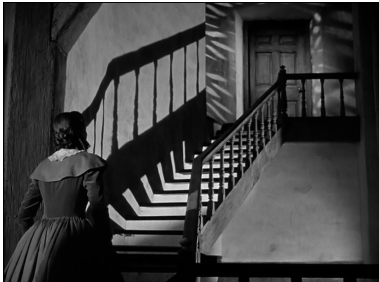
Escalier, Le Château du Dragon , Joseph L. Mankiewicz, 1946.