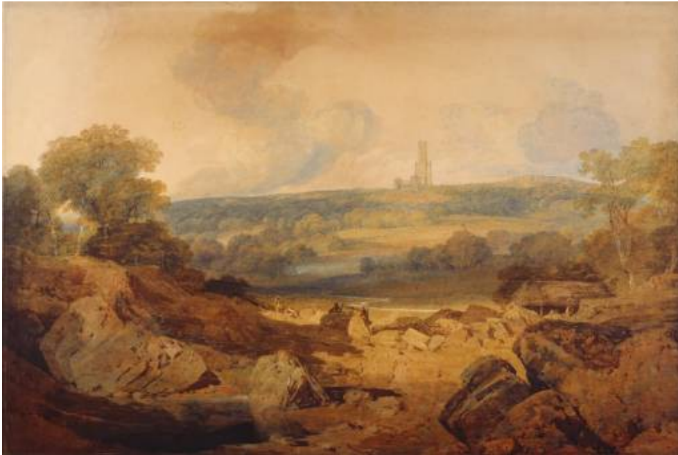
Turner, Joseph Mallord William, East View of the Gothic Abbey (Noon) Now Building at Fonthill , The National Gallery of Scotland, Edimbourg, 1799.