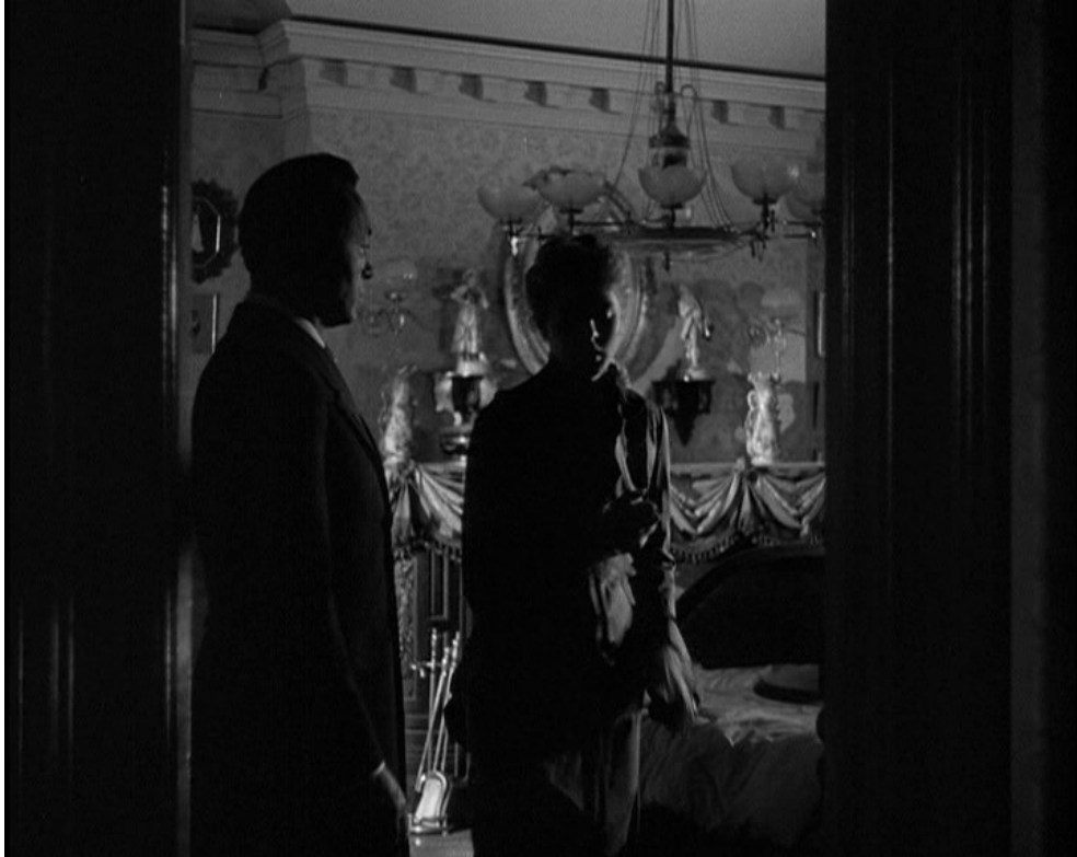
Chambre de Paula, Hantise , George Cukor, 1944.