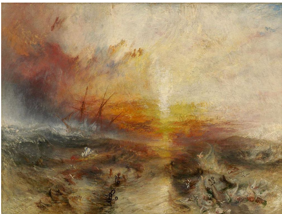
Turner, Joseph Mallord William, Esclavagistes jetant par dessus bord les morts et les mourants – Début de typhon , Musée des Beaux-Arts, Boston, 1840.