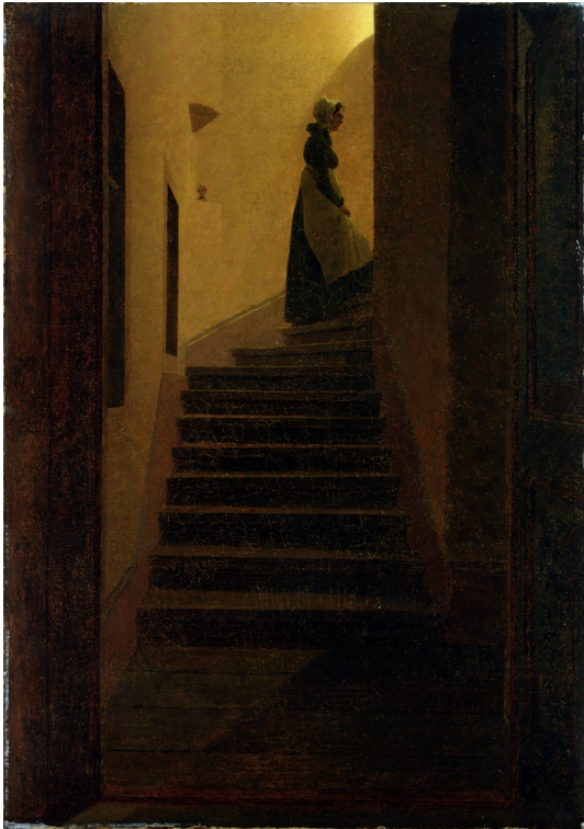
Friedrich, Caspar David, Caroline dans l'escalier , 1825, collection privée.