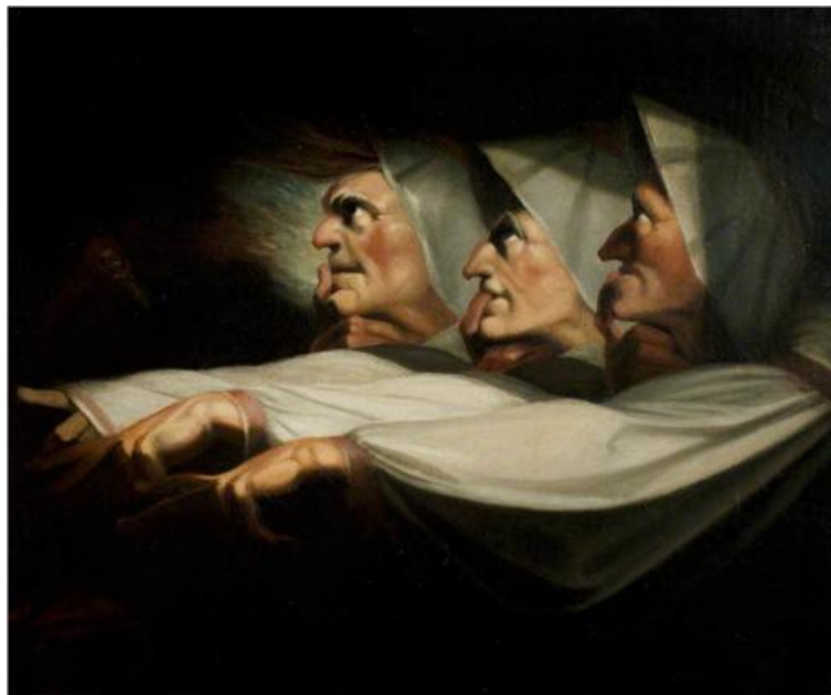
Füssli, Johann Heinrich, 'Macbeth', Act I, Scene 3, the Weird Sisters , Royal Shakespeare Company Collection, Stratford-upon-Avon, 1783.