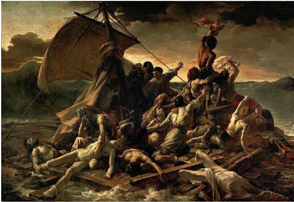
Géricault, Théodore, Le Radeau de la Méduse , Musée du Louvre, Paris, 1818-1819.