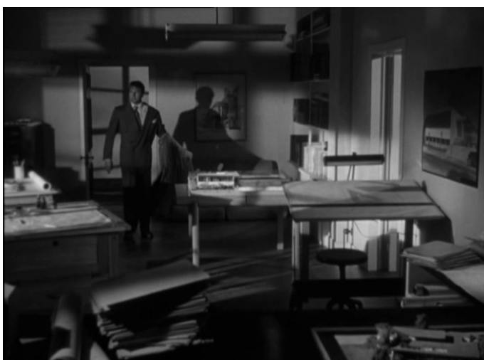
Mark rentre dans le bureau, Le Secret derrière la porte , Fritz Lang, 1948.