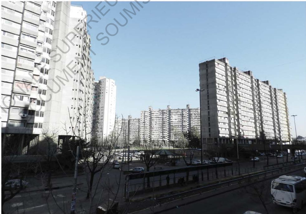
- Villa Lugano I y II