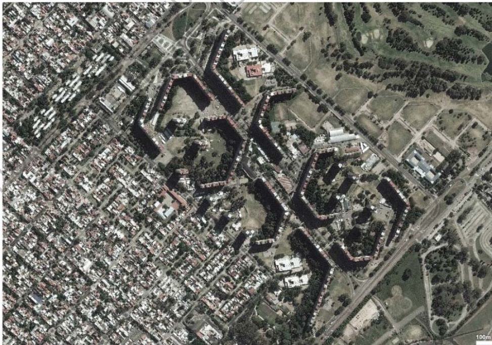
- Vue satellite de Villa Lugano I y II

Les ensembles de Lugano I et II s'étendent de part et d'autre de l'avenue Soldado de la Frontera, Les flux sont séparés, des rues piétonnes élevées entourées de commerces se situent au premier niveau de chaque bâtiment. Ces rues sont connectées entre elles par de fines passerelles. Le flux des piétons est séparé des rues au niveau du sol, réservées elles à la voiture. L'ensemble compte une série complète d'équipements et d'infrastructures, et notamment un centre civique composé d'un supermarché, d'une poste, d'une salle d'attention médicale, d'une église, de salles pour les différents clubs sociaux et sportifs, etc.