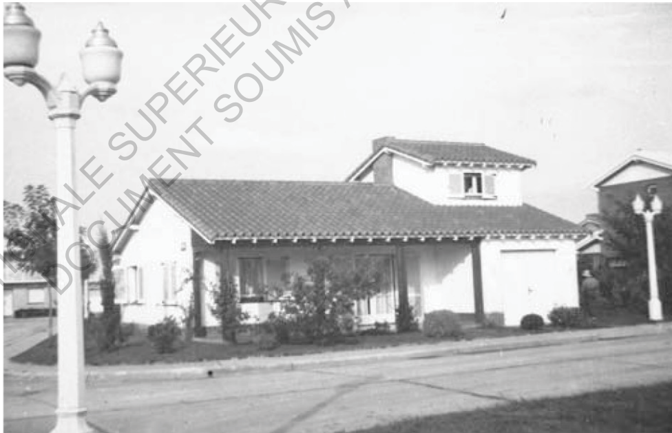
- Chalets Californianos du Barrio Juan Peron (1949)