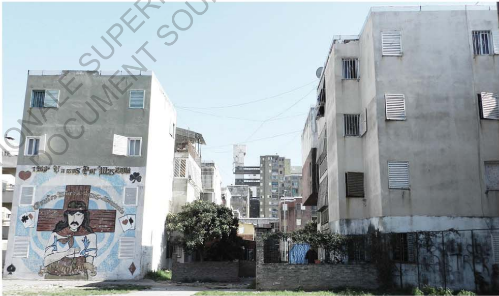
- Villa Soldati