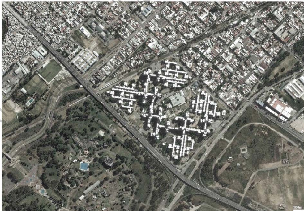
- Vue satellite de Villa Soldati

L'ensemble de Soldati, projet pensé par l'atelier STAFF, se situe aussi dans la partie sud-ouest de la ville de Buenos-Aires. Il est composé de deux types de bâtiments. Le premier type peut être décrit comme immeuble-barre. Il se développe sur trois ou quatre étages de façon horizontale et compte près de 1400 logements. Le deuxième type est la tour, car elle est de plus grande hauteur et peut se développer de huit à seize étages. Les tours de l'ensemble contiennent 1800 logements. Le quartier possède lui-aussi son lot d'équipements et de services. On y trouve des écoles, centres commerciaux, centres pour les associations... L'ensemble s'organise selon une trame orthogonale, et les différents bâtiments se lient entre eux par des systèmes d'escaliers et de passerelles qui viennent perturber les rues intérieures. On peut relever dans cet ensemble la plus grande fragmentation et la complexité des relations entre les éléments. En élévation aussi, les tours et les barres n'ont jamais la même taille.