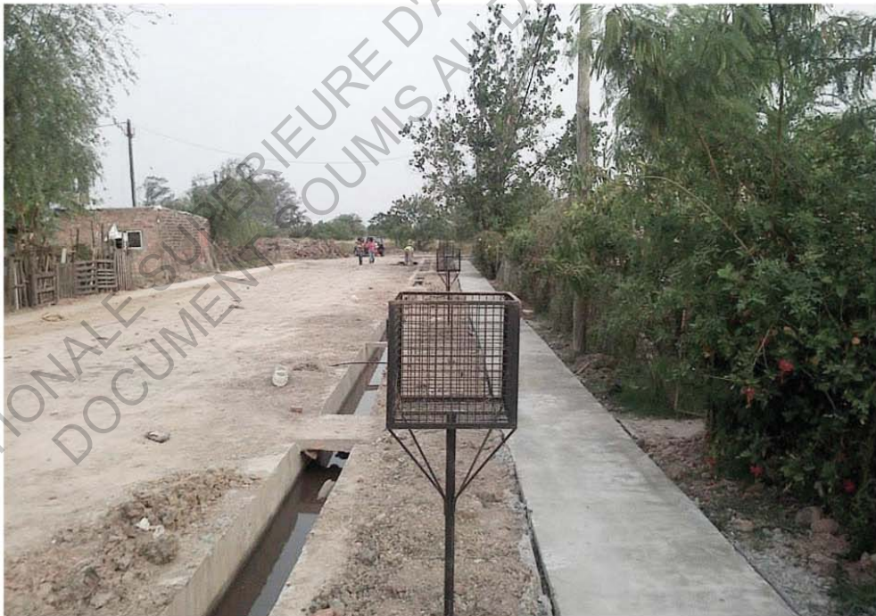
- Exemple de réalisation du programme PROMEBA : travaux d'«urbanisation» du quartier de Familias Unidas de la Ciudad de Resistencia, province du Chaco