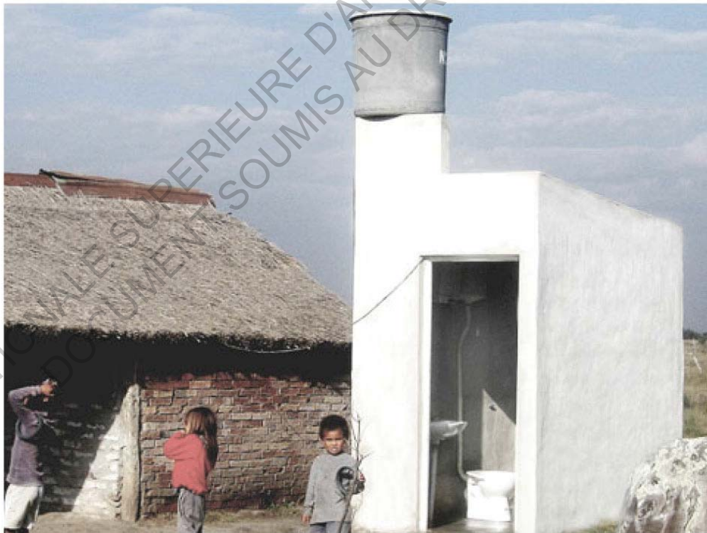
- Exemple de réalisation du programme PROSOFA : Construction de toilettes pour 5 familles de San Jaime de la Frontera, province d'Entre Rios.

Le financement des équipements urbains, le développement des réseaux associatifs et d'organisation de micro-productions participent au développement local et à l'inclusion sociale. Le but est d'intégrer les populations discriminées à l'ensemble urbain.