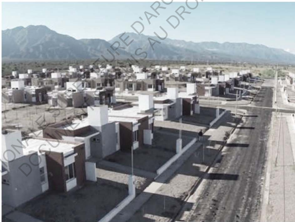
Exemple de réalisation du programme PROCREAR : - projet de 628 logements à Tandil, province de Buenos-Aires - projet en construction à la Rioja, province de la Rioja