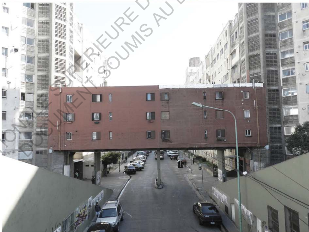
- Conjunto Piedrabuena