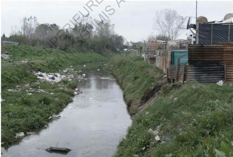
Villas Miserias à La Plata