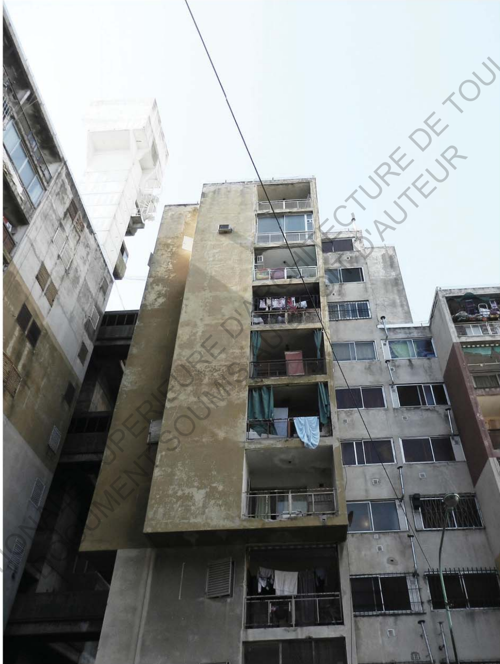
- Villa Soldati