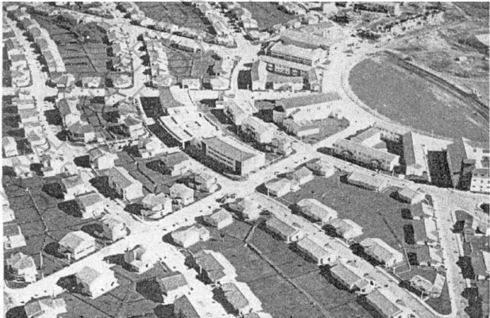
- plan de Ciudad Evita , reprenant le profil d'Eva Peron - Vue aérienne du Barrio Juan Peron (1949)