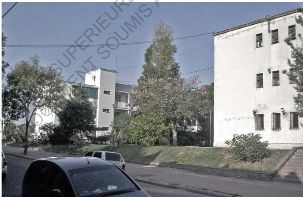
- Los Perales aujourd'hui