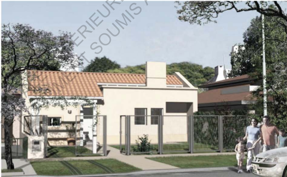
- Exemples de maisons individuelles proposées dans le catalogue officiel du programme PROCREAR