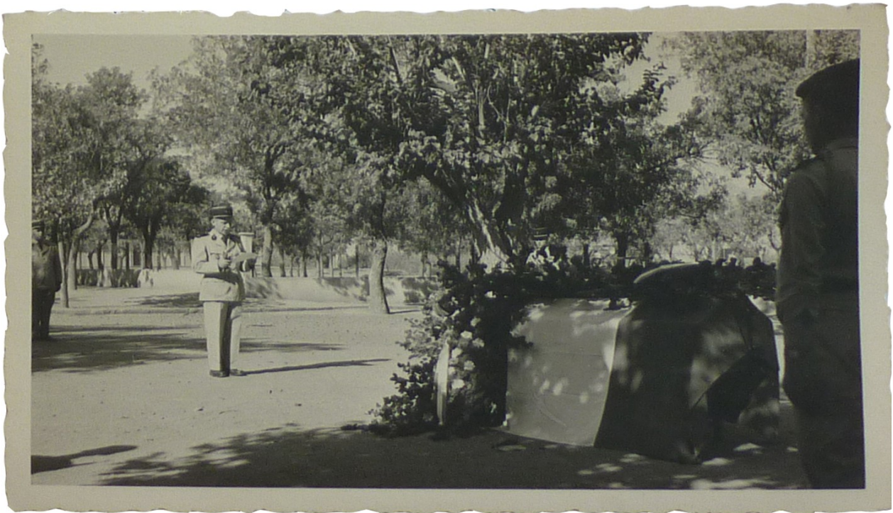
Cérémonie d'inhumation du frère de Madame G en Algérie, discours.

Ces deux dernières photos nous montrent les honneurs militaires qui sont rendus : piquet militaire