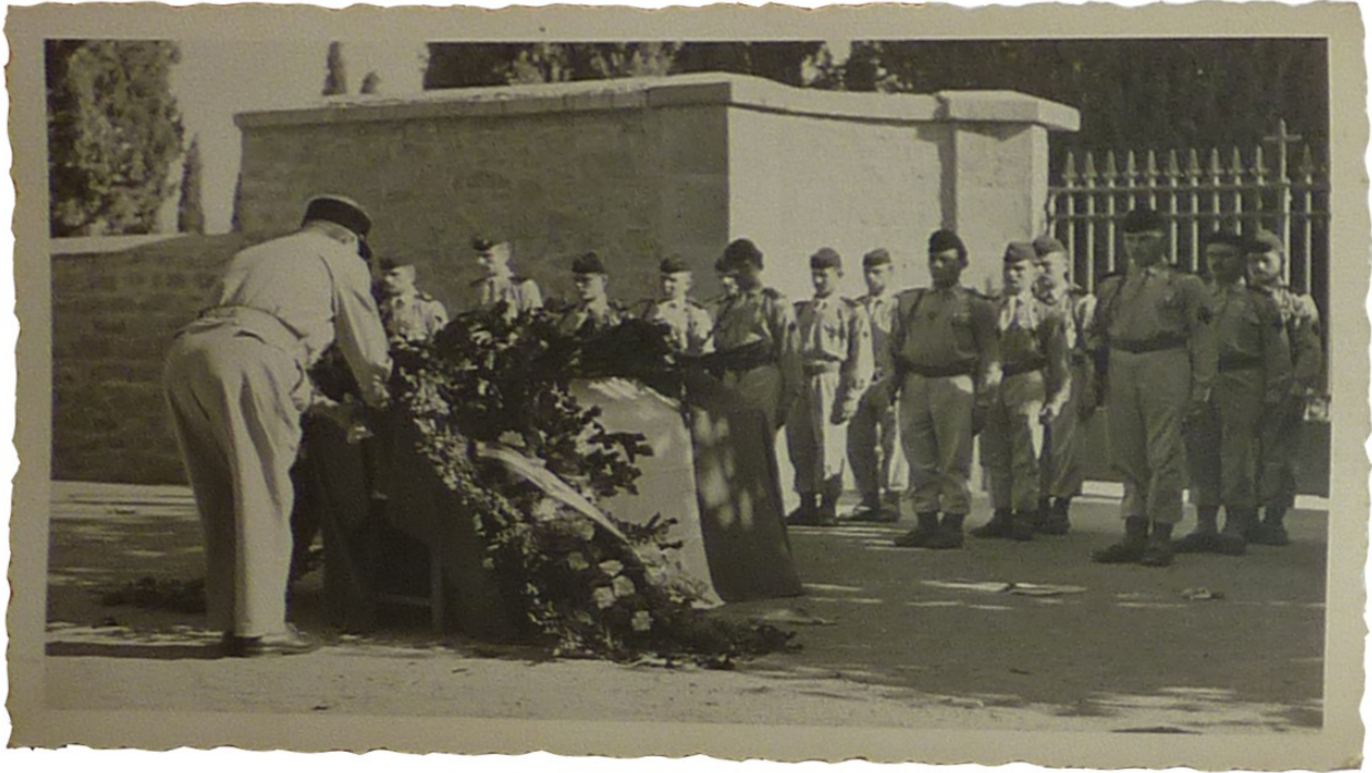
Cérémonie d'inhumation du frère de Madame G en Algérie, dépôt de gerbe.