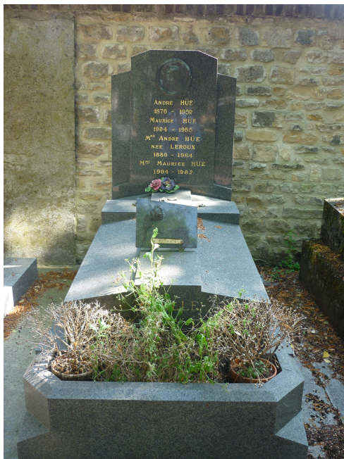
Sépulture famille Hüe. Cimetière Nord-Est, Caen.