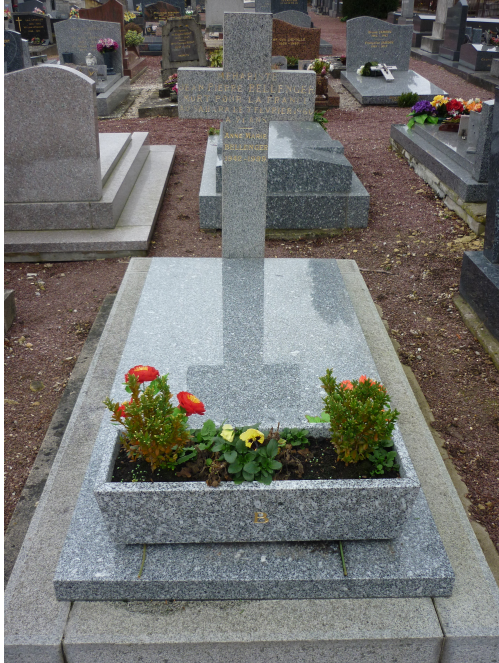
Sépulture famille Bellenger. Cimetière de Vaucelles, Caen.

Ici, un soldat d'Algérie est enterré parmi des soldats des deux guerres mondiales. Le carré est nettement délimité, la guerre et la reconnaissance de la nation sont présentes par le drapeau, l'inscription « République française », les poteaux en forme d'obus, et les plaques commémoratives qui expliquent qu'il s'agit de « Morts pour la France ».