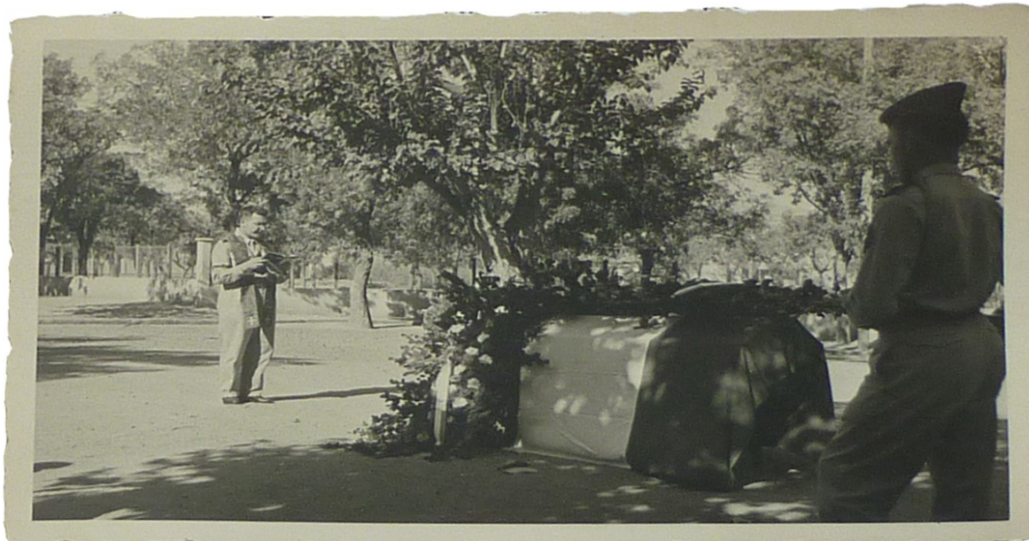
Cérémonie d'inhumation du frère de Madame G en Algérie, discours.

composé des anciens camarades du défunt, fleurs et drapeau français recouvrant l'ensemble du cercueil. Un discours est prononcé en l'honneur du défunt – par un militaire gradé au vu du képi, même si on ne peut distinguer ni sa couleur ni ses insignes, lorsque les autres militaires présents sur les photos ne portent que des calots – présentant la reconnaissance de l'armée et de la nation.