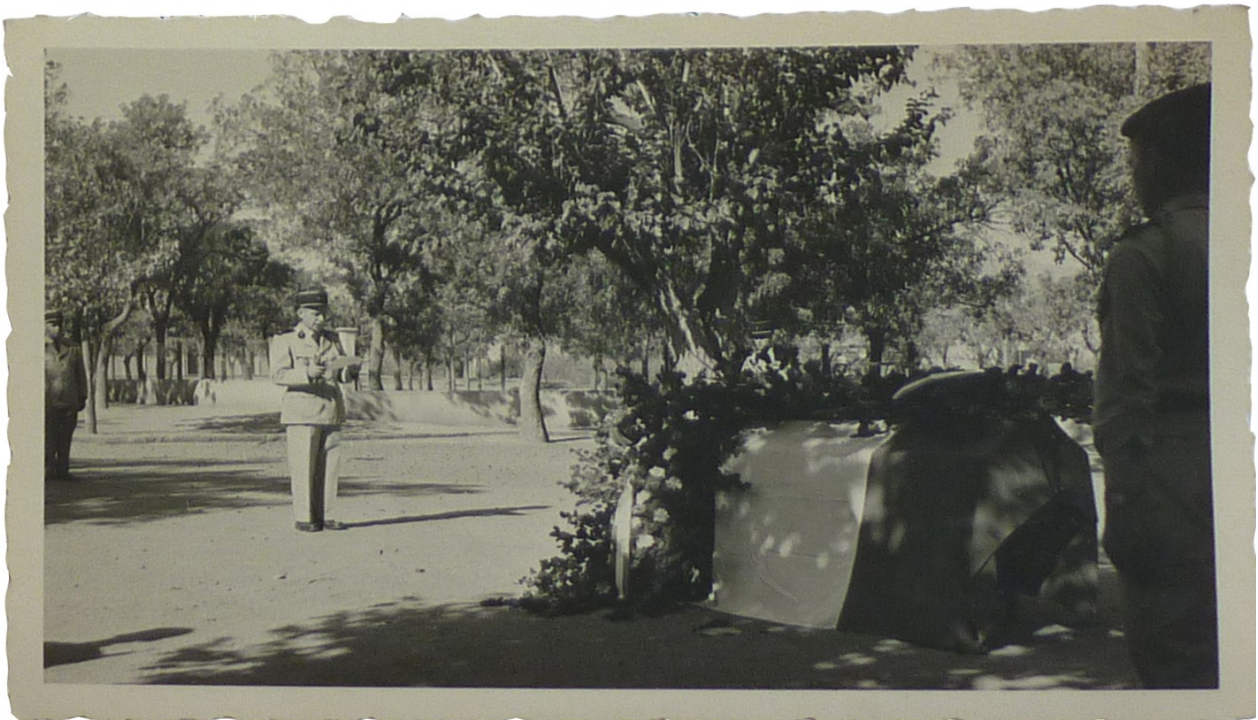
Cérémonie d'inhumation du frère de Madame G en Algérie, discours.

Ces deux dernières photos nous montrent les honneurs militaires qui sont rendus : piquet militaire