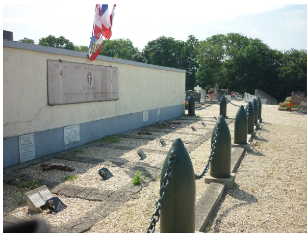
Carré militaire de Courseulles-sur-mer.