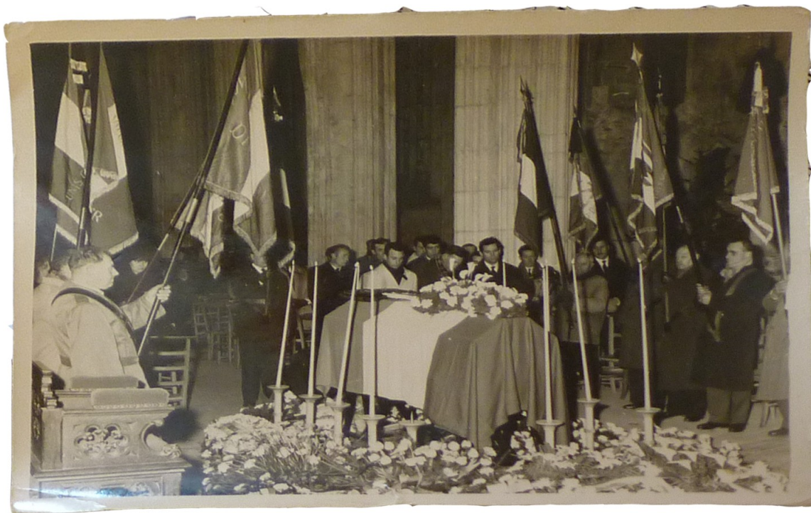
Enterrement du frère de Monsieur I.

La presse en témoigne également : tous les comptes-rendus d'obsèques s'ouvrent en décrivant « une foule particulièrement dense » 164 , « une foule importante et émue » 165 , « une assistance nombreuse et recueillie » 166 . Les photographies prises lors des enterrements ne peuvent que confirmer ce phénomène :