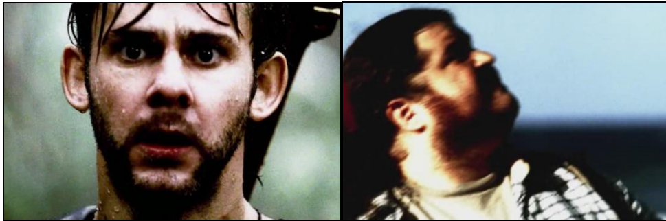
Plans des prémonitions de Desmond caractérisés par leur saturation.

lequel Desmond essaye en vain de sauver la vie de Charlie. La structure est alors construite de la manière suivante : Desmond a une vision prémonitoire ; les conditions de cette vision sont réunies dans le monde réel ; il tente et réussit à sauver Charlie ; cependant une autre vision aux mêmes caractéristiques, apparaît. Les séquences de prémonitions de Desmond sont caractérisées par une saturation des couleurs, qui les distingue de l'action réelle, mais pas toujours. En effet, certaines des visions, se confondent avec la trame de l'épisode, de sorte que l'idée de la mort de Charlie se concrétise chaque fois un peu plus. A la façon d'une spirale ininterrompue et inintermittible, l'engrenage sans fin mis en place par cette structure fait de Desmond et des autres personnages des victimes du fatum .