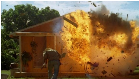
La destruction du village qui survient au retour des anciens rescapés dans les années soixante-dix.

Le seul moyen pour les rescapés d'exister est dans un lieu postmoderne, puisque la bulle de modernité qui a été construite par la Dharma Initiative ne peut exister dans un espace qui la rejette. C'est donc l'enjeu d'habiter un espace tel que l'île dans ces conditions qui se pose comme challenge pour les survivants.