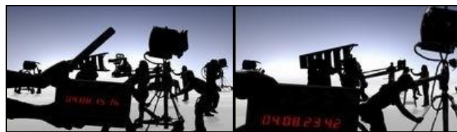
Présentation du studio de production ABC apparaissant à la fin de chaque épisode.

« Ce qui fait l'hallucination comme le mythe, c'est le rétrécissement de l'espace vécu, l'enracinement des choses dans notre corps, la vertigineuse proximité de l'objet, la solidarité de l'homme et du monde, qui est, non pas abolie, mais refoulée par la