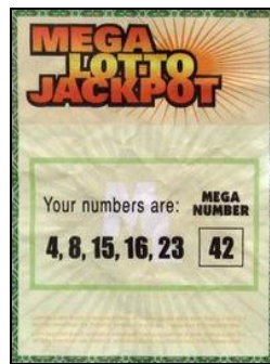
Billet ayant rendu Hurley millionnaire.