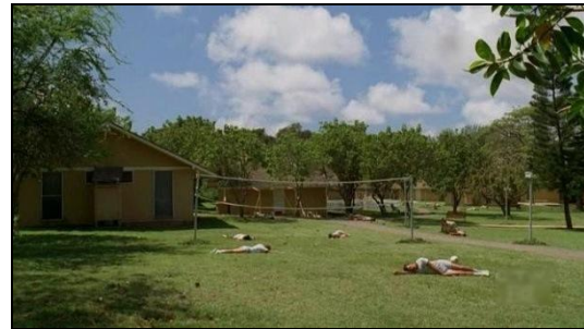
La purge commise par les Autres envers les membres de la Dharma Initiative en 1992.

L'espace reste le même, à la fois clos et ouvert. Dans ce contexte, les rescapés ne peuvent se l'approprier vraiment, dans la mesure où la présence de leurs corps en son sein ne s'apparente pas à une simple occupation ou appartenance, mais plutôt à une recherche d'occupation et d'appartenance qui y tend.