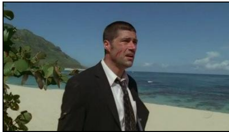
Le personnage de Jack a son arrivée sur l'île, quelques minutes après le crash.

Cet isolement est alors manifesté par la peur que ressentent les individus qui la découvrent pour la première fois. Cette peur se calque ainsi sur le statut même de l'île, qui, n'étant rattachée à rien, renvoie les rescapés à leur propre isolement. Les nombreux plans de personnages sur la plage de l'île regardant au large avec l'espoir de retrouver le monde qu'ils ont perdu feront se transformer progressivement ce désir en un constat que, même si ce monde extérieur existe quelque part, ils n'en font plus partie.