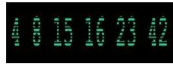
Code rentré dans l'ordinateur toutes les 108 minutes.