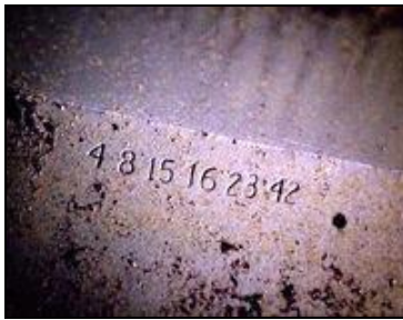
L'extérieur de la trappe au fond de laquelle se trouvait Desmond.

En sortant du monde de la série c'est, à l'instar de l'ami imaginaire, que les chiffres sortent du monde auquel ils appartiennent ; mais contrairement à ce à quoi on pourrait s'attendre, cet espace n'est ni l'île, ni le « hors-île », mais plus directement, le monde de Hurley.