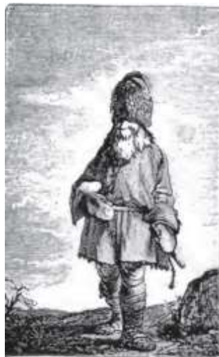
Figure 4 Image d'un paysan russe au XVIII e siècle d'après la gravure de Dalstein

Nous remarquons l'étonnement du Français en découvrant ces personnes ainsi vêtues tels des personnes de siècles antérieurs, cohabitant dans la même ville que des nobles habillés à la mode occidentale. Nous voyons que cette description est plus conforme à celle du dictionnaire de Moreri sur l'habillement des Russes.