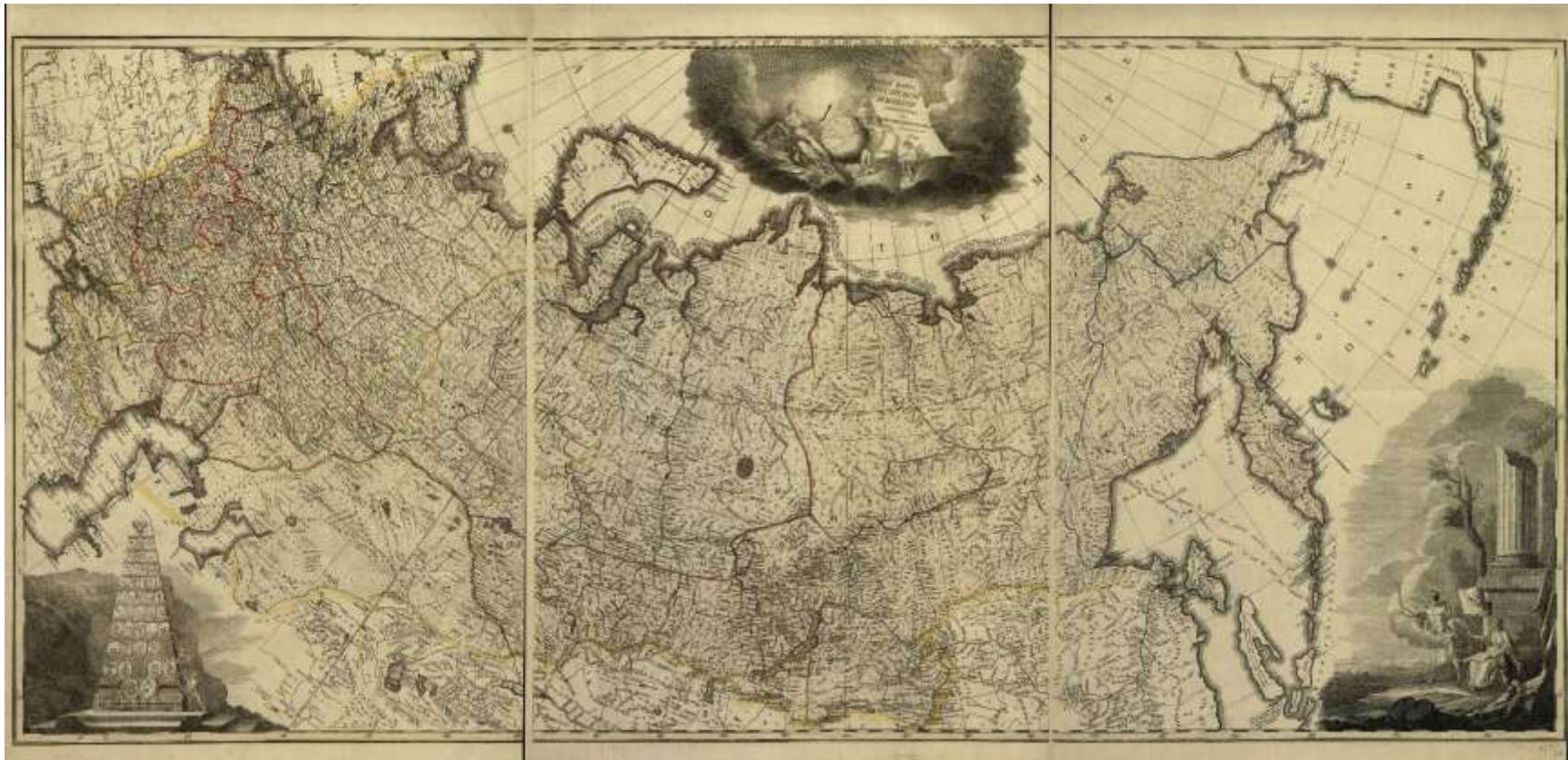
Figure 1 Carte de la Russie au XVIII e siècle datant de 1786