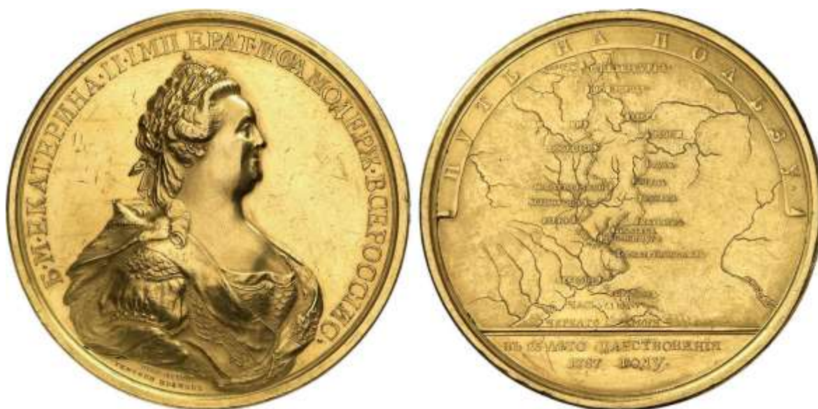
Figure 3 Pièce à l'effigie de Catherine II frappée lors de son voyage en Crimée

Image provenant du site https://www.numisbids.com/ mais étant présente dans le troisième tome des mémoires de Séjour.