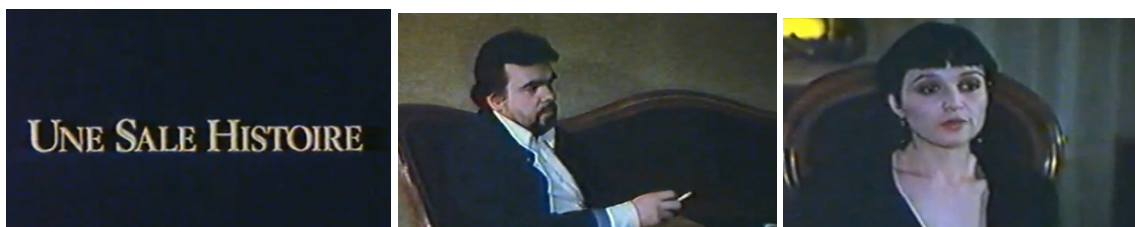
Une Salle Histoire , Jean Eustacle, 1978.