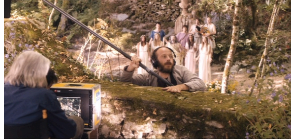
7 – L'ingénieur du son

Des acteurs souvent non professionnels et payés au tarif syndical, des loges dans les salles communales, une équipe réduite au strict minimum : ces conditions quasi-amateurs sont bien montrées dans Maestro . Si la réalisatrice a su bien documenter la méthode de Rohmer, c'est que Jocelyn Quivrin avec qui elle a élaboré le scénario, a pu prendre conscience sur le tournage des Amours d'astrée et Céladon qu'une telle méthode permettait au cinéaste de trouver les conditions pratiques de son autonomie d'auteur. Au moment où le Losange s'est institutionnalisé et a su découvrir d'autres horizons, Rohmer a pu, avec la CER, garder à l'œuvre les principes de cette indépendance.