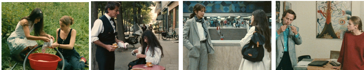
1 – De gauche à droite : « L'Heure Bleue », « Le Garçon de café », « Le mendiant, la cleptomane et l'arnaqueuse », « La Vente du tableau ».

En novembre 1984, le téléphone sonne avec insistance au Losange. Une jeune fille de 17 ans cherche à joindre Rohmer. Ce dernier, excédé, finit par lui répondre, mais il lui précise qu'il prépare un film et qu'il n'a de temps pour « personne ». La jeune fille réplique : « Justement, c'est mon nom ». Elle parvient ainsi à susciter l'intérêt de Rohmer.