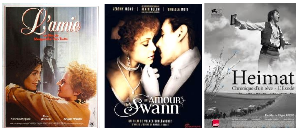
1 – L'amie , Margareth von Trotta, 1983 ; Un amour de Swann , Volker Schlöndorff, 1983 ; Heimat 75 , Edgar Reitz, 2013.

En second lieu, la liste des réalisateurs produits par le Losange durant cette première décennie de développement laisse voir l'importance d'un tropisme allemand : Margareth von Trotta, Volker Schlöndorff, Edgar Reitz [photogrammes 1].