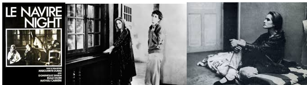
Le Navire Night , Marguerite Duras, 1978.