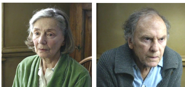
1. Emmanuelle Riva et Jean Louis Trintignant dans Amour (2012)

Pour les rôles principaux, Haneke souhaite solliciter Emmanuelle Riva et Jean-Louis Trintignant, deux acteurs importants pour le cinéma français et ayant joué avec les plus grands réalisateurs.