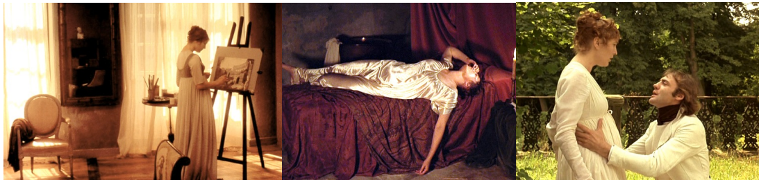
La Marquise d'O . (1976)