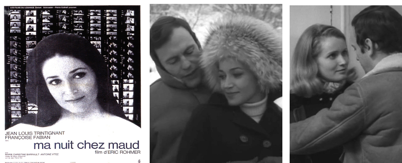
Ma Nuit chez Maud (1969)