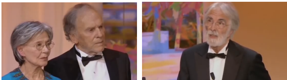
2 – Emmanuelle Riva, Jean-Louis Trintignant et Michael Haneke lors de la remise de la Palme d'Or pour Amour en 2012.

Le tournage a lieu sans ombrage, principalement en studio où Haneke a tenu à reconstituer à l'identique l'ancien l'appartement de ses parents. Malgré le sujet douloureux du film, les deux acteurs travaillent avec enthousiasme. Le film sort le 24 octobre 2012 en salle et fait plus de 700 000 entrées en France. Haneke reçoit pour le film une seconde Palme d'or à Cannes. Nanni Moretti, alors Président du jury, invite Emmanuelle Riva et Jean-Louis Trintignant à monter sur l'estrade afin de partager cette Palme avec le réalisateur [photogrammes 2].