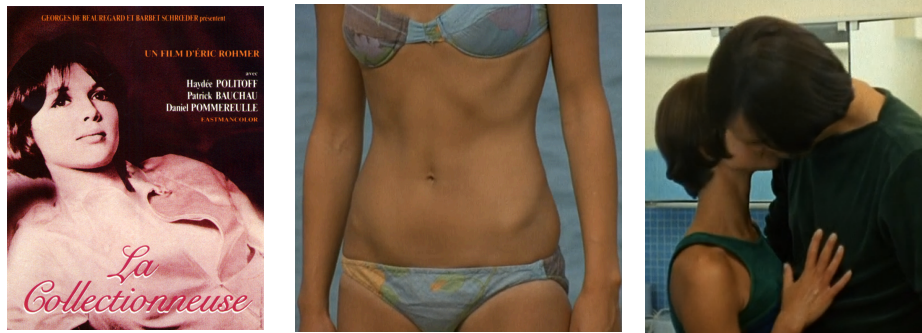
1 – La Collectionneuse .

nature tout court ) à l'état pur ». 63 La légèreté des propos est soutenue par la simplicité du cadre et du décor. Pour parfaire la postsynchronisation, Barbet Schroeder invite Georges de Beauregard (producteur de Jean-Luc Godard et de Jacques Demy) à une projection des rushes. Il donne son accord pour apporter l'argent de la post-synchronisation du film. Avec La Collectionneuse , Schroeder produit pour la première fois un long métrage de Rohmer conforme aux principes du Losange, c'est-à-dire un film de qualité avec très peu de moyens.