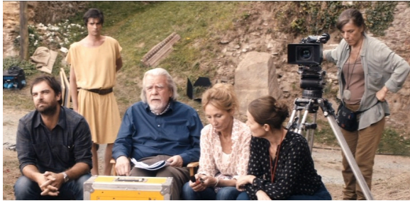
6 – Une équipe très réduite.