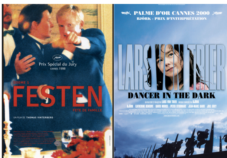
Affiches des films Festen (1998) et Dancer in the Dark (2000)

L'intégration au catalogue des auteurs du Dogme95 est un bon exemple de cette stratégie de développement. En 1996, la société démarre une collaboration, qui dure encore aujourd'hui, avec le réalisateur danois Lars Von Trier. 134 Connu également pour être l'un des fondateurs de ce que l'on peut rapidement considérer comme mouvement d'avant-garde, Lars Von Trier vient présenter en France, cette année là, son quatrième long-métrage, Breaking the waves . C'est le premier volet d'une trilogie. Il sera suivi par Les idiots (1998) et Dancer in the Dark (2000), eux aussi distribués en France par le Losange. Ces œuvres sont bien accueillies en France. En 2000, Dancer in the dark obtient un double prix à Cannes, la Palme d'Or et le prix d'interprétation féminine pour la prestation de Bjork. C'est encore le Losange qui distribue Festen (1998) de Thomas Vinterberg. Le film est salué à Cannes par la critique et obtient le Grand prix du Jury. Il trouvera son public avec plus de 600 000 spectateurs en salles.