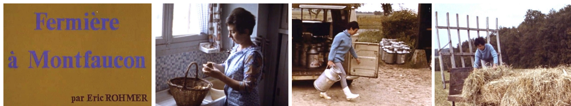
2- Une fermière à Montfaucon . Court-métrage d'Eric Rohmer - Série « La Femme française au travail », 1968.

Le film convainc les commanditaires du Ministère des Affaires Etrangères à poursuivre le financement d'autres films de la série sur une agricultrice [photogramme 2] et une sportive.