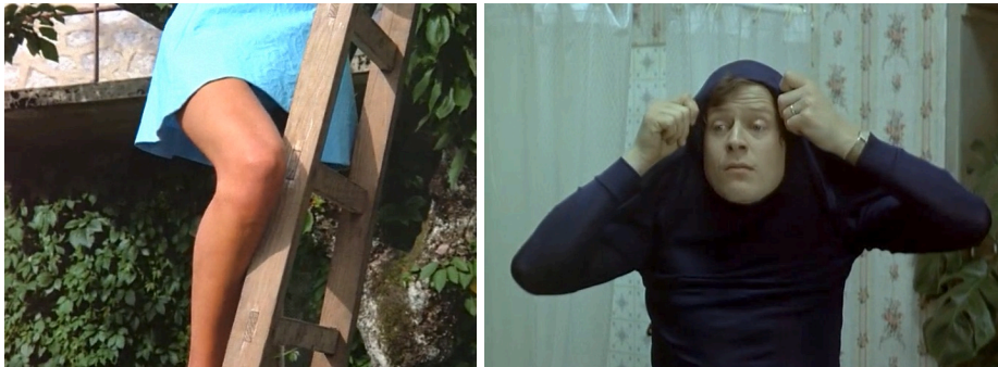
Le Genou de Claire (1970) et L'Amour l'après-midi (1972)

La consécration de Ma Nuit chez Maud permettra au Losange de produire plus facilement les deux derniers Contes Moraux, Le Genou de Claire (1970) et L'amour l'après-midi (1972).