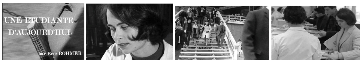
1. Une étudiante d'aujourd'hui . Court-métrage d'Eric Rohmer – Série « La Femme française au travail », 1966.

En parallèle, toujours impulsées par le dynamisme et la jeunesse de Barbet Schroeder, les activités du Losange se poursuivent. Schroeder a deux projets sous la main. Le premier est un film commandé par le ministère des affaires étrangères sur « La Femme française au travail » : une série de courts-métrages destinée aux ambassades, consulats et Alliances françaises à travers le monde [photogrammes 1]. L'autre projet de Barbet Schroeder est Paris vu par... , un ensemble de sketches sur certains quartiers de la capitale. En septembre 1963, Rohmer prépare donc le premier film de la série du ministère sur la vie d'une étudiante étrangère vivant à la Cité Universitaire.