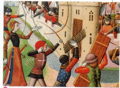
5 Jeanne devant Paris (miniature, XV e siècle, BNF, Paris)