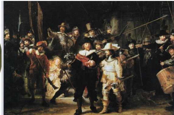
4 La Compagnie du capitaine Franz Banning Cocq ou La Ronde de nuit (1642) (Huile sur toile, 3,59 x 4,38 m, Rijksmuseum, Amsterdam.)

2 La Leçon d'anatomie du docteur Tulp (1632) (Huile sur toile, 1,69 x 2,16 m, Mauritshuis, La Haye.) Les médecins se sont fait représenter pendant leur leçon d'anatomie. Le professeur Tulp, grand chirurgien et homme d'affaires, fut élu à deux reprises maire d'Amsterdam.