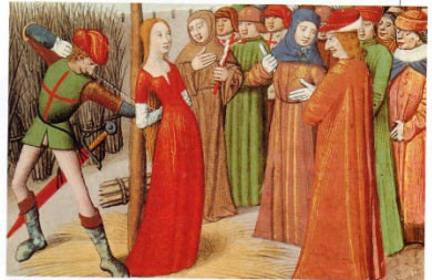
7 Jeanne sur le bûcher (miniature, XV e siècle, BNF, Paris)

« - Les juges: Quand vous vinîtes à Orléans, aviez-vous un étendard? - Jeanne: Un étendard semé de fleurs de lys (...); il portait ces deux mots écrits: Jésus, Maria. - Les juges: Qu'aimiez-vous mieux, votre étendard ou votre épée? - Jeanne: Beaucoup plus mon étendard que mon épée. Je portais moi-même cet étendard quand j'attaquais les ennemis pour éviter de tuer quelqu'un; je n'ai jamais tué personne. - Les juges: Quelle armée vous confia votre roi quand il vous mit à l'œuvre? - Jeanne: 10 ou 12 000 hommes. - Les juges: Étiez-vous sûre de faire lever le siège d'Orléans? - Jeanne: Dieu me l'avait révélé, et je l'avais dit à mon roi. » Interrogatoire du 27 février 1431.