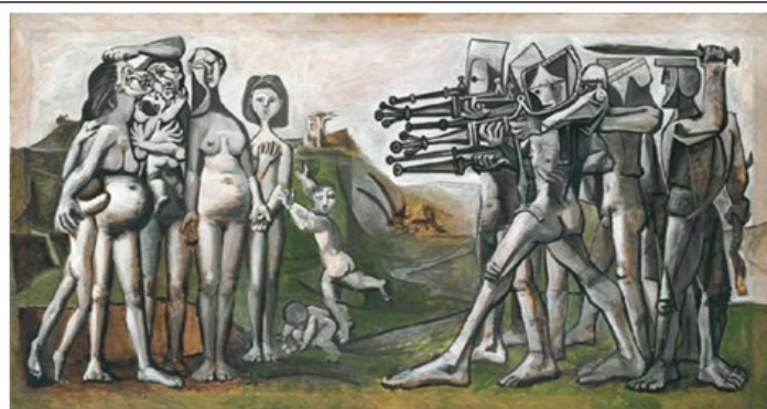
Massacre en Corée, Pablo Picasso, 1951.

En peinture, le romantisme est un courant pictural né à la fin du XVIII e siècle qui cherche à faire triompher les sentiments et les passions. Les artistes romantiques prennent souvent position pour les libertés.