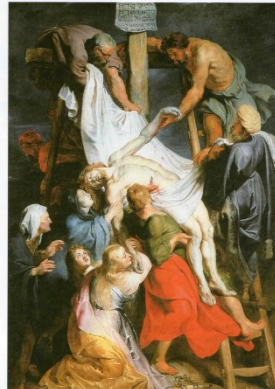
1 La Descente de croix de Rubens (Pays-Bas, 1616-1617, 4,25 x 2,25 m, musée des Beaux-Arts, Lille)

1 Quel est le sujet de la scène ? 2 Les corps sont-ils statiques, en mouvement ? 3 Comment Jésus-Christ est-il mis en valeur dans le tableau ?