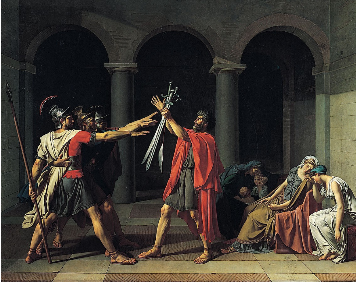
Annexe 7 : Le Serment des Horaces, Jacques-Louis David :