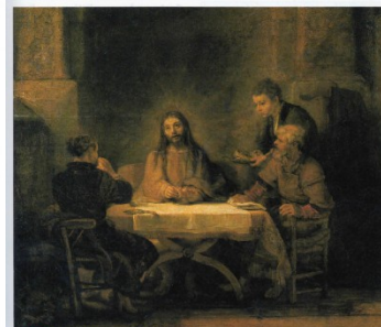
5 Les Pèlerins d'Emmaüs (1648) (Huile sur bois, 0,68 x 0,65 m, musée du Louvre, Paris.)

C'est la représentation d'une milice bourgeoise chargée de la police et de la défense de la ville d'Amsterdam.