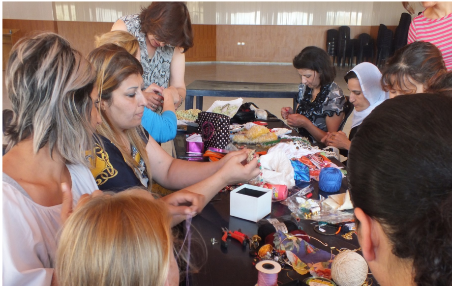
Illustration 3: Photo utilisée pour la communication d'Amel Association, sous-titrée : Handmade accessories class—Kfair and Ibl Saki groups, Southern Lebanon

Par ailleurs, Amel Association mène des programmes orientés vers l'aide aux réfugiés et aux libanais. Dans ces documents, nous remarquons que les bénéficiaires sont prioritairement les « femmes et les jeunes 112 ». En effet, l'association œuvre dans les domaines de l'enfance en partenariat avec l'UNICEF ou l'UNHCR, elle a mis en place des programmes spécifiques destinés aux femmes avec le partenariat UNWomen et OXFAM leur permettant d'apprendre l'artisanat puis la vente pour aller de la production au business. Au mois d'avril 2015, l'ONG a permis l'ouverture d'un magasin destiné à vendre les productions suite à la création de Menna 113 .