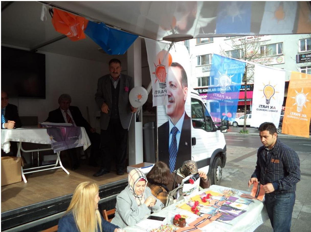
Mars 2014 : des militants de l'AKP font campagne dans l'arrondissement stambouliote de Şişli

LE PARTI DE LA JUSTICE ET DU DEVELOPPEMENT, OU L'« INUSURE » DU POUVOIR