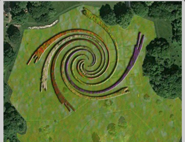
« Le tourbillon de l'histoire »

Andy Goldsworthy est un artiste britannique, né dans le Cheshire le 26 juillet 1956, qui produit des sculptures intégrées à des sites spécifiques urbains ou naturels. Il est l'un des principaux artistes du Land Art et utilise des objets naturels ou récupérés pour créer des sculptures éphémères ou permanentes faisant ressortir le caractère de leur environnement.