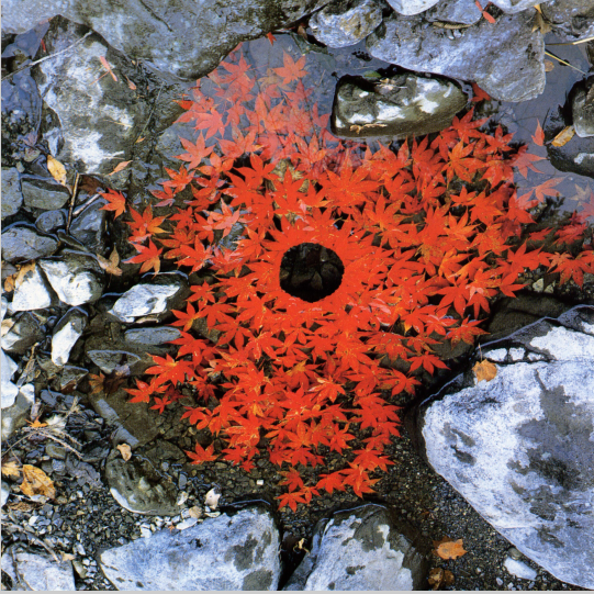
« Maple Leaves »

Andy Goldsworthy est un artiste britannique, né dans le Cheshire le 26 juillet 1956, qui produit des sculptures intégrées à des sites spécifiques urbains ou naturels. Il est l'un des principaux artistes du Land Art et utilise des objets naturels ou récupérés pour créer des sculptures éphémères ou permanentes faisant ressortir le caractère de leur environnement.