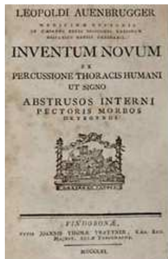
Figure II: Couverture de l'ouvrage écrit par Léopold Auenbrugger

approfondie et publia en 1761 un ouvrage en latin intitulé : « Inventum novum ex percussione thoracis humani ut signo abstrusos interni pectoris morbos detegendi » (« Nouvelle invention pour détecter les signes des maladies cachées de la poitrine par la percussion du thorax chez l'homme »). C'est ainsi qu'il est considéré comme l'inventeur de la percussion thoracique.