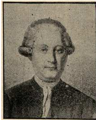
Figure I: Illustration représentant Léopold Auenbrugger (1722-1809)

La notion de palpation dans le diagnostic médical prend toute son importance lorsque la découverte de la percussion par l'autrichien Léopold Auenbrugger en 1761 est devenue un outil de diagnostic courant en 1808 grâce à Jean Corvisart 2 .