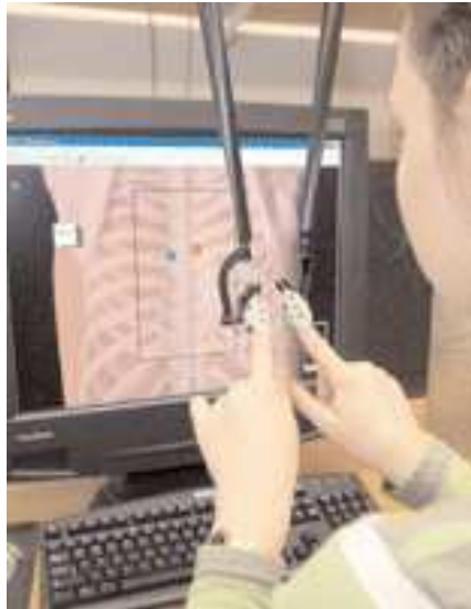
Figure IIII: Photographie présentant une utilisation du VHB.

Les petits moteurs électriques construits dans les bras fournissent la résistance au mouvement des doigts qui simulent les propriétés extérieures d'un dos d'humain. La simulation permet à des utilisateurs de pratiquer, détecter et localiser les modèles de conformité qui reflètent des anomalies médicalement observées.