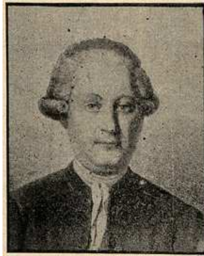
Figure I: Illustration représentant Léopold Auenbrugger (1722-1809)

La notion de palpation dans le diagnostic médical prend toute son importance lorsque la découverte de la percussion par l'autrichien Léopold Auenbrugger en 1761 est devenue un outil de diagnostic courant en 1808 grâce à Jean Corvisart 2 .