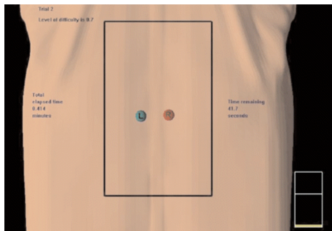
Figure V : Image donnée par le VHB lors du test palatoire

Les régions anormales dans le VHB sont placées de chaque côté des processus transverses de la colonne thoracique de la vertèbre T5 à T10. Sur cette photo, la fonction transparence est activée, révélant les éléments osseux du dos virtuel.