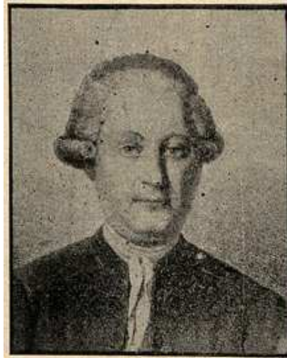
Figure I: Illustration représentant Léopold Auenbrugger (1722-1809)

La notion de palpation dans le diagnostic médical prend toute son importance lorsque la découverte de la percussion par l'autrichien Léopold Auenbrugger en 1761 est devenue un outil de diagnostic courant en 1808 grâce à Jean Corvisart 2 .