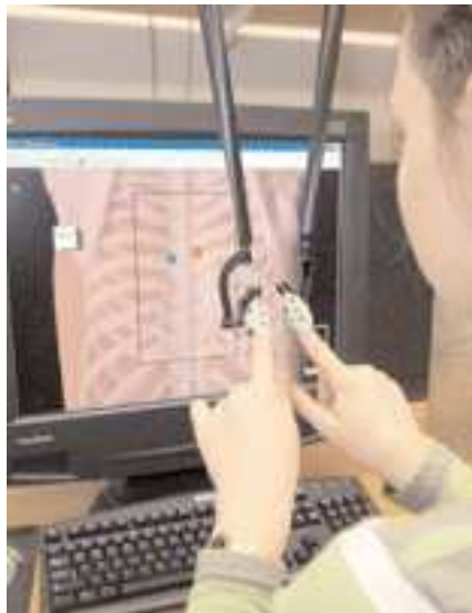
Figure IIII: Photographie présentant une utilisation du VHB.

Les petits moteurs électriques construits dans les bras fournissent la résistance au mouvement des doigts qui simulent les propriétés extérieures d'un dos d'humain. La simulation permet à des utilisateurs de pratiquer, détecter et localiser les modèles de conformité qui reflètent des anomalies médicalement observées.