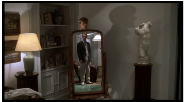
Le Talentueux Mr. Ripley , 39:53.

Dickie : Ca t'ennuierait d'enlever mes fringues ?