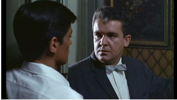
Plein soleil , 1:04:55. Freddy Miles est consterné de tomber sur Tom au lieu de Philippe ...

Mais ici aussi, Tom perd de sa superbe en réalisant qu'un problème d'ordre majeur vient de se présenter. Nerveusement, il cligne des yeux. Puis, pendant que Freddy pose des questions de plus en plus embarrassantes, Tom pose sa main sur un lourd bouddha, ce qui déclenche chez le spectateur l'idée que cet objet si pacifique pourrait devenir une arme redoutable.