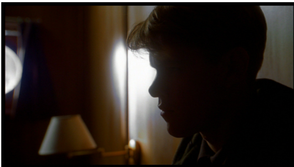
Le Talentueux Mr. Ripley , 2:08:14. L'image de la fin correspond à celle du début du film, signifiant que tout a été dit.

Le souvenir de ses relations avec Dickie lui traversa l'esprit comme un cauchemar, comme un fantôme livide et maléfique. « C'était, se dit-il, parce que la même chose pouvait arriver avec Peter. » Peter, l'intègre, Peter, qui ne soupçonnait rien, le naïf, le généreux, le brave type – la seule différence, cette fois, c'était que lui, Tom, ne ressemblait pas assez à Peter. 147