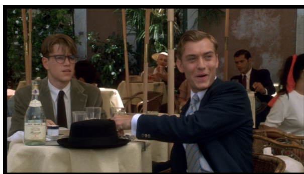
Le Talentueux Mr. Ripley , 36:27. Freddie Miles arrive. Tom ne semble pas apprécier l'intrus.

Si Tom parle de Freddy péjorativement comme d'un « clown » dès le début de Plein soleil , Freddy exprime son antipathie pour Tom quelques instants après. Voici le dialogue dans la première scène du film entre Philippe Greenleaf et Freddy Miles après que Greenleaf l'a invité à s'asseoir à leur table (03 :05 à 03:16) :