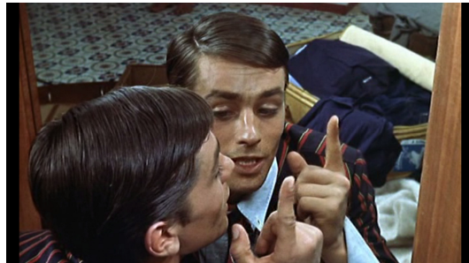
Plein soleil , 16:05.

Tom : Ma Marge, ma mie, mamour. Elle sait bien que je l'aime, ma petite Marge, que je ne l'abandonnerai jamais pour suivre le vilain monsieur que papa m'a envoyé.