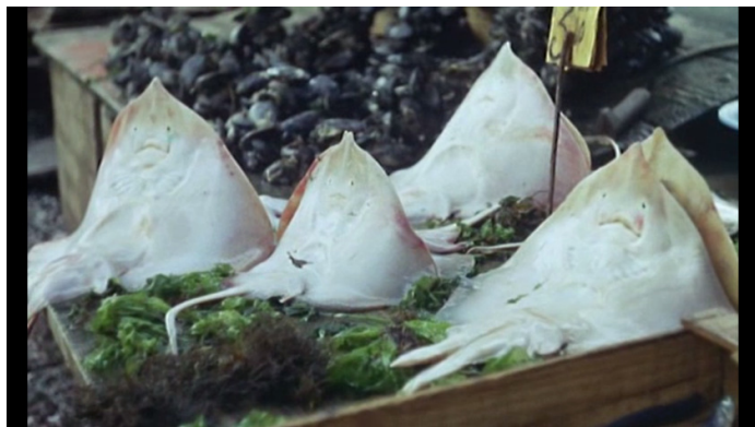
Plein soleil , 01:01:09. Les raies évoquent des masques blancs, mais semblent pourtant sourire à Tom.

s'affubler Tom ; la balance aux deux plateaux horizontaux, pour l'instant en équilibre, peut évoquer la justice encore immobile ; la tête tranchée du poisson, peut suggérer la peine capitale. 70