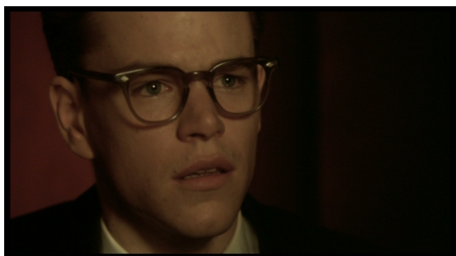
Le Talentueux Mr. Ripley , 1:10:02. Tom voit son acte comme dans un miroir.

La séquence de l'Opéra illustre la première vraie difficulté que rencontre Tom de devoir assumer deux personnages. D'abord ravi de retrouver l'univers de son ancienne vie et son amour pour la musique classique, Tom est fasciné par l'« air de Lenski » dans Eugène Onéguine de Tchaïkovski. Puis, quand Onéguine tue son rival et meilleur ami sur scène, plusieurs gros plans de Matt Damon, accablé, entre lesquels des plans subjectifs sur l'action scénique s'intercalent en contrechamp, induisent l'idée que Tom