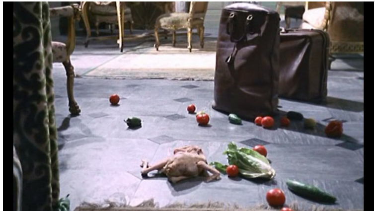
Plein soleil , 1:07:55. Les denrées tombées du panier et éparpillées sur le sol sont une métonymie de la mort de Freddy.

des mains de la concierge et remonte à grandes enjambées, tandis que Tom, paniqué, retourne dans l'appartement, se cache derrière la porte d'entrée, et, de façon improvisée, attrape le bouddha, et non un cendrier en cristal.