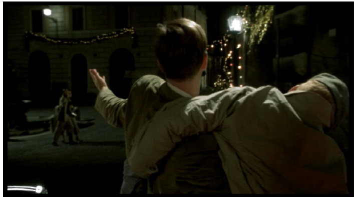
Le Talentueux Mr. Ripley , 1:24 :45. Le spectateur regarde dans la même direction que Tom et devient ainsi comme Tom acteur de la situation.

Dans Le Talentueux Mr. Ripley , Tom n'accuse pas directement Dickie du meurtre de Freddie, mais Minghella l'insinue par la réplique que Tom donne à Marge peu avant de supprimer Freddie (1:18:58): « À chaque fois que Dickie agit mal, je me sens coupable. ». Par ailleurs, la séquence est très courte, c'est-à-dire que sa durée dépasse à peine une minute. Effectivement, Anthony Minghella fait l'économie des préparatifs de Tom dans l'après-midi, ainsi que de la descente dans l'escalier. Au plan du buste maculé de sang succède un plan de la porte de l'immeuble (1:24:24) qui s'ouvre sur le haut du corps de Freddie, penché sur la gauche, la tête coiffée d'une casquette. Tom apparaît à droite de l'écran, soutenant sa victime.