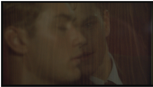
Le Talentueux Mr. Ripley , 51:32. Les deux visages se confondent dans le surcadrage.

Tandis que Philippe, dans Plein soleil , réplique aux supplications de Tom qu'il se rendra à San Francisco pour que celui-ci touche l'argent, d'un air qui contredit ses paroles, Dickie, dans Le Talentueux Mr. Ripley , propose à Tom un voyage à San Remo, en guise d'adieu.