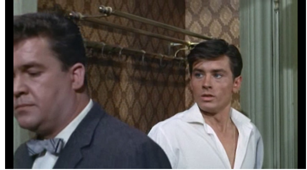
Plein soleil , 1:05:00. ... et Tom ne s'attendait pas à voir Freddy Miles.

Si Freddy est surpris de le voir dans l'appartement de Philippe, il comprend encore moins l'absence de ce dernier à leur rendez-vous de Taormine, lieu qui remplace ici celui de Cortina. De plus, il trouve étrange que Tom porte les chemises aux initiales de son ami (au lieu du bracelet et de l'épingle à cravate du roman). Son étonnement va grandissant lorsqu'il aperçoit la lettre de rupture dans la machine à écrire. Et bien que Tom nie en être l'auteur, Freddy est quasiment certain d'avoir entendu taper à la machine avant d'entrer. Finalement, il part, après avoir renseigné Tom sur la présence de Marge à Rome, et non sans faire une remarque sur le fait que Tom porte également les chaussures de Philippe.