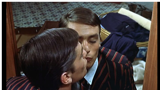
Plein soleil , 16:11.

Tom : Ma Marge, ma mie, mamour. Elle sait bien que je l'aime, ma petite Marge, que je ne l'abandonnerai jamais pour suivre le vilain monsieur que papa m'a envoyé.