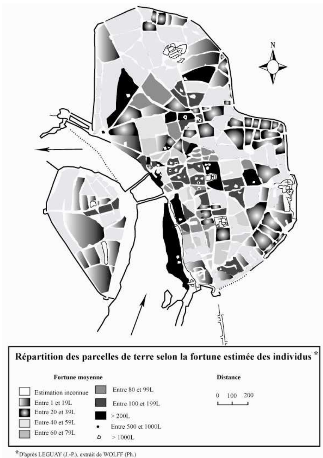
Figure 2: Répartition des terrains selon le revenu

D'après LEGUAY (J.-P.), « Moyenne, extrait de Ph. Wolff, « Regards sur le Midi Médiéval », pages 271 et 274, Fortunes et professions », dans La rue au Moyen Age , De mémoire d'homme ouest France université, Rennes, 1984, p120