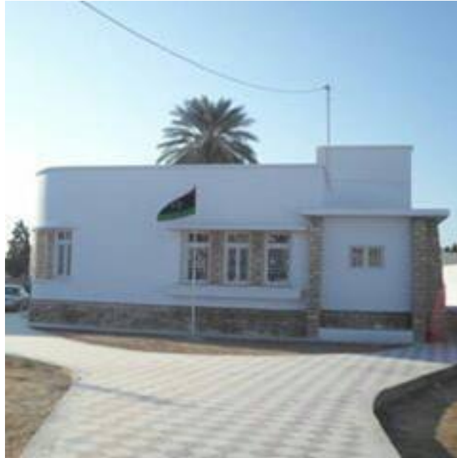
Ecole libyenne de Sfax en mars 2015. 68