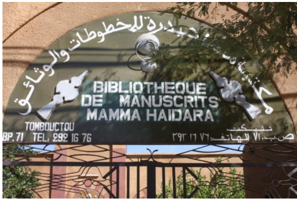
La bibliothèque de monsieur Haidara