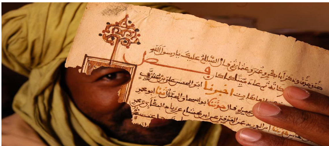
b Cataloguing the Timbuktu Libraries.