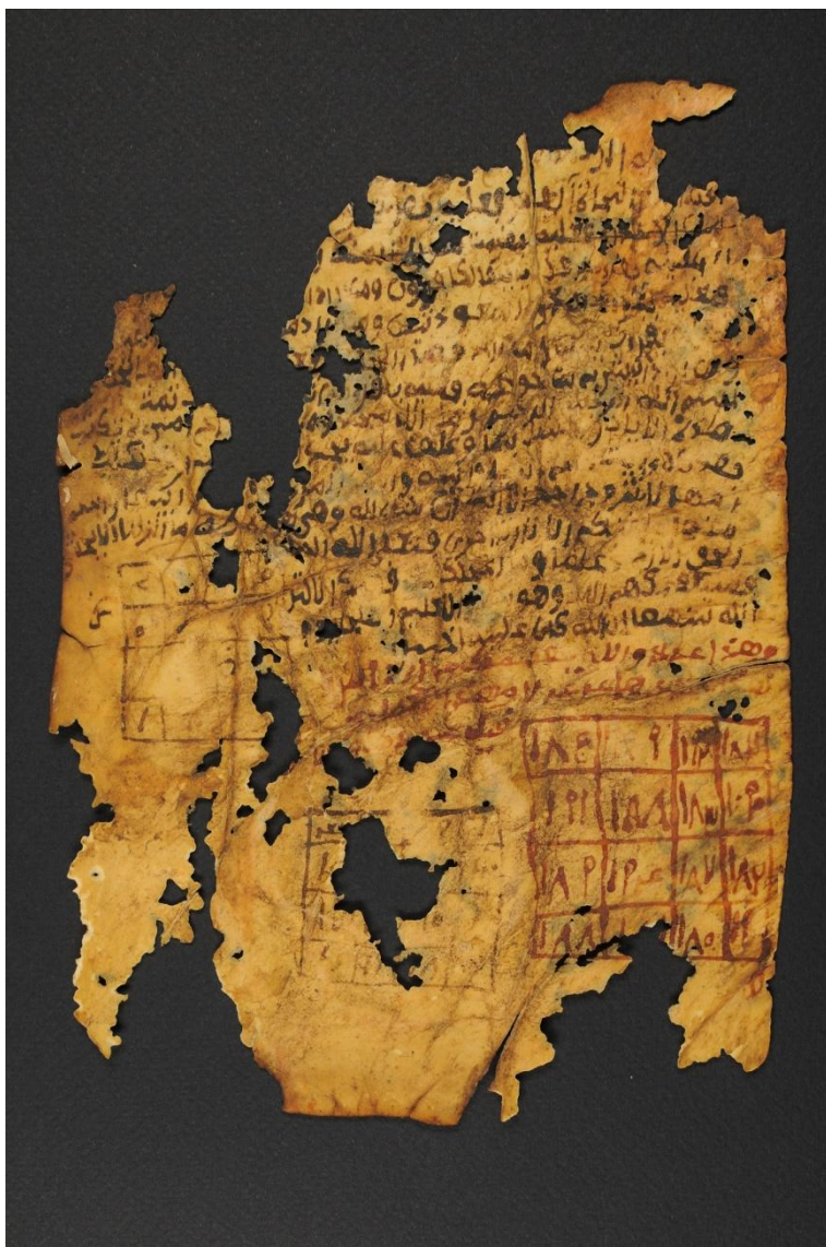
Le feuillet d'un manuscrit endommagé