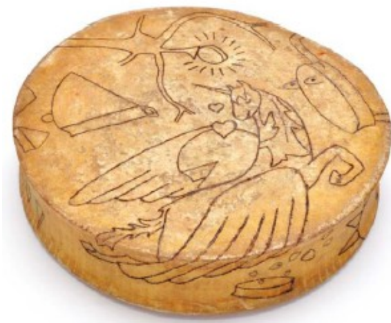
Beaufort pyrogravé, Laurent Mriceau, Fondation Facim, 2014

Le projet mené par Laurent Moriceau avec un groupe de collégien permet donc de porter un regard original, décalé et inédit sur l'expression de la culture savoyarde.