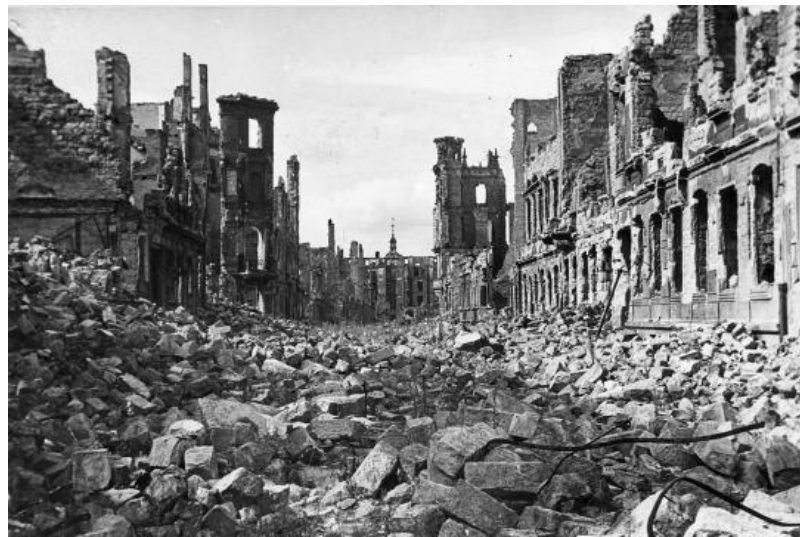
Bild 8 : Dresden nach dem 13. und 14. Februar 1945, Foto von Willy Roßner

lichterloh. Ich konnte das Einzelne nicht unterscheiden, ich sah nur überall Flammen, hörte den Lärm des Feuers und des Sturms, empfand die fürchterliche innere Spannung. 362 In Zahlen: Es werden unter anderem 12 000 Wohnhäuser, 24 Banken, 26 Versicherungsgebäude, 647 Geschäftshäuser, 64 Speicher- und Lagerhäuser, 31 größere Hotels, 26 Gaststätten, 19 Krankenhäuser, 39 Schulen und der Zoo zerstört 363 . Die Schäden sind auf der Fotografie von Willy Roßner frappierend.