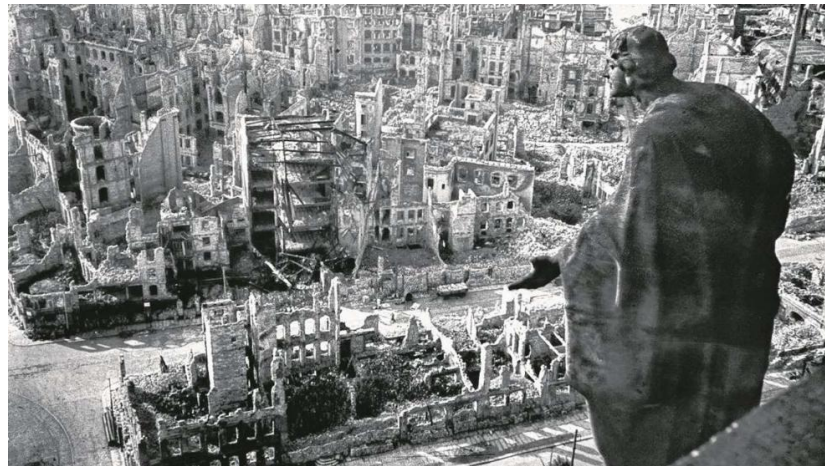
Bild 9 : Blick vom Rathaus über das zerstörte Dresden 1945

Anblick, den Tod und die Zerstörung: „Aus vielen Häusern der Straße oben schlugen immer noch Flammen. Bisweilen lagen, klein und im wesentlichen ein Kleiderbündel, Tote auf den Weg gestreut. Einem war der Schädel weggerissen, der Kopf war oben eine dunkelrote Schale. Einmal lag ein Arm da mit einer bleichen, nicht unschönen Hand.“ 365 Hier eine andere Fotografie, die das Ausmaß der Schäden zeigt: