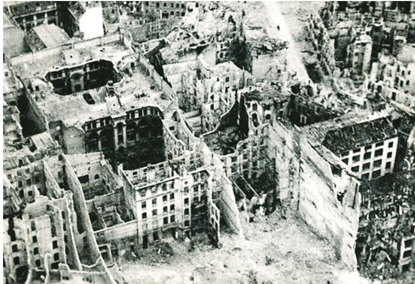
Bild 7 : Die Zerstörung Berlins, 1945 am Ende des Kriegs

Die Leute wissen, dass sie dem Tod nicht entinnen können, wenn sie solche Landschaften sehen. Alles wird aber niedergerissen. Die Trümmer stürzen auf die Straßen und die Häuser stehen nicht mehr. „ Der neueste Witz: ,Berlin ist die Stadt der Warenhäuser, hier war ’n Haus und da war ’n Haus. [...] Überall Trümmer. “ 346 Wegen der Bombardierungen stehen manchmal nur Halbhäuser oder ein Haus in einer Straße. Man kann hier noch einmal den schon erwähnten Zynismus bemerken. Die Zerstörung Berlins ist besonders sichtbar auf dieser Photographie.