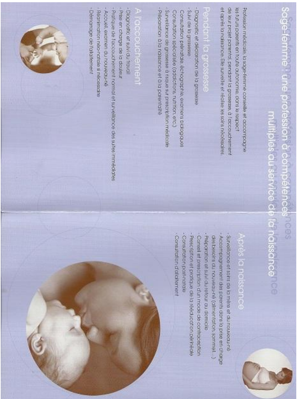
Figure II. ↑ Plaquette d'information "Tendresse & Passion : le métier de sage-femme" Fondation Mustela®