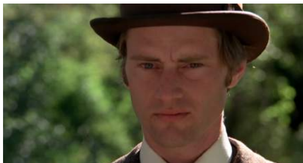
Photogrammes de Day of Heaven de Terrence Malick, 1979, d'un champ contre champ avec les deux personnages en contre jour

Ce champ contre-champ est relevé dans la séquence du mariage de ces deux personnages, qui se tiennent donc face à face. Or comme exposé précédemment, on peut observer une incohérence : pour créer un raccord fluide au niveau de l'intensité lumineuse sur les visages, Nestor Almendros a fait le choix de placer les deux personnages en contre jour.