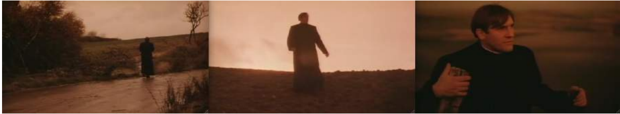
Photogrammes de Sous le Soleil de Satan de Maurice Pialat, 1987, du début de la séquence au crépuscule...

Dans Sous le Soleil de Satan de Maurice Pialat, il y a une séquence d'une vingtaine de minutes qui relève un pari technique audacieux : créer une continuité temporelle démarrant au crépuscule, en nuit Américaine, puis entre chien et loup, de nuit, puis enfin avec un retour au petit matin en nuit américaine et ce jusqu'au jour.