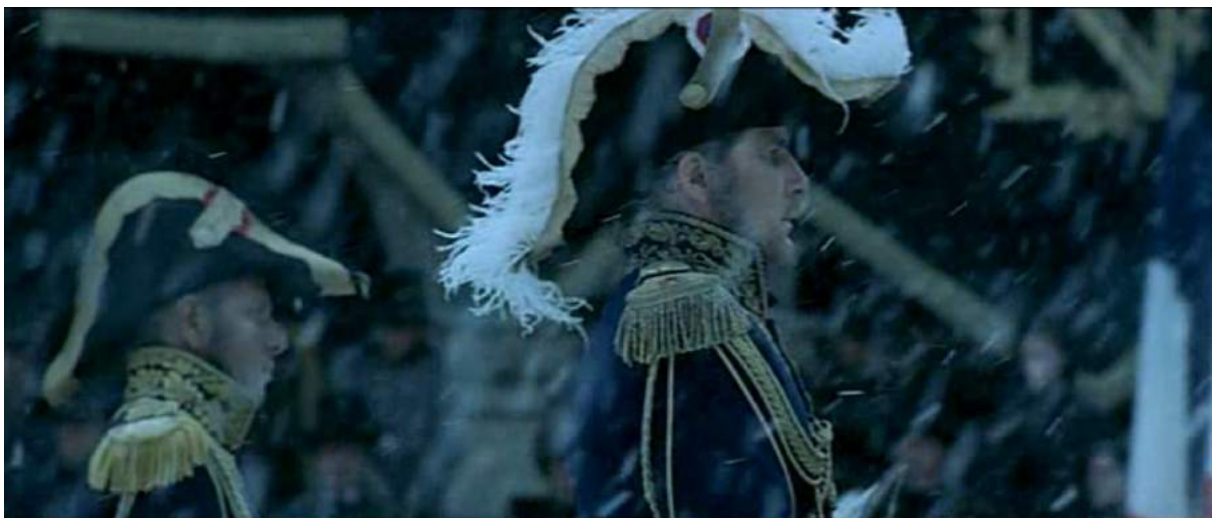
Photogramme du film Monsieur N d'Antoine de Caunes, 2003, durant la séquence sous la neige.

Voici un exemple de film de Pierre Aïm, pour qui l'utilisation de moyens de diffusion conséquents était déterminant : « J'ai fait un film, Monsieur N , sur Napoléon qui est naturaliste. Dans ce film, il y a une scène aux Invalides qui d'après les historiens devait être dans la neige et le froid, mais qu'on a été contraint de tourner en plein mois d'août ! Donc pour maîtriser le soleil, on a dû construire un énorme cadre de diffusion de 18m par 18m placé sur une énorme nacelle. Ça nous a permis de faire une impression de froid et de fausse neige. Les coûts de cette séquence juste pour couper le soleil étaient énormes, et résultat, on a l'impression qu'il n'y a rien. Le reste du temps d'ailleurs, il y avait très peu de lumière... »