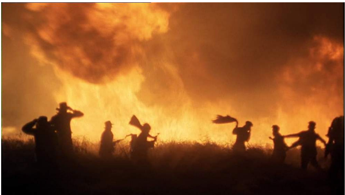
Photogrammes de Day of Heaven , de la scène de l'incendie avec les personnages « silhouettes »

En ce qui concerne les plans généraux de l'incendie, Nestor Almendros explique qu'ils « furent tournés tels quels, sans éclairage d'appoint, sans artifice. Les personnages doivent se découper sur les flammes, comme des peintures rupestres en négatif. » 27 Comme pour le ciel trop bleu et criard, il trouve que les incendies des superproductions ont le défaut d'être sur-éclairés et perdent leur force réaliste : ce qu'il a refusé ici. Ce rejet, ajouté à de nombreux choix esthétiques allant à l'encontre des normes établies par Hollywood, constitue une prise de risque qu'il fait encourir au film et à sa réception auprès du public. Son audace a finalement été récompensé par l'oscar de la meilleure photographie en 1979.