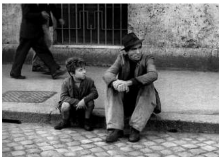
Ladri di Biciclette , (Le Voleur de Biciclette) de Vittorio da Sica, 1949, film tiré du courant néo-réaliste italien, réaliste mais avec une stylisation qui vient appuyer le propos, ici la pauvreté, avec un contraste légèrement renforcé et une pellicule donnant un aspect « brut » à l'image.

La lumière naturelle est la lumière se trouvant dans l'espace réel sans apport de sources dédiées au cinéma : en journée, la lumière du soleil. La nuit, ce serait la lune, mais un feu de camp peut également être considéré comme de la lumière naturelle même si elle est créée par l'homme. En revanche, les lampadaires dans les décors de ville sont considérés comme de l'éclairage urbain : ce n'est pas de la lumière naturelle, mais artificielle. Cependant, ce ne sont pas des sources dédiées au cinéma, au même titre que les praticables dans les décors d'intérieurs. Les éclairages urbains peuvent aider à donner une justification à une direction lumière, potentiellement renforcée par des sources artificielles dédiées au cinéma.