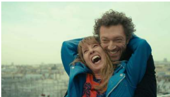
Mon Roi , de Maiwenn, tourné en lumière mixte.

Ces deux exemples démontrent que le contexte d'un tournage détermine « naturellement » le choix des moyens techniques utilisés. Dans L'inconnu du Lac , l'action se déroule majoritairement de jour en extérieur autour d'un lac ensoleillé : Claire Mathon a donc fait le choix d'utiliser la lumière naturelle pour réaliser sa lumière naturaliste. Dans Asphalte , l'action est principalement en intérieur dans les appartements d'un immeuble : Pierre Aïm a choisi de recréer une lumière naturaliste