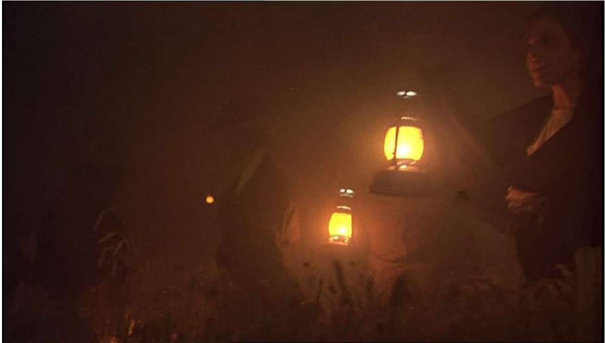
Photogramme de Day of Heaven représentant les personnages avec des lanternes électrifiées au quartz.