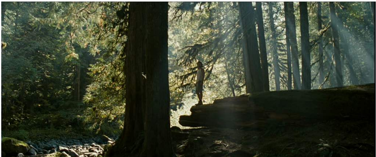
Photogramme d' Into The Wild de Sean Penn, 2008, dans la forêt en Alaska, l'été

C'est à partir du mois de juin que la nature est la plus impressionnante, soit en été, quand la neige a fondu et que la forêt reprend ses droits. « Cette nature dégage une force, il y a un truc qui s'en dégage qui est presque sexuel, on le sent sur place, c'était vivant, tous ces arbres, cette sève, qui poussent, ces animaux, tout, impressionnant, il n'y a pas d'autre mot : une puissance incroyable ! » 45