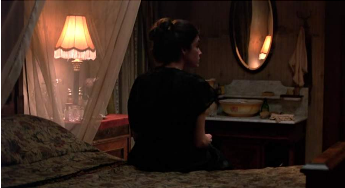
Photogramme de Day of Heaven de Terrence Malick, 1979, représentant Abby éclairée par la lumière des lampes domestiques

On peut observer sur ce photogramme que la lumière n'est émise que par le praticable : la lampe avec l'abat jour orange derrière le rideau blanc transparent. Cette lampe crée l'ambiance générale. La légère « attaque » lumineuse qu'on perçoit en contre sur son visage n'est autre que la lumière du même praticable réfléchi par le miroir et donc un peu plus intense car plus directe sur la peau d'Abby.