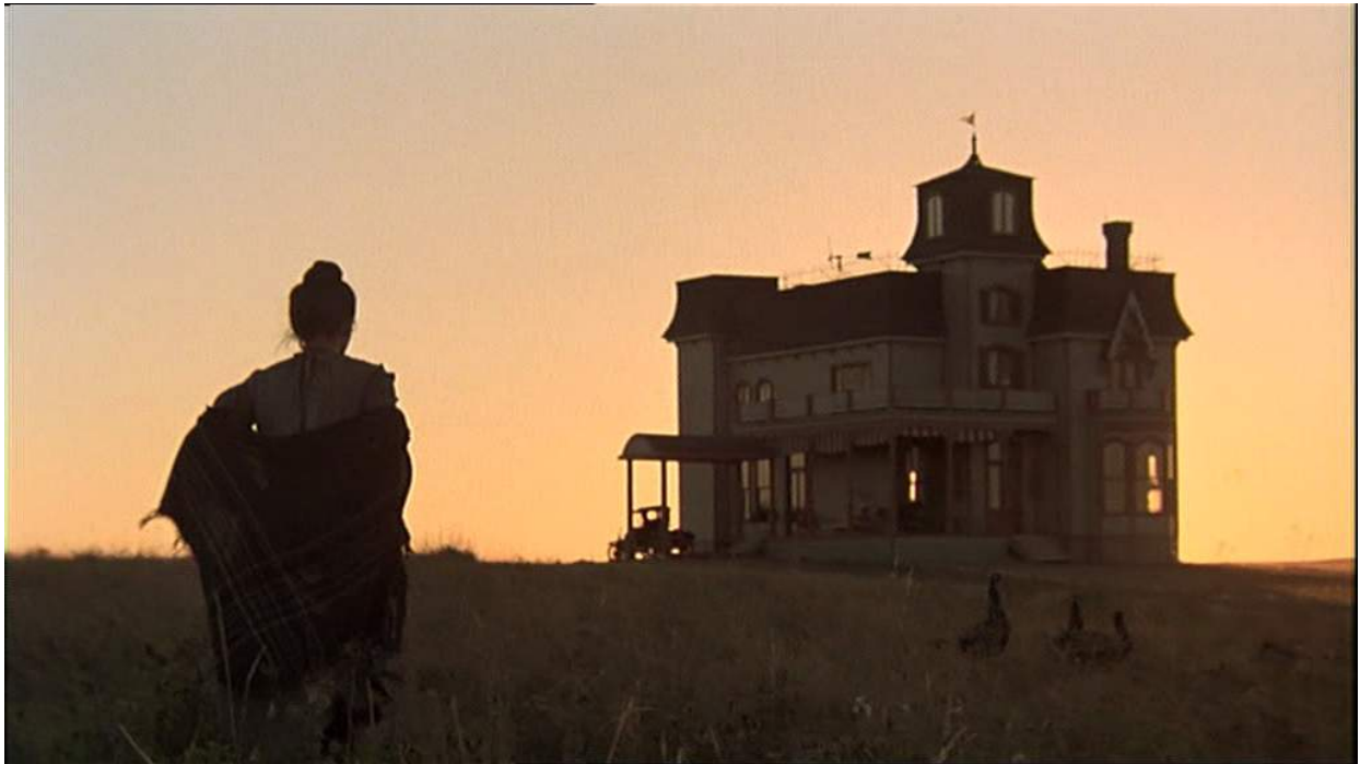
Photogramme de Day of Heaven , de Terrence Malick, 1979, représentant Abby allant vers la ferme.

Afin de « rentabiliser » les journées, des répétitions étaient mises en place l'après-midi avec les comédiens et les techniciens pour parfaire les mouvements parfois compliqués de caméras (travelling, steadicam...).