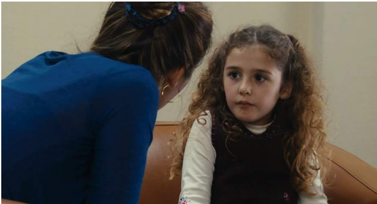
Photogramme de Polisse de Maiwenn, 2011, lors de l'interrogatoire d'une enfant.

Au cours de ce film, on suit des agents de la brigade des mineurs qui travaillent sur différentes « affaires » : une petite fille victime d'attouchements, une adolescente qui fait des vidéos pornographiques pour gagner de l'argent, un petit garçon qui se retrouve seul lorsque sa mère se fait expulser du territoire, etc. Tous ces petits récits sont tirés de faits réels que Maiwenn a pu observer lors de ses recherches pour écrire le scénario de Polisse . De plus, inclure dans le jeu d'acteur des mots du jargon des vraies brigades de mineurs, comme « miole » par exemple, (évoquant l'ambiguïté parfois entre un viol et faire l'amour) renforce le réalisme du film, l'ancre dans la vérité du métier.