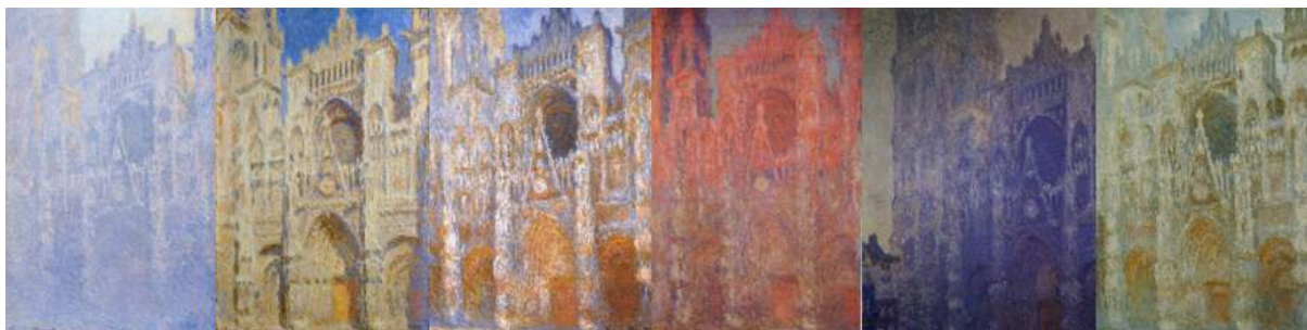
Quelques tableaux de la série de la cathédrale de Rouen de Claude Monet, 1894

La cathédrale n'est finalement qu'un prétexte pour mettre en avant les variations de la lumière naturelle. Du fait du caractère éphémère de la lumière naturelle, il était contraint de peindre vite, pour capturer « un instant de lumière ». C'est ainsi qu'il a inventé la touche : ce sont des petits paquets de peinture appliqués avec un geste ponctuel répété. Cette technique retire du détail au tableau : seule l'atmosphère colorée est mise en avant. À présent, cette technique par touches est représentative du courant impressionniste.