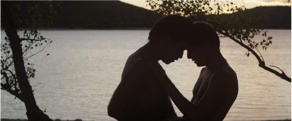
Photogramme de L'Inconnu du Lac d'Alain Guiraudie, 2013, de Franc et Michel

L'inconnu du Lac d'Alain Guiraudie est un film se déroulant majoritairement de jour, en extérieur près d'un lac. Près de ce lac, les baigneurs (généralement naturistes ou homosexuels) se retrouvent mêlés à une série de meurtres.