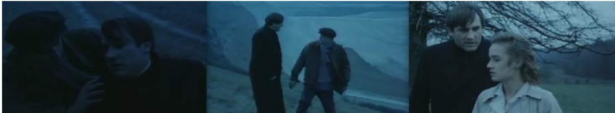
Photogrammes montrant la fin de la séquence, tournés en nuit américaine, qui gagnent en luminosité peu à peu pour symboliser le retour du petit matin.

Le passage entre le crépuscule et les plans de la tombée de la nuit réalisés en nuit américaine est très brutal, la colorimétrie de l'image passant du tout au tout : du orange au bleu, sa couleurs complémentaires. En revanche ensuite, le raccord entre le plan tourné en nuit américaine et le plan tourné en fin de jour entre chien et loup est effectivement moins percutant car on peut créer un lien avec la couleur et l'exposition du ciel, encore éclairé mais qui s'assombrit peu à peu. Dans la nuit éclairée, le ciel est complètement noir, mais des projecteurs sont nécessaires pour découper les acteurs de l'obscurité. La nuit américaine suivante représentant le petit matin est beaucoup plus fluide et « acceptable » au niveau du réalisme et des raccords lumière purs. Pour Céline Bozon cela reste « un pur faux raccord lumière ! Un chef opérateur le verra, mais pas un spectateur non averti... » 21 .