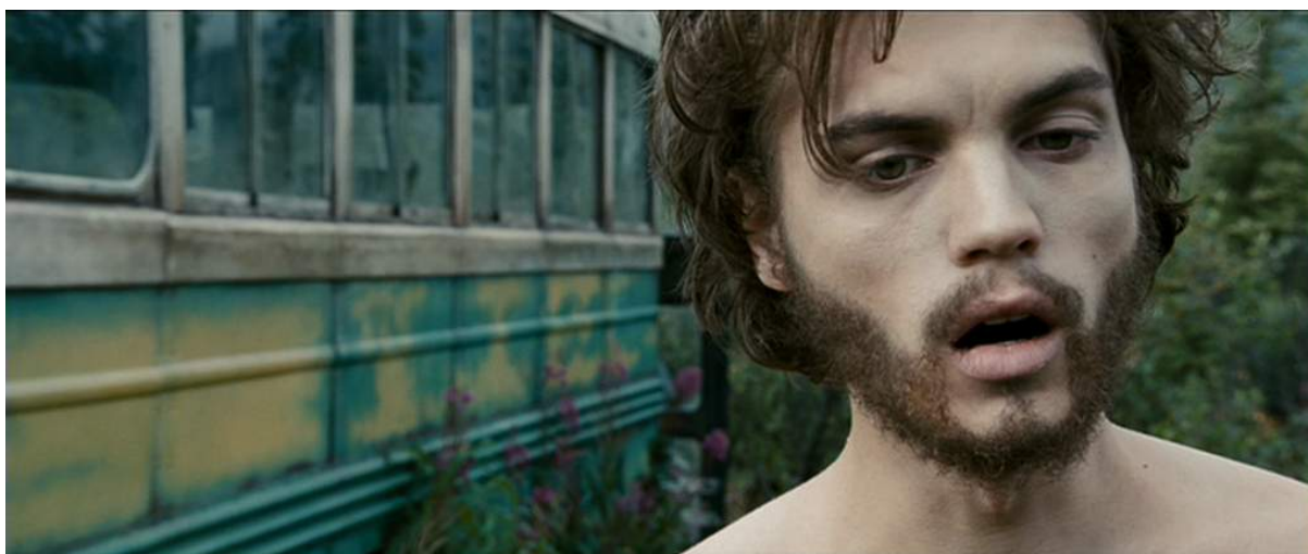
Photogramme du film Into The Wild de Sean Penn, 2008, peu avant sa mort, à l'automne

L'automne, en août, précède l'hiver de sept mois d'Alaska, où c'est le blizzard, la nuit interminable... Bref un climat inhumain. L'automne annonce déjà cette rudesse, « tout à coup la nature n'est plus qu'hostilité, et naturellement c'était plus épineux, plus tortueux, plus agressif... » 47 . Dans cette période l'image perd en saturation par rapport à l'été, soulignant subtilement la vie qui fuit peu à peu la nature et Christopher McCandless.