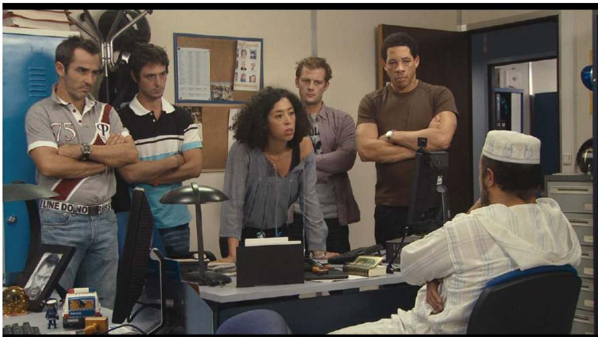
Photogramme de Polisse de Maïwenn, 2011 lors d'un interrogatoire.

De nombreuses séquences de Polisse étaient tournées en improvisation. Maïwenn donnait le ton général, puis les acteurs s'en emparaient. Les séquences étaient donc souvent assez longues. Laisser les acteurs improviser est une manière pour Maïwenn de leur faciliter l'accès à leurs émotions. Ainsi leurs réactions ne sont pas préméditées mais dictées par l'instant , par ce que la situation leur évoque. Cela permet plus de naturel de leur part, face aux difficultés émotionnelles que les agents peuvent rencontrer dans leur métier.