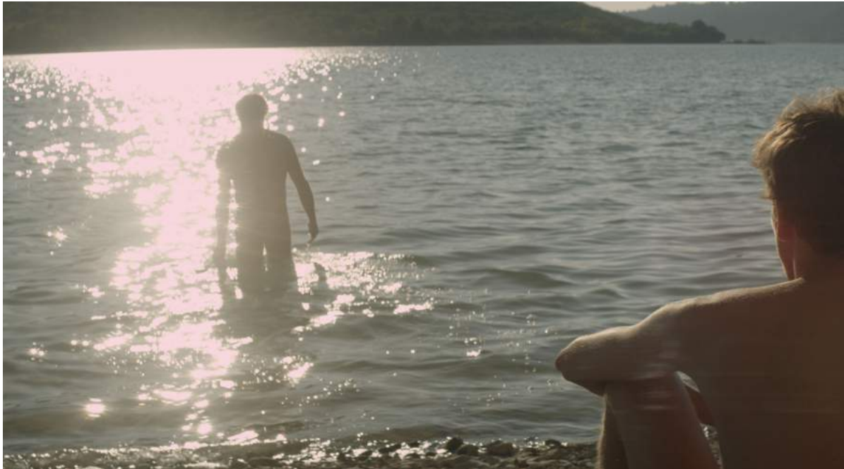
l'Inconnu du Lac d' Alain Guiraudie, 2013 présentant le flare dû aux reflets de l'eau sur la peau du personnage en avant-plan.

Pour créer une lumière en réflexion, il est possible d'utiliser des sources en indirect sur une plaque de polystyrène ou sur un drap blanc, un réflecteur, ou encore une toile matteflector, miroir... Les plaques de polystyrènes blancs, kraft, ou argent peuvent également être utilisées en rattrapage pour donner du modelé ou créer une tâche de lumière sur le décor (argent ou miroir diffusé). Cela peut également se faire avec de l'eau, comme dans l'Inconnu du Lac , le décor s'y prêtant. Les reflets sont alors mouvants car suivent les mouvements de l'eau et des vagues et créent ici un flare sur le dos du personnage.