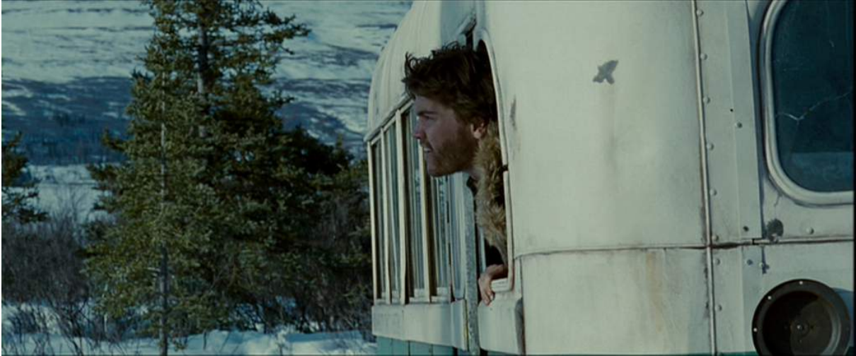
Photogramme du film Into The Wild de Sean Penn, 2008, durant la fonte des neiges en Alaska

On est allé quatre fois pour les quatre saisons en Alaska : si on compare ces quatre moments, les rendus de couleurs et de contraste sont différents. « J'ai construit ça avec l'arrivée dans la neige avec une image très forte, très belle. On atteint le summum de beauté et de douceur quand la neige commence à fondre et que la vie reprend le dessus, au printemps. » En effet, cette période montre une image très douce, avec un contraste pas trop élevé et une légère atténuation des couleurs. La lumière naturellement diffuse crée avec la neige une enveloppe blanche et douce, presque hors du temps, représentant la pureté de la nature tant convoitée par le protagoniste.