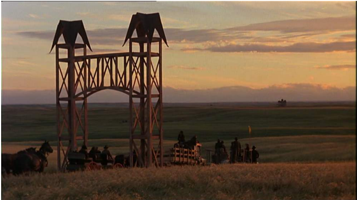
Photogramme de Day of Heaven de Terrence Malick, 1979, représentant «the gate of heaven» soit «la porte du paradis», par laquelle passaient les saisonniers pour aller travailler dans les champs lors de la moisson.

Day of Heaven , ou Les Moissons du Ciel en français, est un film de Terrence Malick éclairé par Nestor Almendros. Days of Heaven est un film d'époque se déroulant dans les années 10, au Texas. La majeure partie du film se déroule donc dans les champs de blé entourant la ferme, représentant des travailleurs de l'époque. Malgré le fait que l'action se déroule au Texas, le décor était quant à lui au Canada, durant la période de l'été indien. Ces grands espaces ont inspiré Nestor Almendros et Terrence Malick, et leur ont donné envie de tourner ce film entièrement en lumière naturelle.