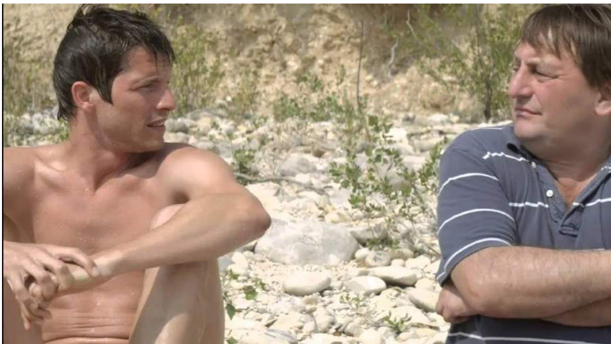
Photogramme de L'Inconnu du Lac d'Alain Guiraudie, 2013, avec des personnages dont les reflets verts sur les peaux ont été coupés.

Ce qui peut se faire en post-production, mais dans ce cas, était coupé directement à la prise de vue à l'aide de cadre avec des filtres minus green 1/8 ou 1/4 selon l'intensité du reflet vert sur la peau. Sans utiliser de sources artificielles, un certain nombre de manipulations de la lumière naturelle peuvent s'effectuer avec du matériel de diffusion ou de réflexion.