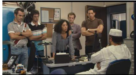
Polisse de Maiwenn, 2010, qui crée une confusion entre fiction et réalité en utilisant des procédés rappelant l'esthétique documentaire.