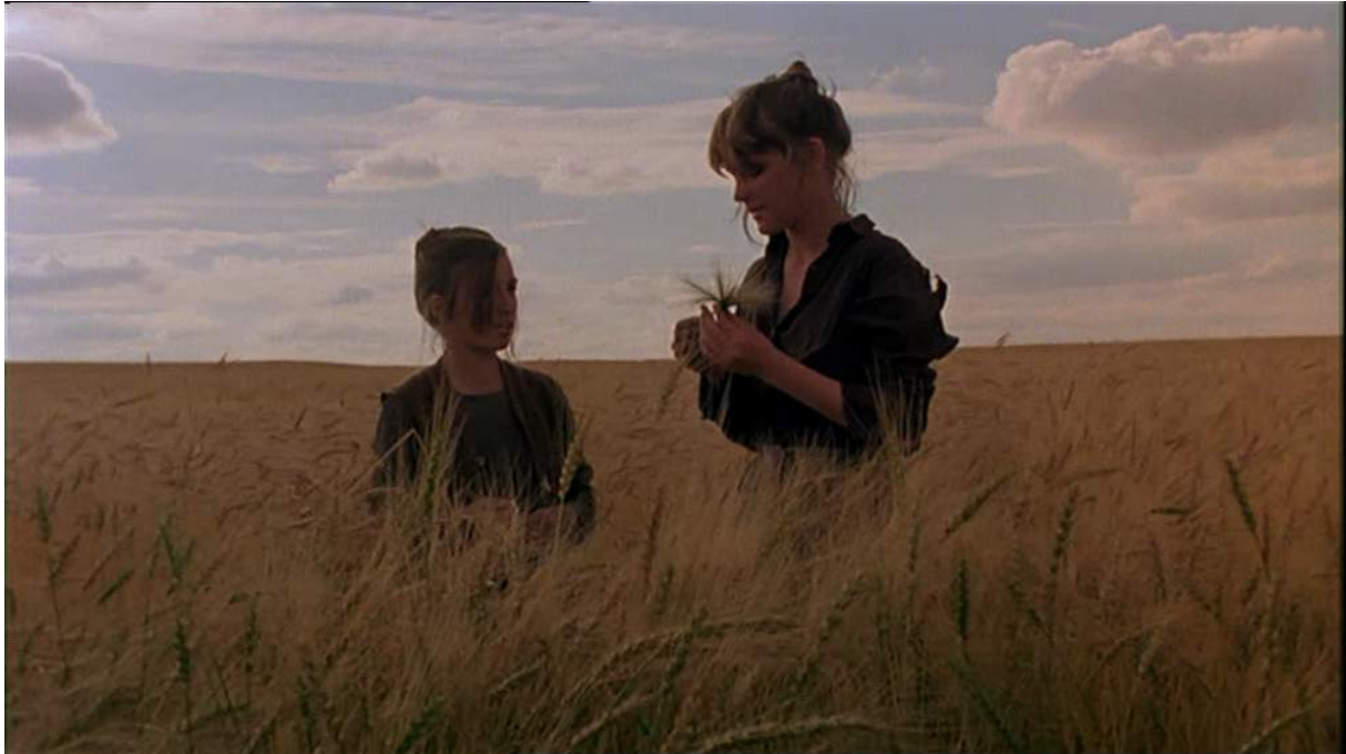
Photogramme de Day of Heaven , de Terrence Malick, 1979, représentant Abby et Linda proposant cette exposition particulière

Son chef électricien durant ce film était selon ses dires dans son livre Un Homme à la Caméra , « typiquement de la vieille garde hollywoodienne » 12 et donc « il était inconcevable pour eux que les visages restent dans l'ombre ou que le ciel ne soit pas bien bleu » 13 . Il préparait donc (comme le veut la coutume aux États Unis) tout l'éclairage conventionnel en avance avec des lampes à arc, des réflecteurs, etc, afin que les visages et le ciel soit « correctement » exposé selon la norme hollywoodienne. Ensuite, Nestor Almendros coupait tout au début du tournage, retrouvant l'esthétique qu'il avait choisie et son parti pris de n'utiliser que la lumière naturelle (ce qui poussera un certain nombre de chef électricien à démissionner au cours du tournage). Il avoue parfois avoir souhaité atténuer quelques peu l'écart de diaphragme sur un visage avec une plaque de polystyrène blanc : c'est Terrence Malick qui l'en a dissuadé, le poussant à prendre des risques et l'encourageant dans l'audace de sa démarche.