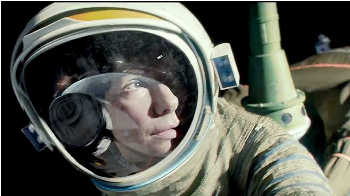
Photogramme de Gravity de Alfonso Cuarón, 2013

Afin de recréer une lumière naturaliste, les techniciens ont dû mettre en place un système unique de « boîte à lumière ». Ils ont construit une salle en forme de cube dont toutes les parois étaient composées d'écran à LED. Ces LED, miniatures mais dotées d'une luminosité supérieure à la normale, formaient des images de Soleil, de Lune, de Terre et d'étoiles. Ainsi, les acteurs suspendus dans ce cube de lumière pouvaient tourner pour imiter la gravité 0 : les reflets de terre, lune ou soleil apparaissaient naturellement sur leur scaphandre, donnant un sentiment de réalisme très poussé.