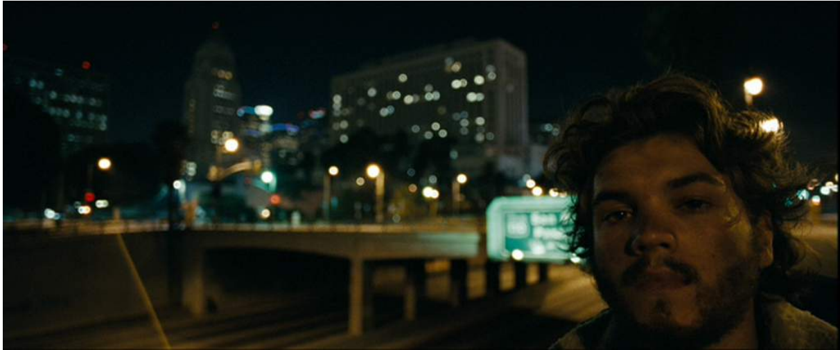
Exemple d'un plan cadré sur le modèle de l'autoportrait réel, Into the Wild de Sean Penn, 2008

« Il n'a jamais vu toutes ses photos de l'Alaska mais elles ont été retrouvées et développées après. On a pu donc voir très clairement tous les paysages où il était allé, on les a retrouvés et on a tourné depuis les points de vue de ses photos personnelles. » 40 Le respect du parcours de Christopher McCandless tenait beaucoup à cœur au réalisateur.