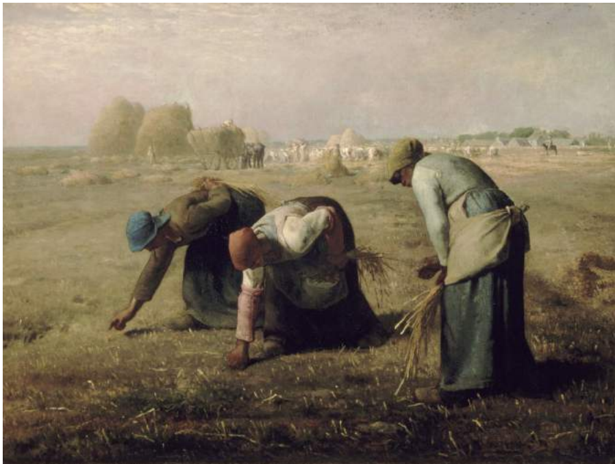
Les glaneuses de Jean-François Millet, 1857

Les réalistes se consacrent à des sujets considérés comme plus « triviaux » : une représentation fidèle de la vie quotidienne des basses couches sociales. Ils s'attachent principalement aux faits bruts afin d'atteindre une forme de vérité objective. Ils fuient les « faux-semblants » de l'académisme et les règles d'idéalisation ; cherchent le vrai . Gustave Courbet emploie le terme « réalisme » pour désigner ce courant en 1851, alors à son apogée. « Soyons vrais même si nous sommes laids ! » était le cri de guerre des réalistes.