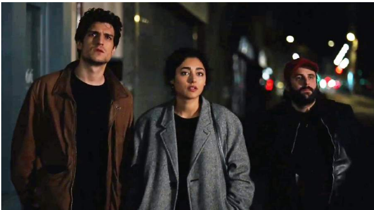
Photogramme tiré du film Les Deux Amis de Louis Garrel, 2015, pendant une séquence de nuit en ville, montrant les réverbères éteints.

« Pour Les deux Amis , nous avons fait le choix de nuit d'éteindre systématiquement les réverbères dans la rue (au moins dans la zone de jeux des comédiens) et de ré-éclairer seulement certaines zones avec des sources plus basses et plus neutres en couleur. Cela reste réaliste même si quand on regarde de près c'est parfois curieux que seuls les personnages se retrouvent dans la lumière et le reste de la rue dans l'obscurité. Pour moi ce n'est pas naturaliste, c'est presque un peu théâtral parfois. Mais le désir d'une image un peu brute ramène au réel. »