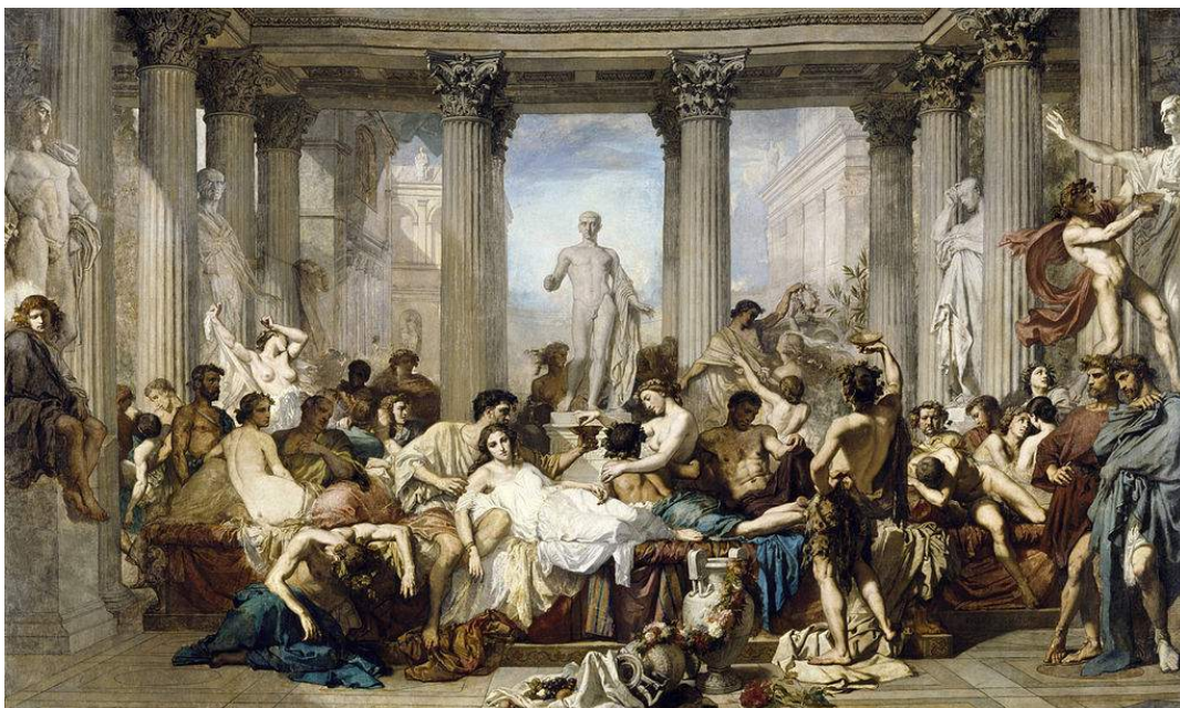
Les Romains de la décadence de Thomas Couture, 1847

Ainsi, si le tableau doit faire « illusion », opérer une vraisemblance, c'est paradoxalement par un travail d'artifices en atelier, à partir des « motifs » observés. Sans sortir de leurs ateliers, les artistes académiques créent des compositions historiques ou mythologiques importantes, mûrement réfléchies, appuyées par des règles savantes, un placement significatif des personnages, mais aussi par des symboles choisis en fonction du sujet.