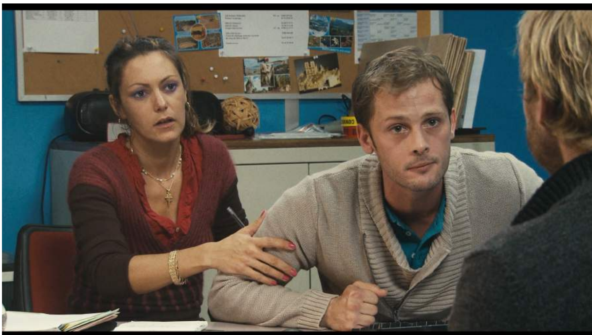
Photogramme de Polisse de Mäiwenn, 2011, lors d'un interrogatoire.

On retient donc que le choix du multicaméra était utile pour ajouter du réalisme aux jeux d'acteurs et à la prise de vue, mais était en réalité à double tranchant et a influencé la mise en lumière vers une esthétique plus « plate » et donc moins naturelle que celle des vrais locaux.