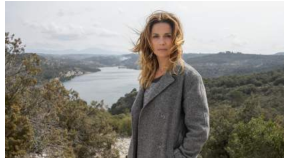
Le Mystère du Lac , de Jérôme Cornuau, tourné en lumière mixte