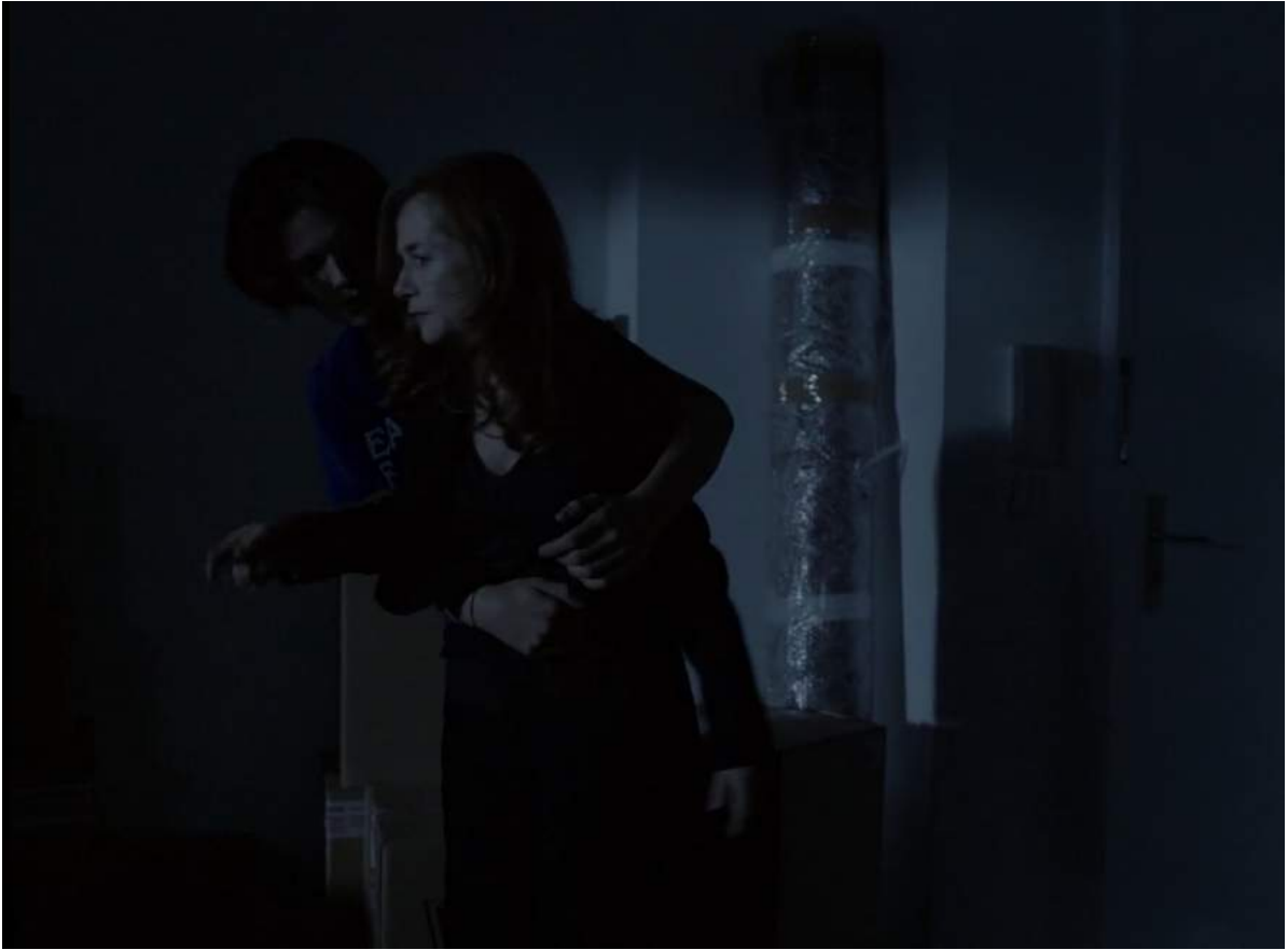
Photogramme du film Asphalte de Samuel Benchetrit, 2015, lors de la séquence de nuit avec Isabelle Huppert