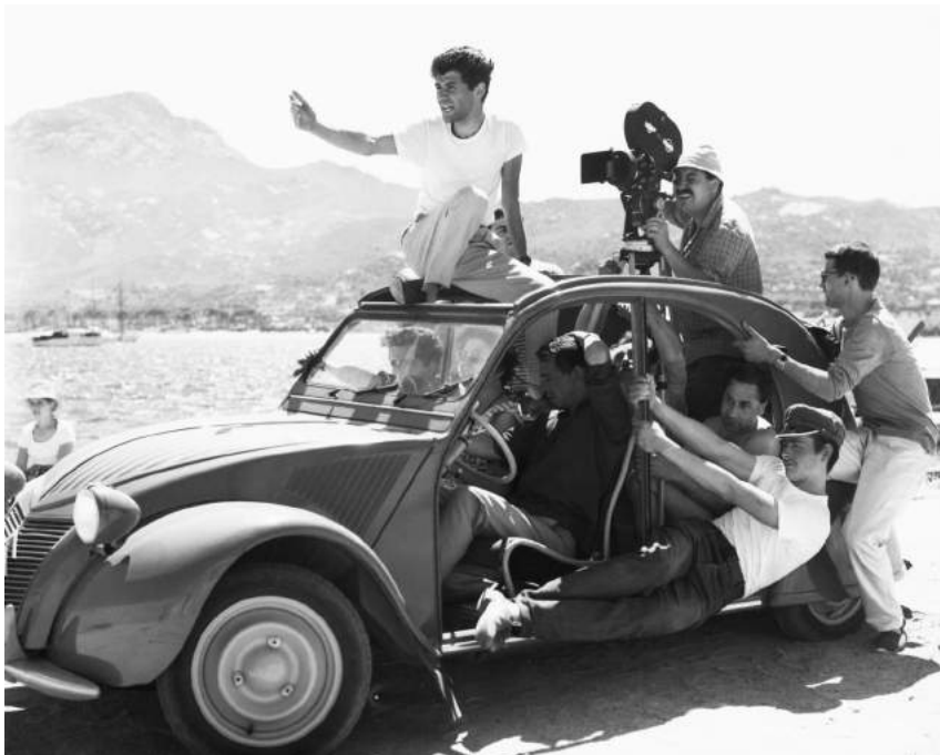
Tournage d' Adieu Philippe de Jacques Rozier en 1960

Cependant, ce n'est pas une « école artistique » avec un style particulier, mais plutôt un esprit qui aura autant de traductions différentes qu'il y a de cinéastes pour s'en emparer : appuyant donc ce désir de liberté (presque) absolu.