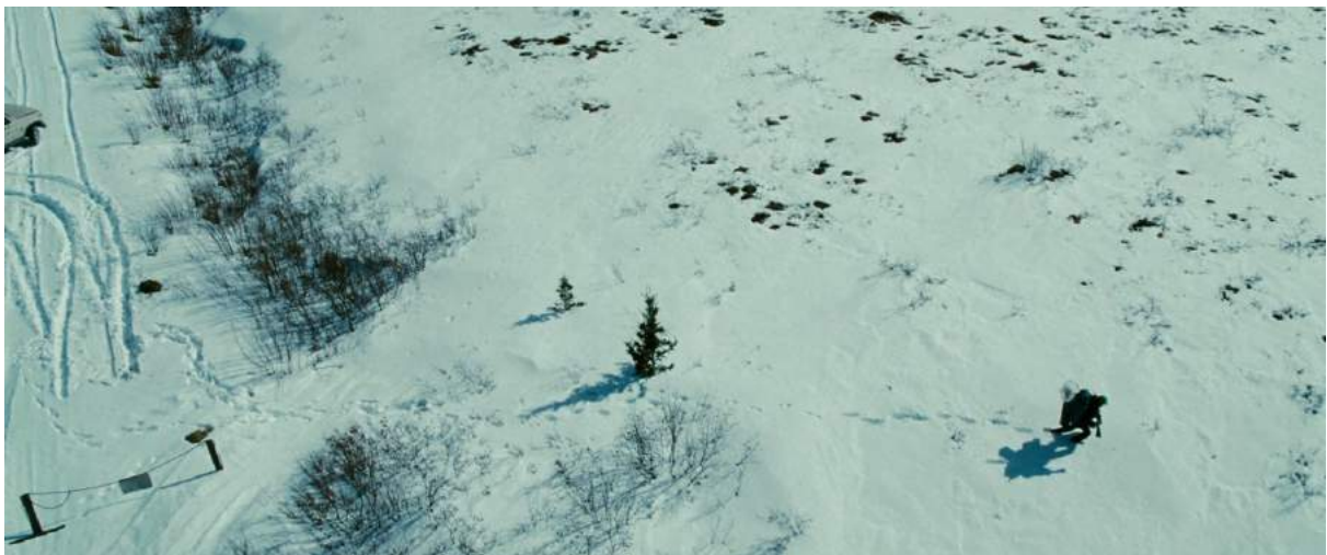
Photogramme du film Into The Wild de Sean Penn, 2008, lors de son arrivée en Alaska

Dans l'optique de respecter au maximum la mémoire du protagoniste, beaucoup d'acteurs étaient des personnes vraiment rencontrées par le personnage au même endroit. « Le gars du début qui le dépose en voiture était celui qui a déposé le vrai Christopher McCandless quinze ans plus tôt exactement au même endroit ! Quand on le voit s'éloigner juste ensuite, c'est le vrai point de vue : il avait pris une photo qu'on a pu récupérer, et recomposer le cadre à l'identique pour le film » 41 . Sean Penn a essayé d'intégrer un maximum de personnes réelles à son récit.