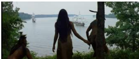
The New World (Le Nouveau Monde) de Terrence Malick, 2005, Emmanuel Lubezki avait fait le parti pris sur ce film de ne travailler qu'en lumière naturelle.

L'espace filmique est la traduction de l'espace réel via le prisme de la caméra jusqu'au rendu final sur écran.