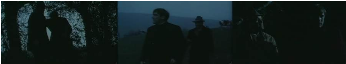
Photogrammes des plans suivant, tournés en nuit américaine (premier), puis en fin de jour (second) puis en nuit « éclairée » à l'aide de projecteurs (troisième)