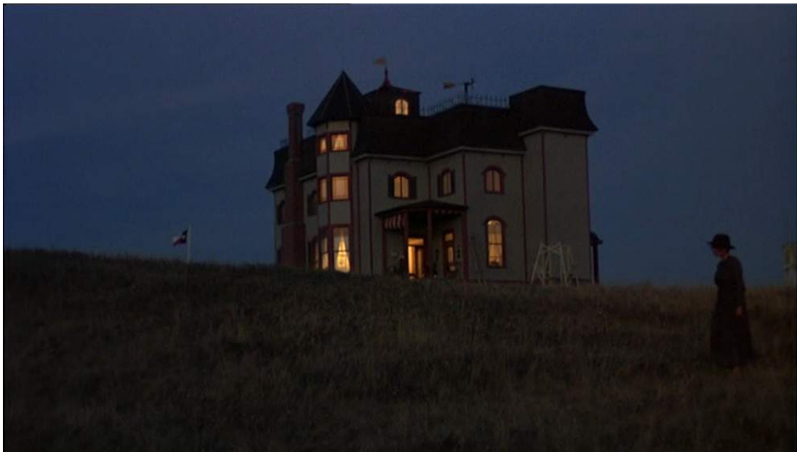
Photogramme de Day of Heaven représentant la ferme de nuit, tourné en fin de journée « entre chien et loup ».

Nestor Almendros se servait constamment pour les séquences tournées en fin de jour de nouvelles lentilles super-pana-speed pour descendre le plus possible en basse lumière. Il dit dans Un Homme à la Caméra avoir utilisé par exemple, un objectif de 55mm qui avait une ouverture de 1.1. Cela « autoriserait les tournages à la lumière d'une allumette ou d'une lampe de poche » 23 . En revanche, une ouverture aussi élevée crée des difficultés au niveau de la mise au point car cela réduit considérablement la profondeur de champ. Le réalisateur devait donc contraindre sa mise en scène, et donc ces acteurs, à toujours rester dans le même plan focal pour faciliter la mise au point.