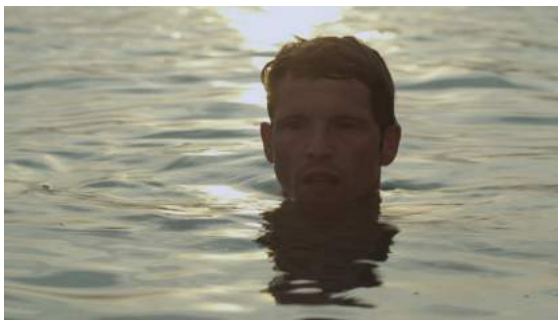
L'inconnu du Lac , d'Alain Guiraudie, tourné en lumière naturelle

Les deux réponses sont possibles, pour créer une lumière naturaliste, cela dépend du projet et du réalisateur. L'inconnu du Lac d'Alain Guiraudie n'était qu'en lumière naturelle, Mon Roi de Maiwenn en lumière naturelle et en lumière artificielle. »