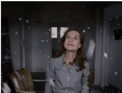
Asphalte de Samuel Benchetrit, 2015, avec une lumière naturaliste d'intérieur jour entièrement recomposée avec des sources d'éclairages artificielles.

Pierre Aïm (chef opérateur de Polisse de Maiwenn, d' Asphalte de Samuel Benchetrit...) part du principe qu'une lumière naturaliste est effectivement une traduction de la lumière naturelle de l'espace réel en lumière « naturelle » de l'espace filmique : « La lumière naturaliste est une esthétique visant à faire croire que le film n'a pas été éclairé. C'est une lumière non stylisée, avec des directions moins prononcées... En termes d'étalonnage, une lumière naturaliste est une lumière pas trop étirée : on irait vers des couleurs de peaux naturalistes, des verts et des magentas pas trop étirés, un grain moyen, un contraste de « l'œil humain » si on peut dire. Finalement ma définition de la lumière naturaliste ce serait de faire croire au spectateur qu'il n'y a pas de rajout de lumière même s'il y en a en réalité. » Ainsi selon lui, un chef opérateur vise, avec les moyens techniques propres au cinéma, à effacer toute trace de ces artifices pour créer l'illusion auprès du spectateur. De même, Caroline Champetier (chef opératrice de Hélas pour moi de Jean-Luc Godard) insiste sur le fait que « toute la question du cinéma est de faire croire à une continuité inventée. »