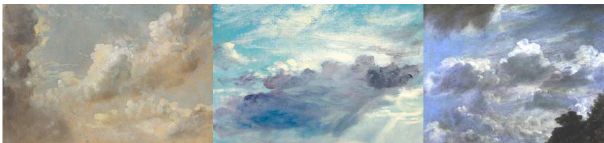
études des ciels de John Constable (environ 1820) exposant textures et traits pour capter au mieux la sensation de la « vraie » lumière

Avec ces nouvelles pratiques, on remarque que les peintres ont eu tendance à laisser de plus en plus apparaître leurs traits, leurs techniques, soit les artifices de représentation propre à la peinture pour donner une impression plus « véritable ». John Constable, un naturaliste anglais, a réalisé des études de ciels pour capter les différentes lumières. Il se retrouve rapidement obligé de recourir à des techniques laissant sentir les matériaux, les artifices de peinture, mais qui permet une plus grande sensation de « vrai », de réel.