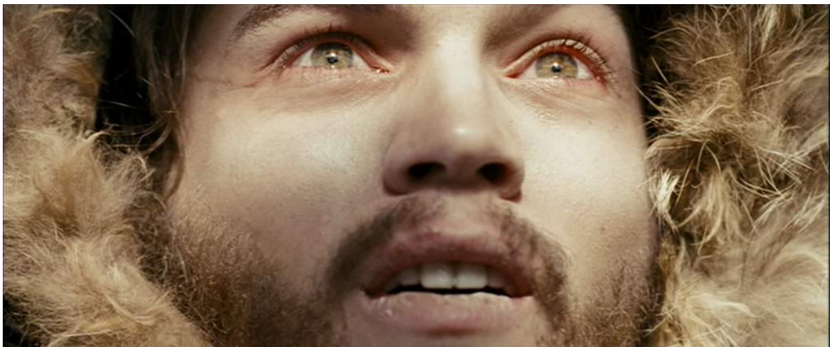
Photogramme du film Into The Wild de Sean Penn, 2008, du début du dernier plan lors de sa mort

L'autre volonté de Sean Penn pour ce plan était d'avoir un grand soleil, symbolisant une sorte de lumière divine. Cela accentue sa solitude et la cruauté de la situation. Or, il avait également imposé de tourner sa mort le jour de l'anniversaire de la vraie mort : en automne ! Donc le soleil avait fait place à des pluies diluviennes... Et quand il revenait se trouver coupé par les fenêtres du bus, très basses comme pour le vrai. Ces partis pris éthiques de réalisme et esthétique pour la narration créaient de véritables embûches pour la réalisation technique du plan ! Éric Gautier explique : « j'ai donc été contraint de faire ramener un groupe électrogène, et des projecteurs pour recréer le soleil. J'ai donc placé un projecteur quasiment dans l'axe de la caméra, créant la violence du flare. J'ai tellement surexposé qu'on ne voit pas le projecteur rentrer dans le champ. C'est pour moi une image naturaliste, mais il n'y a aucune lumière naturelle. Le plus important pour moi était que le passage de l'un à l'autre soit invisible au montage. » 49