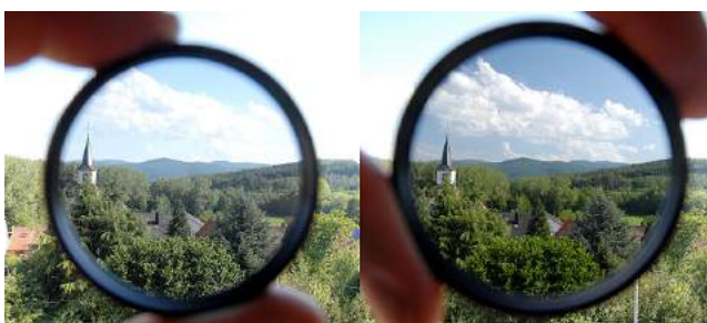
Exemple de deux images avec et sans polarisant, et l'effet sur le ciel et les nuages.

Un filtre polarisant avec la lumière du jour permet d'éviter ou de créer des reflets selon le sens d'utilisation. Par exemple sur une voiture, ce filtre permet de couper les reflets de la lumière du jour. Sur des cheveux, il peut atténuer les brillances du soleil sur une chevelure blonde très réceptive à la lumière, ou il peut donner une teinte plus rousse à des cheveux auburn ou encore créer des reflets dans des cheveux plus sombres pour détacher la silhouette et éviter l'effet « masse sombre »... Ce sont des détails qui parfois peuvent faire la différence.