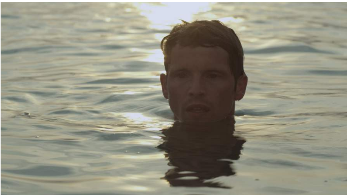
Photogramme de L'Inconnu du Lac d'Alain Guiraudie, 2013