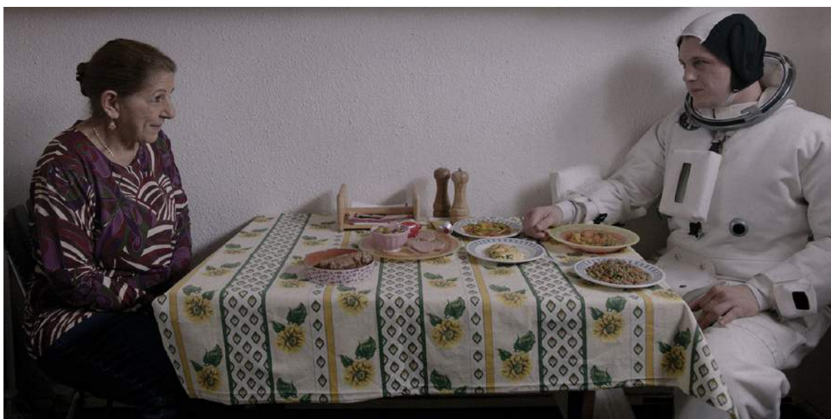
Photogramme du film Asphalte de Samuel Benchetrit, 2015

Asphalte entrelace trois petits récits réaliste et un peu loufoques. Ces trois récits se déroulent dans un même immeuble de banlieue entre ses habitants. Dans le premier, un astronaute atterrit par hasard sur le toit de l'immeuble et est contraint par la NASA d'y rester caché deux jours. Il se retrouve hébergé par une vieille femme maghrébine qui vit seule depuis que son fils est en prison. Dans la seconde, un adolescent qui vit seul également, découvre que sa voisine est une ancienne actrice déchue des années 80 et décide de la relancer en devenant son agent. Et la dernière retrace les tentatives d'approches maladroitement d'un homme en fauteuil roulant qui se fait passer pour un photographe, auprès d'une infirmière de nuit.