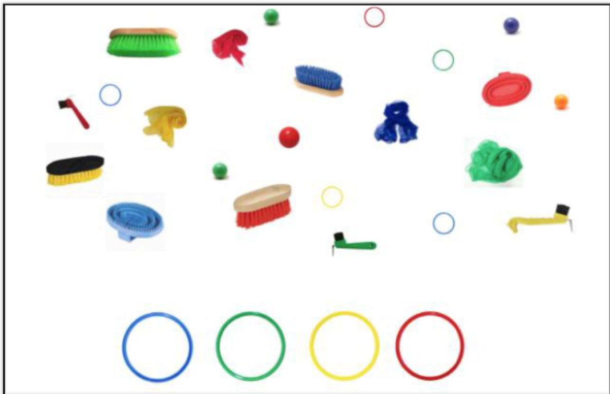
Jeux des couleurs

Dans le manège, 4 cerceaux de différentes couleurs (bleu, vert, jaune, rouge) sont posés les uns à côté des autres. A quelques mètres, différents objets sont disposés de part et d'autre du manège. Cet exercice permet d'évaluer les compétences d'association, de désignation et motrices.