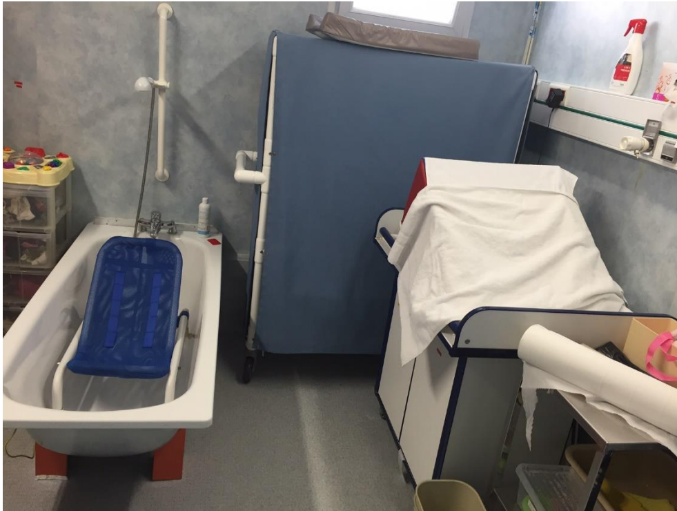
1 ère installation de Mathis avec un siège de bain et un plan incliné pour les changes