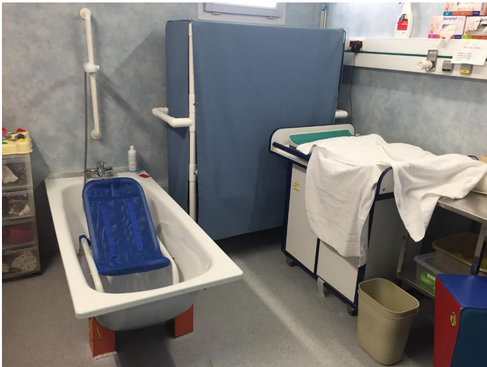
2 ème installation sur la table à langer permettant à Mathis d'être en position allongée ou assise