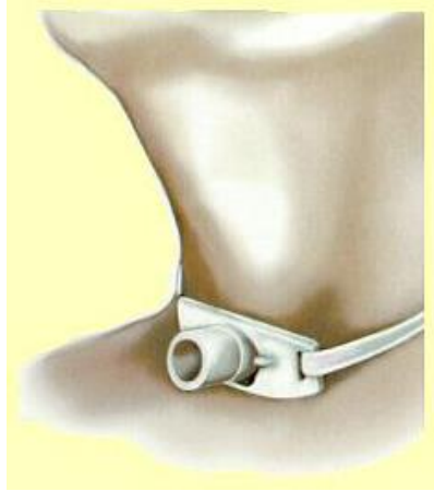
Figure 1 : Schéma d'une canule de trachéotomie

Canule : petite tube permettant le passage de l'air à travers un orifice faisant suite à une intervention chirurgicale.