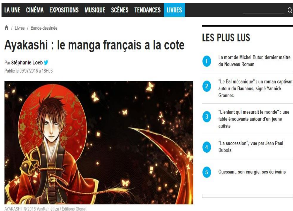
Figure 9 : Capture d'écran de l'article sur le site Culturebox : http://culturebox.francetvinfo.fr/livres/bande-dessinee/ayakashi-le-manga-francais-a-la-cote-242847

A l'occasion de la Japan Expo qui se déroule jusqu'à demain à Paris, gros plan sur "Ayakashi-Légendes des 5 royaumes", un nouveau manga né de la collaboration entre l'illustratrice VanRah et le scénariste Izu. Deux artistes bien français qui surfent sur la vague du succès du manga tricolore. Tous deux ont dédié leur album à la Japan Expo qui fait la part belle cette année à la "French touch".