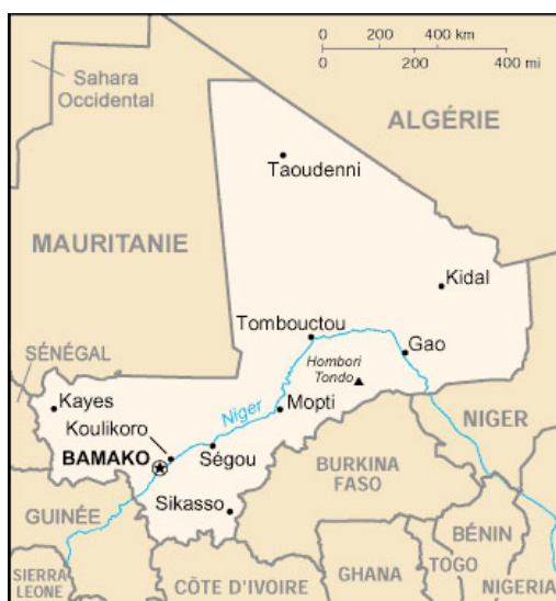
Figure 1 : Carte du Mali

sont dans le secteur informel. Le chômage touche les jeunes diplômés. En effet, dans les zones urbaines, le taux de chômage des jeunes de 15-39 ans (14%) est deux fois plus élevé que celui de 40-59 ans (7%). De plus, environ 19 % des personnes diplômés (de niveau secondaire et universitaire) sont au chômage, alors que seulement 7,5% des personnes sans diplôme sont touchés par le chômage 10 .