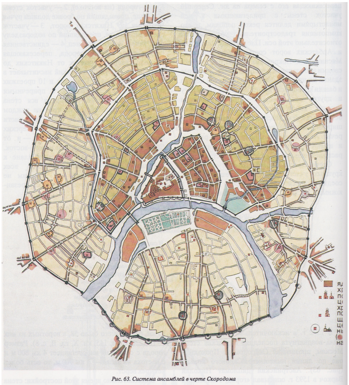
Рис. 63. Система ансамблей в черте Скородома