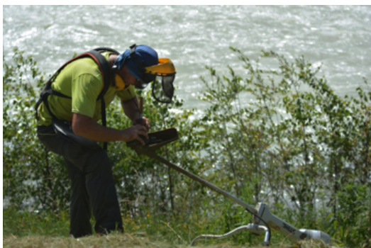
Fig.3 Gestion des espaces naturels