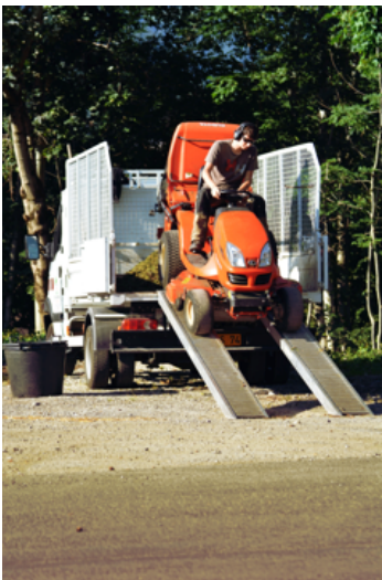
Fig.2 Travaux paysagers

La diversité des activités est une grande opportunité bien qu'elle soit complexe à gérer. En effet, cela permet de satisfaire différents profils de personnes en insertion : physique pour le débroussaillage, pérenne pour l'entretien, minutieux pour la maçonnerie... Ainsi les personnes peuvent s'épanouir, se sentir utiles dans une activité où elles sont à leur place. Le lien avec le chef d'équipe se crée, les personnes reprennent confiance et cela permet l'avancée du chantier. Cependant, cela implique que le chef d'exploitation ait des connaissances variées pour assumer la diversité des activités notamment en terme de matériel, d'investissements.