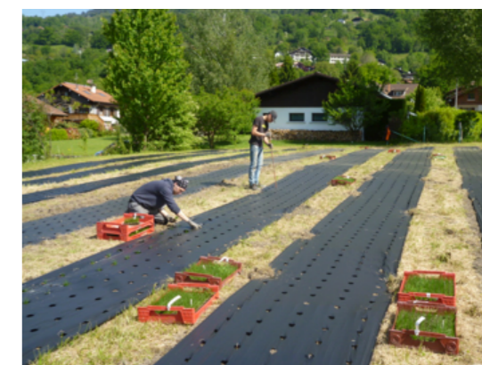
Fig.6 Plantation