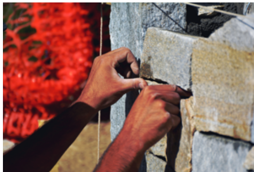
Fig.1 Travaux de maçonnerie