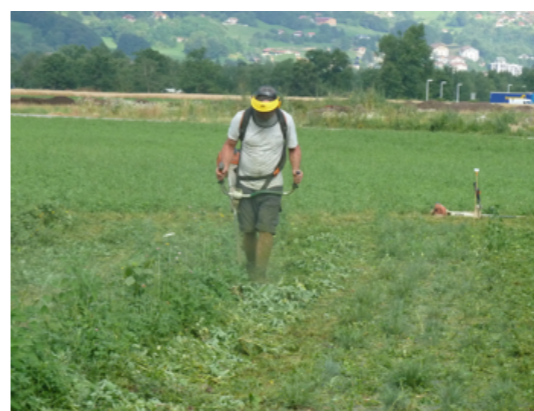
Fig.7 Entretien des bandes enherbées