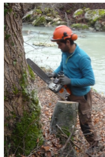
Fig.4 Travaux d'hiver