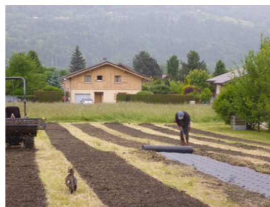
Fig.5 Préparation du sol, pose de la bâche

D'autre part, cette incertitude au niveau des financements a empêché l'investissement dans du matériel, compliquant ainsi les opérations. Au cours des deux prochaines années, il est nécessaire de voir comment le matériel peut être mis en commun y compris celui qui n'a pas été affilié au projet. Cela peut être envisageable par l'investissement dans du matériel par un groupement en SCIC ou avec la prise en charge de l'achat par l'une des structures. La mécanisation des tâches est à étudier ainsi que leur anticipation comme le travail du sol à réaliser à l'automne afin de mieux gérer les adventices.