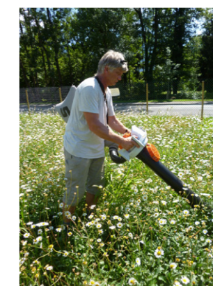
Fig.8 Récolte de Leucanthemum ircutianum DC. par aspiration