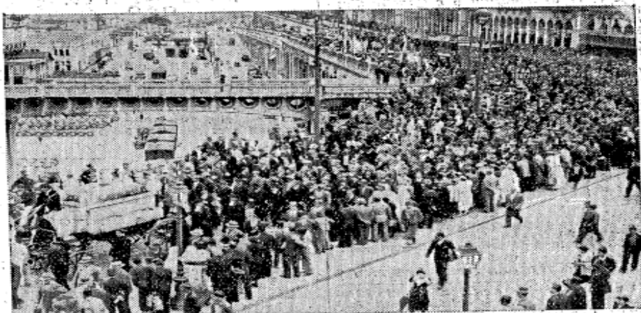
Quand le char funéraire arriva place du Gouvernement, le boulevard de la République et le boulevard Carnot étaient encore pleins de la foule qui avait tenu à venir rendre hommage à l'infortuné Léon Kalifa.

Sous un ciel gris et pluvieux, une foule immense, pouvait être évaluée à plus de vingt mille personnes, a accompagné, hier, après-midi, au cimetière israélite de Saint-Eugène, le convoi funéraire du jeune Léon Kalifa, pupille de la nation, succombant aux graves blessures reçues lors de la bagarre du 21 avril, rue d'Isly. Bien avant la levée du corps, qui eut lieu à 14 heures, à la chapelle ardente de Taffoura, en présence du grand rabbin Elissenbèth, entouré de tous les membres du corps rabbinique, très nombreux sont celles et ceux — personnalités ou amis — qui vinrent s'incliner devant le cercueil du malheureux jeune homme et présenter leurs condoléances à la famille si cruellement éprouvée et abîmée dans la douleur. Après les prières dites par le grand rabbin d'Alger, assisté des rabbins Molina, Kamoun, Chemoun et Habib, le lourd cercueil fut placé dans un cor-