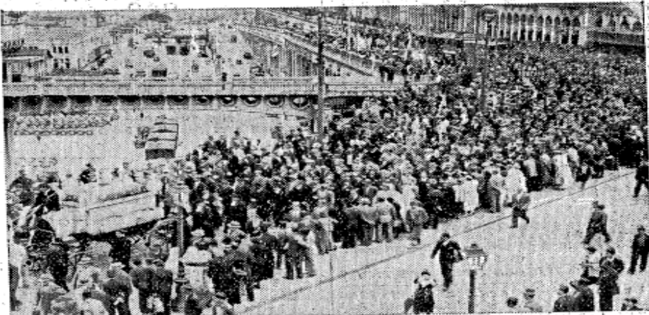
Quand le char funéraire arriva place du Gouvernement, le boulevard de la République et le boulevard Carnot étaient encore pleins de la foule qui avait tenu à venir rendre hommage à l'infortuné Léon Kalifa.

Sous un ciel gris et pluvieux, une foule immense, pouvait être évaluée à plus de vingt mille personnes, a accompagné, hier, après-midi, au cimetière israélite de Saint-Eugène, le convoi funéraire du jeune Léon Kalifa, pupille de la nation, succombant aux graves blessures reçues lors de la bagarre du 21 avril, rue d'Isly. Bien avant la levée du corps, qui eut lieu à 14 heures, à la chapelle ardente de Taffoura, en présence du grand rabbin Elissenbèth, entouré de tous les membres du corps rabbinique, très nombreux sont celles et ceux — personnalités ou amis — qui vinrent s'incliner devant le cercueil du malheureux jeune homme et présenter leurs condoléances à la famille si cruellement éprouvée et abîmée dans la douleur. Après les prières dites par le grand rabbin d'Alger, assisté des rabbins Molina, Kamoun, Chemoun et Habib, le lourd cercueil fut placé dans un cor-