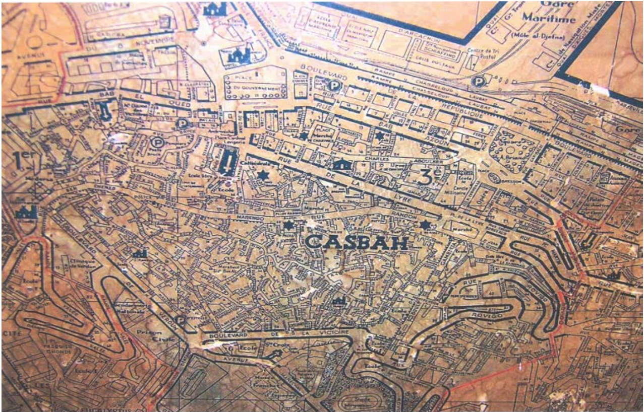
Carte d'Alger, 1931 (Fonds Cartes. Archives de la wilaya d'Alger).