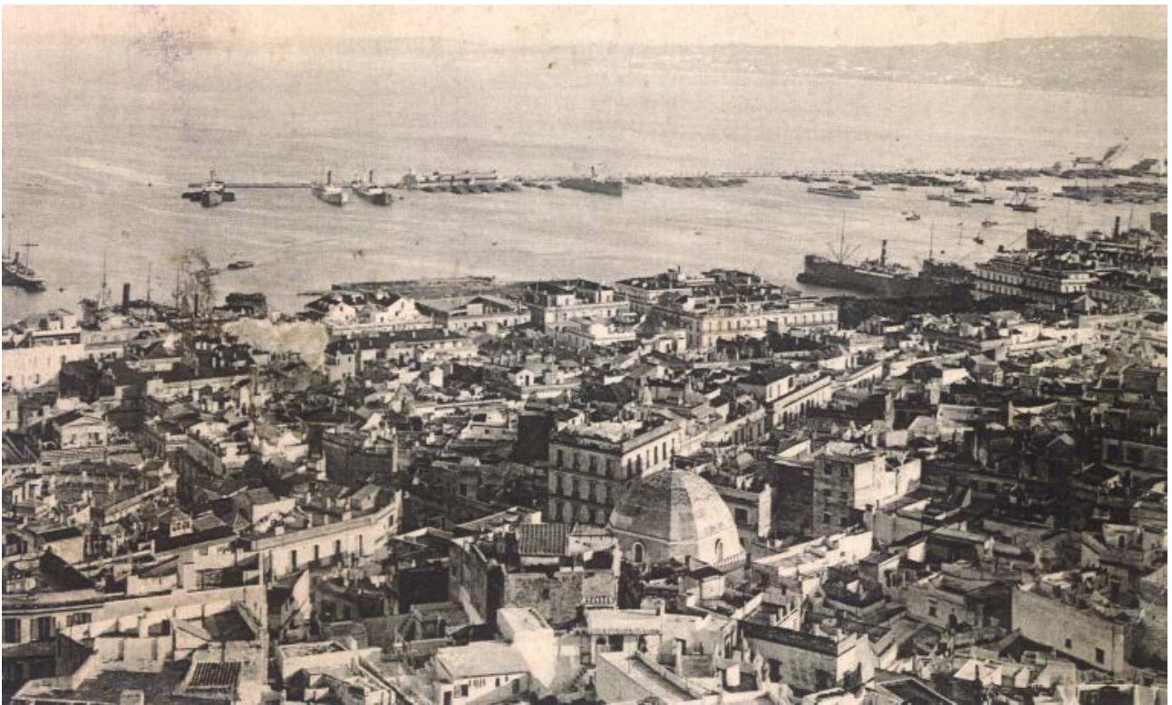
Vue de la Basse-Casbah et de la synagogue Randon (Cartothèque de la gare d'Agha, Alger).