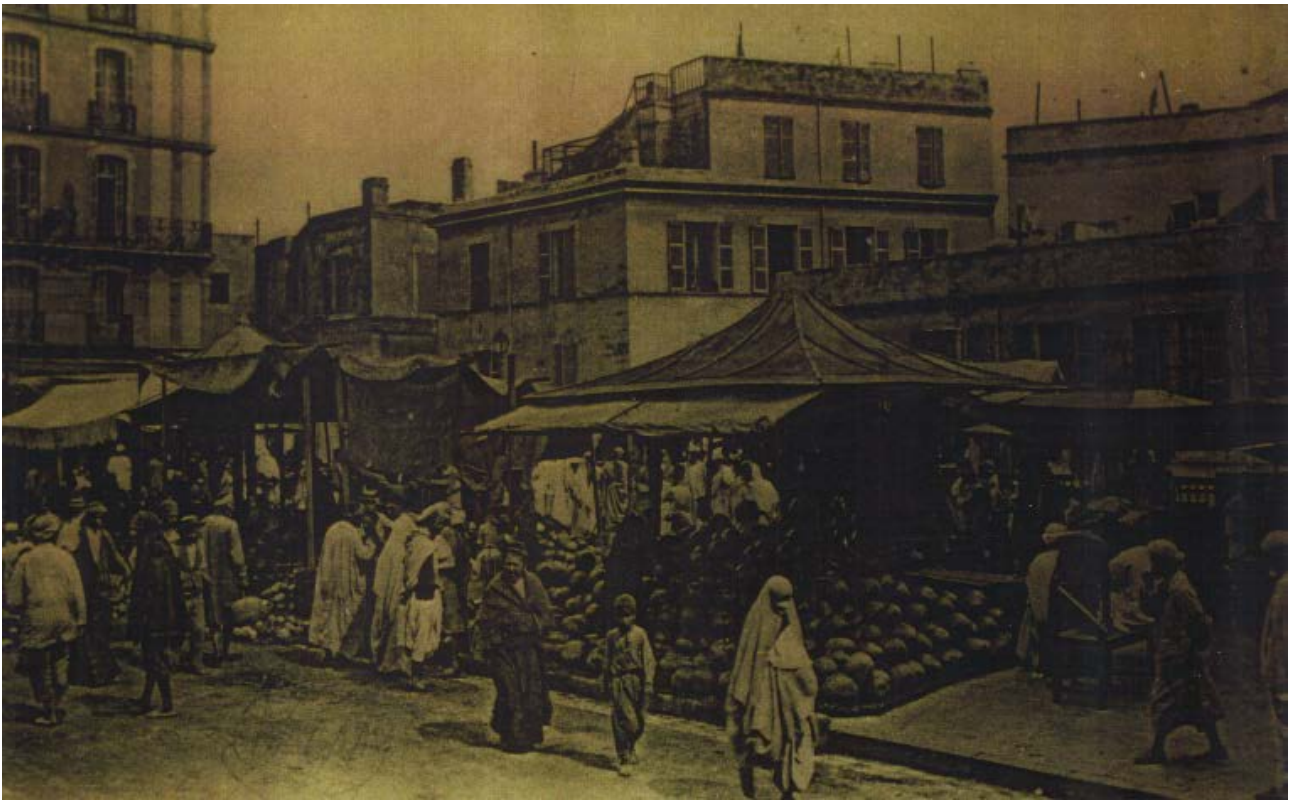
La place Randon (Cartothèque de la gare d'Agha, Alger).