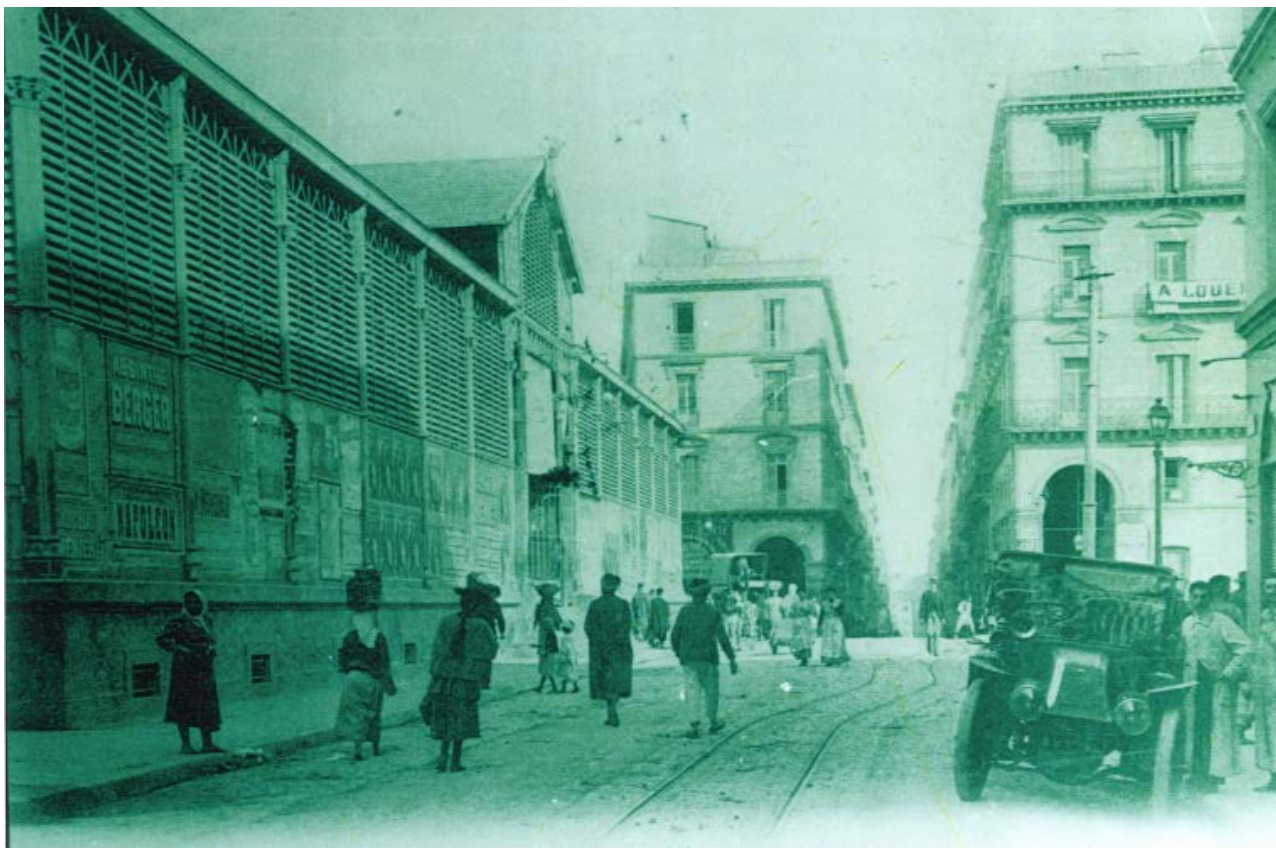
La place de la Lyre (Cartothèque de la gare d'Agha, Alger).