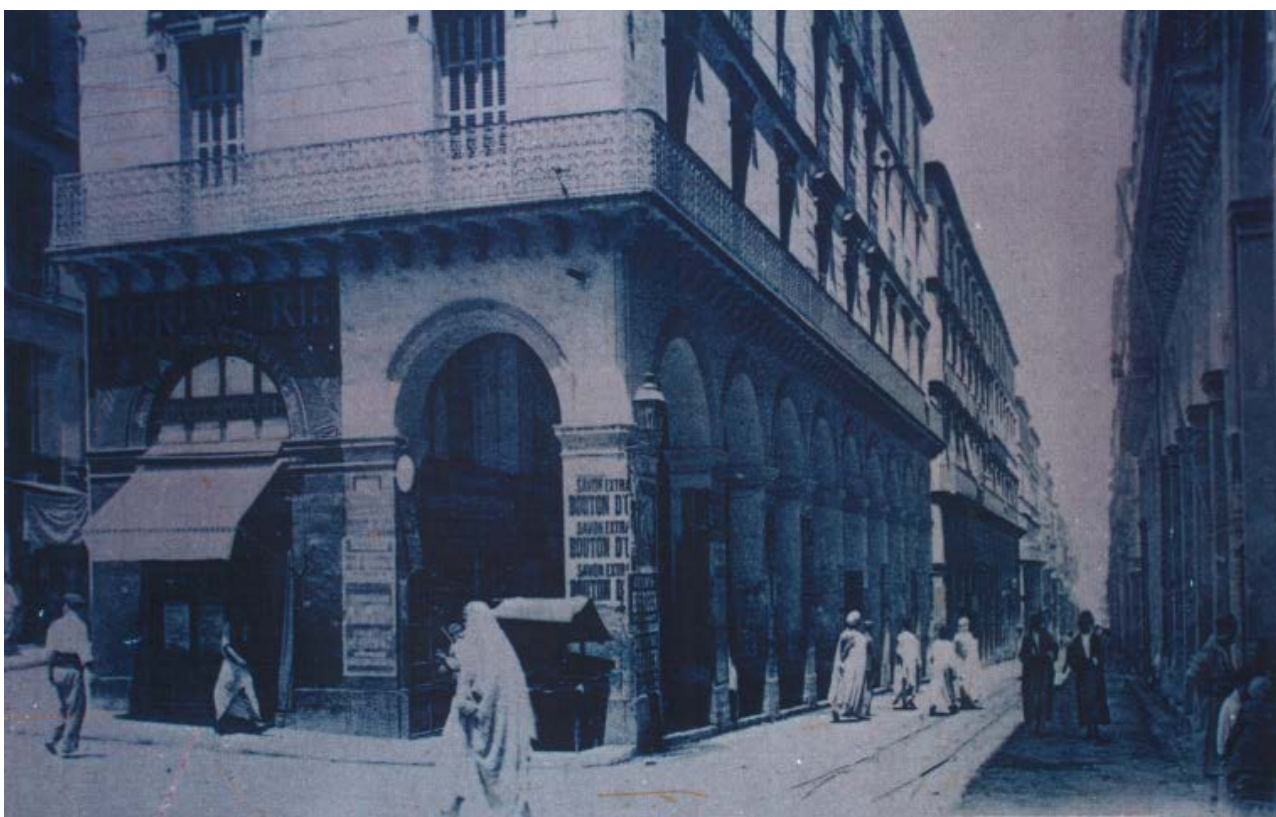
La rue de la Lyre (Cartothèque de la gare d'Agha, Alger).