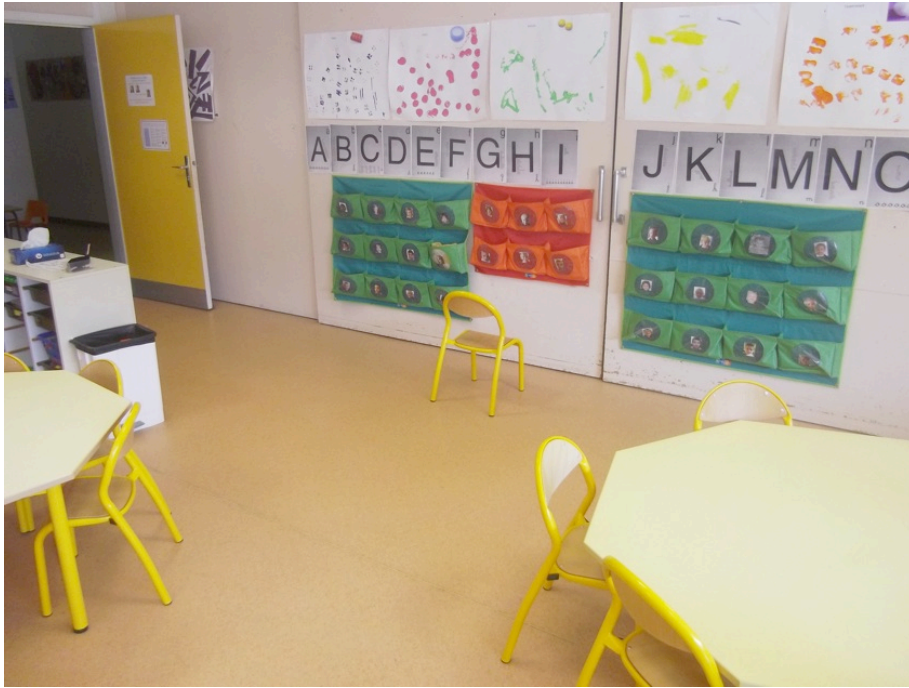
Doc. 3 – Lorsqu'un élève est puni, il prend une chaise et s'y assoit en fond de classe, dos aux activités