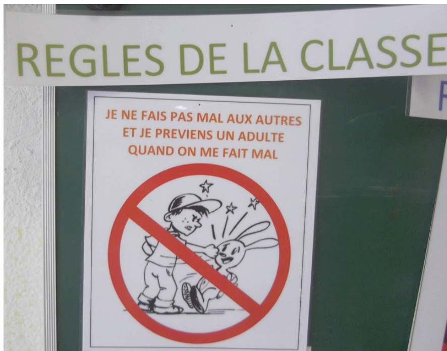
Doc. 1 – Affiche de la règle de non violence