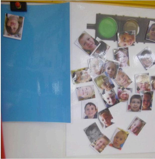
Doc. 5 – Zone bleue ajoutée à l'échelle de comportement pour l'équilibrer. Cette zone est destinée aux comportements spontanés de coopération et d'aide (aux pairs, aux référents).