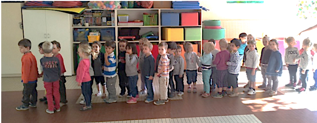
Doc. 6 – « Mimile le mille pattes », l'autre nom du rang dans cette classe, pour que la discipline soit moins militaire, plus imaginaire et affective.