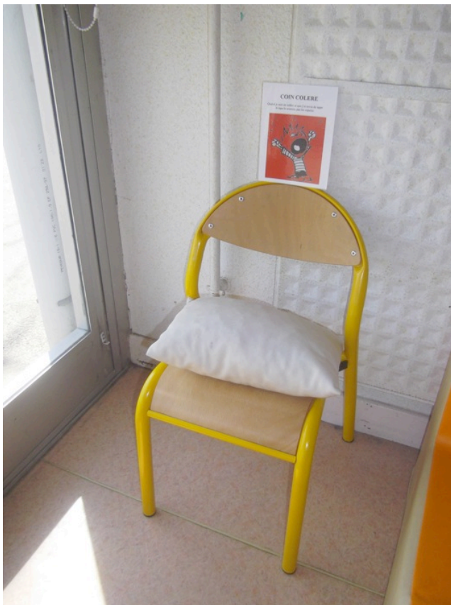
Doc. 4 – Coin colère, rapidement supprimé faute d'utilisation.