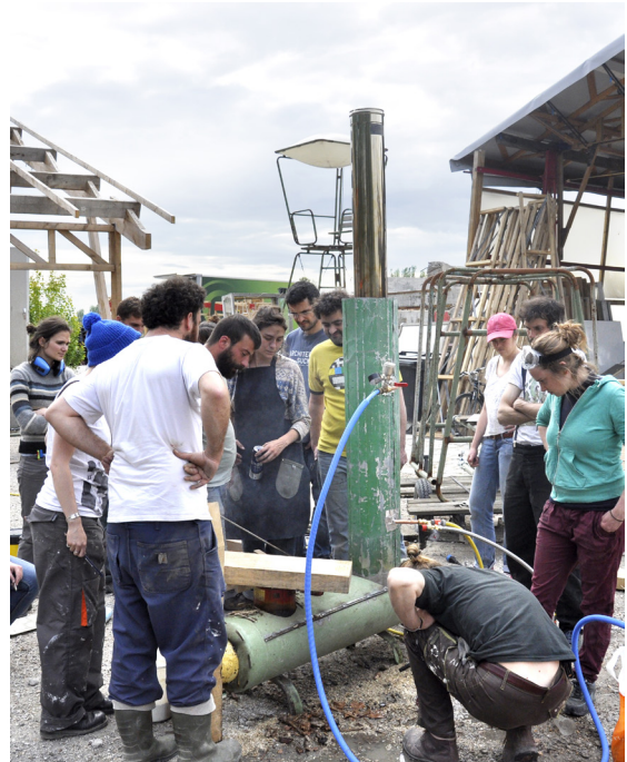
Mise à feu du Dragon , Actlab, Atelier de l'association Bellastock, Île St Denis, 08/05/2015

C'est cette idée, la démocratisation des outils, que prônaient les auteurs du Whole Earth Catalog dès 1968. Avec son sous-titre emblématique Access To Tools , ce catalogue fut l'un des symboles de la contre-culture américaine