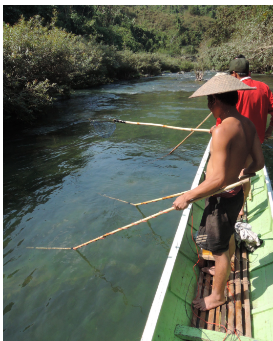
Pêche à l'électricité , Hadkham, Laos, 17/05/2014.

les offrait à sa fille, bien vivants. Celle-ci jouait alors avec eux jusqu'à ce qu'ils meurent d'épuisement, sans se préoccuper de leur terreur. Ils allaient de toute façon compléter le repas du jour. La pêche elle aussi se faisait au filet, mais, lorsqu'elle n'était pas bonne, passait à l'électricité. Deux fils reliés aux pôles d'une batterie, chacun accroché à une canne de bambou, le tout se promène dans l'eau, l'arc se crée entre les deux, les poissons remontent à la surface. Les gros sont engourdis, les plus petits meurent, qu'en est-il du reste ? Cela me fait immédiatement penser à la pêche à l'explosif, s'ils en avaient les moyens le feraient-ils ?