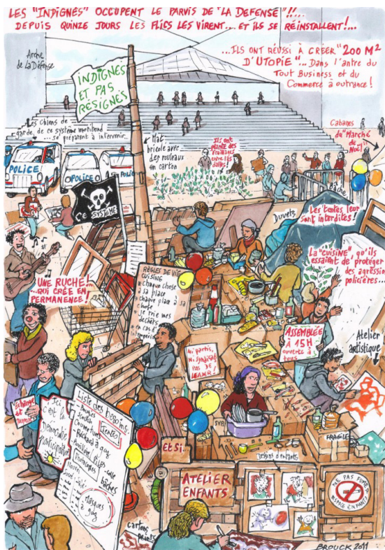
Bruck, dessin extrait de Ici, on broie du noir , Reportages Dessinés, (4ème de couverture), 4ème trimestre 2012.

Etant confrontés à une situation juridique qui permettait à l'État de justifier ses assauts et sa campagne de démoralisation, nous avons alors décidé avec un groupe d'Indignés de créer un groupe de travail sur l'architecture