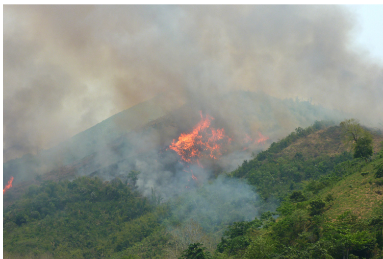
Incendie volontaire pour la culture sur brûlis du riz, Hadkham, Laos, 17/05/2014.