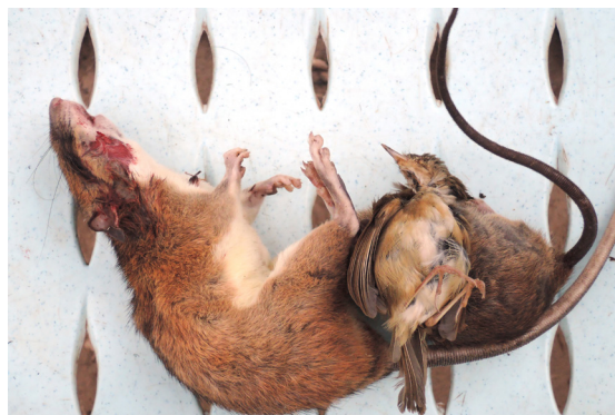
Tableau de chasse, Hadkham, Laos, 22/01/2014.

Quand on partait dans la jungle, jamais on ne croisait de serpents, d'écureuils ou quelque animal tropical. La jungle était silencieuse, comme morte. Et pourtant il y avait bien y avoir des animaux si les hommes du village partaient chaque jour à la chasse, leurs mousquets d'un temps révolu planqués dans des cannes en bambou. Le matin, parfois, Ban le fou du village venait nous réveiller en poussant des cris de fierté. Il avait eu quelque chose. Parfois un rat, parfois une hirondelle, petits animaux maigrelets. Mais il était heureux, nous allions pouvoir enrichir notre riz gluant de quelques protéines. Mais où étaient donc passés les autres animaux ? Les avaient-ils tous déjà chassés ?