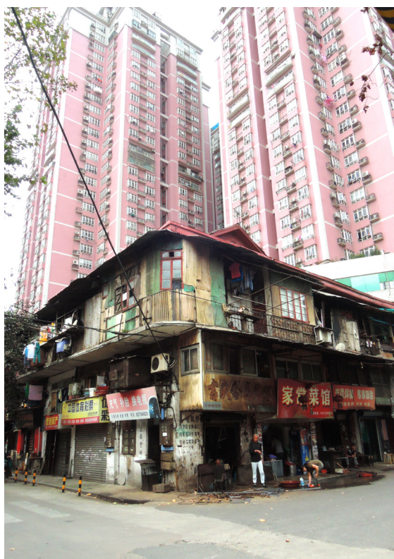
Contraste urbain, Wuhan, Chine, 23/09/2014.

Henri Lefebvre dans son ouvrage Le droit à la Ville , paru en 1968, nous livre quelques mois avant les émeutes parisiennes - qu'il influencera directement par son enseignement à l'université Paris-X Nanterre - une réflexion philosophique et sociologique sur l'urbanisation post-industrielle française. Il introduira notamment les notions