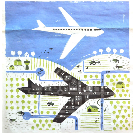
Illustration de Karine Bernadou, Première page de l'hebdomadaire CQFD, n°106 - Décembre 2012

Nous avons vu que les luttes pour libérer des espaces d'inventions de modes de vie expérimentaux tendent aujourd'hui à se territorialiser et qu'elles ne se situent pas nécessairement dans des contextes urbains. Ces actions de résistance se forment parfois aussi en dehors des territoires cristallisant les enjeux économiques de l'Etat ou des grandes entreprises. Ainsi contrairement à NDDL, au barrage de Sivens dans le Tarn ou à la nouvelle ligne de TGV Lyon-Turin dans le Val de Suse, ce qui se passe sur le plateau Limousin de Millevaches est d'un autre ordre. Délaissé par les institutions publiques et privées, ce territoire est retranché sur la marche menant au massif central, à l'ouest de la chaîne des Puy. Cette sorte de Highland granitique est un désert humain, avec une densité de moins de 7 habitants au km 2 , mais attire malgré tout de plus en plus de néo-ruraux venus expérimenter un mode de vie plus autonome. Les médecins, les postes, les équipements ou les commerces sont rares et tous les déplacements pour les rejoindre ne se font qu'en voiture à travers des routes sinueuses de basse montagne, et sur de relativement longues distances. A l'abandon institutionnel s'ajoute une forte pauvreté économique des habitants : en Limousin 15.4% de la population vit sous le seuil de pauvreté, et dans le département de la Creuse c'est