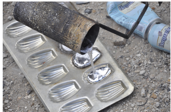
Première coulée d'aluminium extrait de canette, Actlab, Atelier de l'association Bellastock, Île St Denis, 08/05/2015

de l'époque qui voulait inventer de nouvelles manières de vivre et de faire plus autonomes, créatives et auto-suffisantes. Il partageait des connaissances liées à l'autonomie et vendait indirectement par correspondance - en mettant en relation les consommateurs et les producteurs - des produits allant dans ce sens, comme des outils, des livres ou des vêtements 8 .