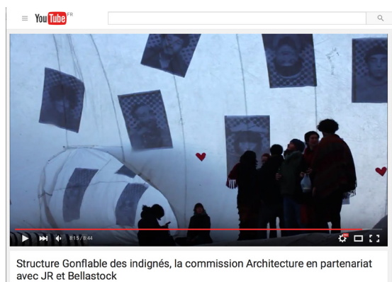
Photo Extraite de la vidéo Youtube Structure Gonflable des indignés, la commission Architecture en partenariat avec JR et Bellastock https://www.youtube.com/watch?v=oc_pNFMQubM&feature=share

Revendiquer son droit à la ville par des actions de résistance c'est aussi revendiquer son droit à désobéir lorsqu'une situation nous paraît injuste. Je pense que la désobéissance civile devient un devoir lorsque l'Etat ne va plus dans le sens de la démocratie et que les citoyens perdent leur droit à se déterminer par eux-même - c'est-à-dire leur autonomie. L'autonomie est la condition de la réinvention individuelle et collective du monde face aux crises que nous subissons.