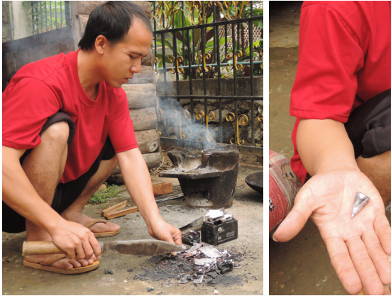
Fabrication artisanale d'un plomb de pêche, Luang Prabang, Laos,