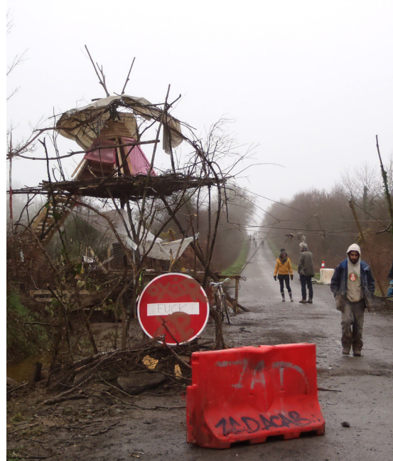
Une tour de guet à l'entrée de la ZAD, Notre Dame des Landes, 06/01/2013

«Cela fait déjà un mois et demi que ça dure et on n'en voit pas la fin [...]. Il ne faudrait pas qu'il y ait d'autres gros évènements