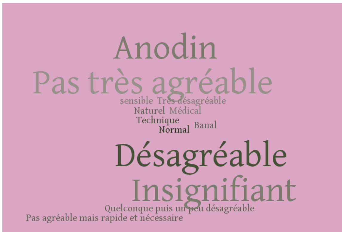
Figure 2 : Ressenti des femmes par rapport au TV

Voici les résultats sous forme de « nuage de mots », ce qui permet de faire ressortir les termes les plus utilisés :