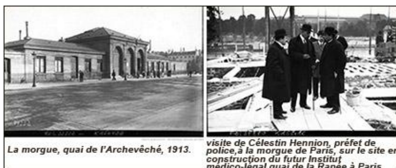
La morgue, quai de l'Archevêché, 1913.

Au XIXe siècle, la morgue prend des allures beaucoup plus organisées, voire "spectaculaires". En effet, après avoir siégé près du pont du Châtelet, la morgue s'installe en 1804 sur l'île de la Cité, dans un édifice du quai du Marché Neuf. Les corps, préparés, sont exposés en vitrine, habillés de leurs propres vêtements. La population locale défile ainsi, la journée durant, afin de les observer à loisir et, par la même occasion, tenter une identification. « C'est l'attraction du Tout-Paris, au point de figurer dans des guides de voyagistes étrangers! Cette technique est aussi favorable aux autorités qui ont bien souvent l'occasion d'arrêter les criminels revenus discrètement observer leurs "trophées" ». (L'Institut médico-légal de Paris, lieu de la dernière vérité par Sophie Farrugia).