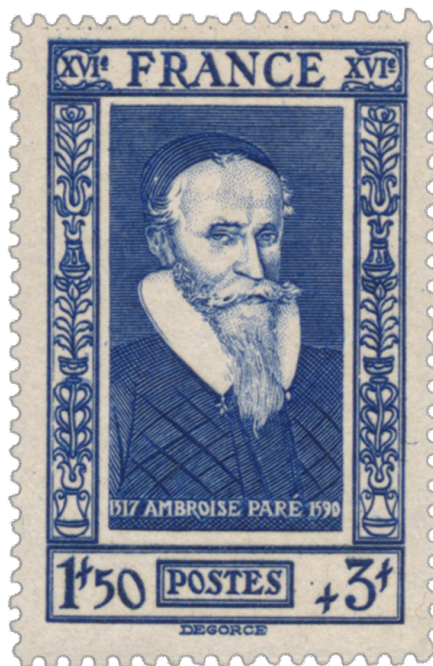
Timbre « Ambroise », émis en 1943

La médecine judiciaire, en tant que science, date réellement du XVI ème siècle. Dans son Vingt Huitième Livre traitant des rapports et du moyen d'embaumer les corps morts , Ambroise Paré décrit les signes permettant d'affirmer le degré de gravité des blessures, les symptômes permettant de savoir si un corps a été jeté vivant ou mort dans l'eau... Y est également spécifiée la démarche à suivre afin de constater la virginité ainsi que l'impuissance « tant de l'homme que de la femme ».