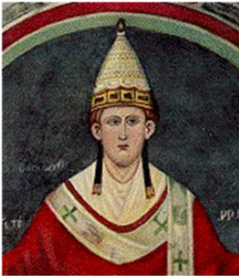
Innocent III

Durant la période de l'Inquisition installée par Innocent III et Grégoire IX, les tribunaux ecclésiastiques instaurent la torture. Pratique rapidement imitée par d'autres tribunaux.