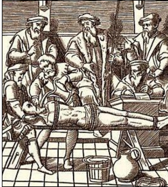
Question extraordinaire par l'eau