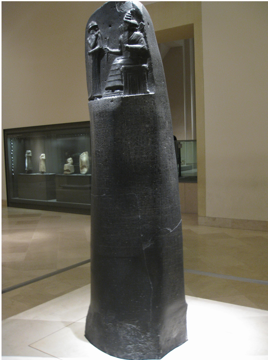
Face avant de la stèle du Code de Hammurabi, conservée au Musée du Louvre, département des Antiquités orientales ; Image provenant de la base de données Wikipédia.