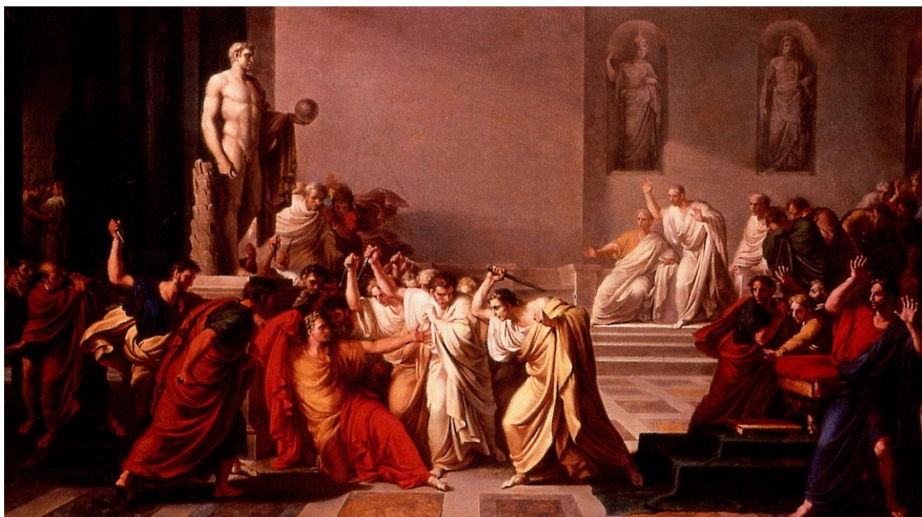
Mort de César par Vincenzo Camuccini, 1798

A Rome, les cadavres des individus ayant succombé à une mort violente étaient exposés au regard des citoyens. Chacun pouvait alors donner son avis sur le genre de mort. C'est ainsi par exemple que le médecin Antistius se rendit, d'après Suétone, auprès du corps de Jules César et que le corps de Germanicus fut exposé sur le Forum à Antioche.