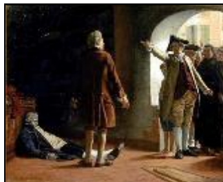
Découverte du corps de Marc-Antoine

La foule accuse les protestants Calas d'avoir assassiné leur fils qui voulait se convertir au catholicisme. Alerté par les cris, le capitoul (ancien magistrat municipal de la ville de Toulouse) Davis de Beaudrigue intervient avec la force publique. Il examine sommairement le corps et conclut « qu'il n'était pas mort de mort naturelle ». Il fait donc mandater deux chirurgiens pour procéder à la vérification du cadavre. Il ne perquisitionne pas et ne laisse aucun homme de la force publique devant la maison des Calas. Il arrête tous les occupants de la maison et fait déplacer le cadavre pour aller à l'hôtel de ville, bafouant ainsi l'ordonnance criminelle du 26 août 1670 (titre IV, article premier) en vigueur à l'époque. Dressé le 14 à l'hôtel de ville, le procès verbal est antidaté.