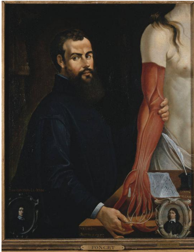
Portrait d'André Vésale (1514-1564), Pierre Poncet

En introduisant une révolution dans le domaine de l'anatomie, Vésale s'attire l'hostilité d'un grand nombre de ses pairs mais la dissection du corps humain devient, entre ses mains, un acte authentiquement scientifique.