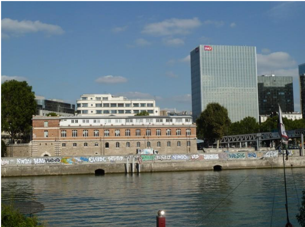
Institut Médico-Légal, Quai de la Rapée.