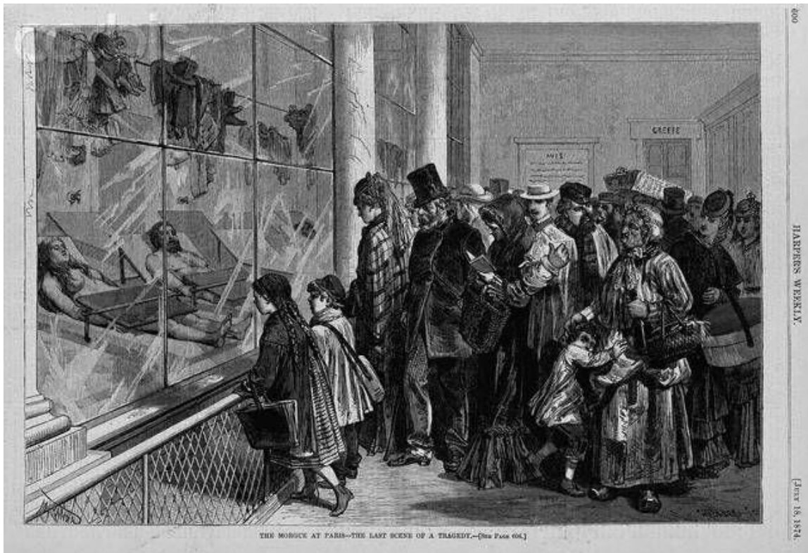
La morgue de Paris selon Emile Zola : extrait de Thérèse Raquin, 1867, chapitre 13