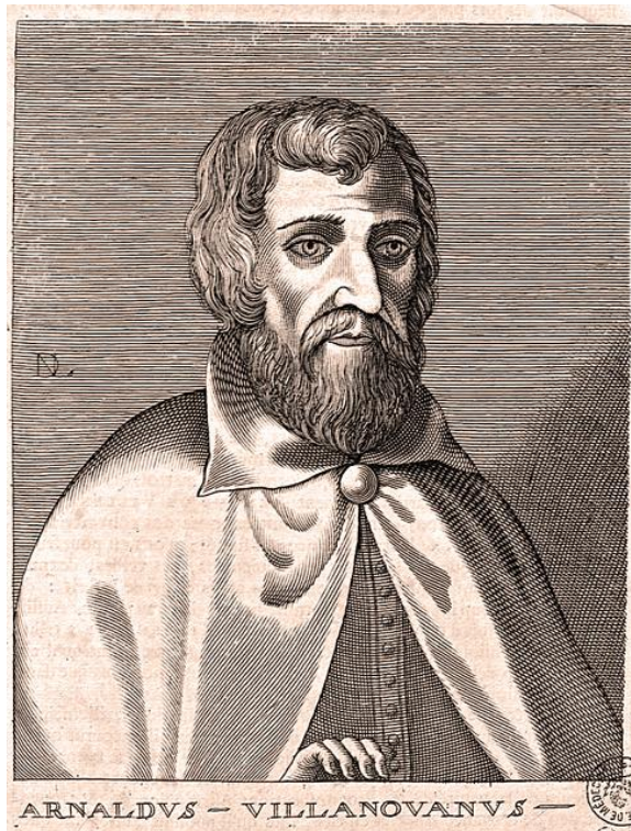
Arnaud de Villeneuve ou Arnau de Vilanova (1238 - 1311 ou 1313)

Image provenant de la base de données Wikipédia