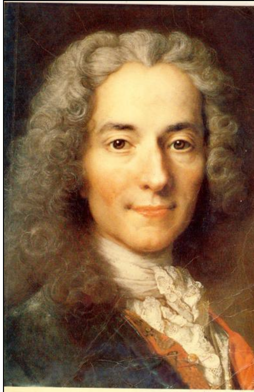
Portrait de Voltaire