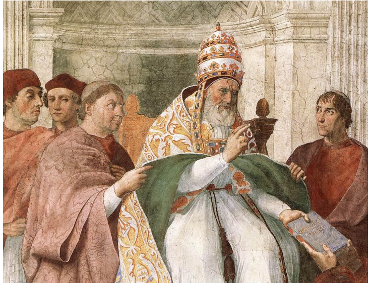
Grégoire IX approuvant les Décrétales, 1511 Fresque exposée au Vatican

Une des caractéristiques des législations et coutumes du Moyen Age était l'usage des procès faits aux cadavres et des supplices infligés aux criminels morts avant de passer en justice. Il en était de même pour les corps des suicidés. On lit, par exemple, dans la coutume d'Argonne : « la personne qui soi défait d'elle-même, le corps devra être traîné aux champs, aussi cruellement que faire se pourra, pour montrer l'expérience aux autres » ; et dans l'ordonnance de 1270 : « S'il advenait que aucun homme se pendit ou se noyât ou s'occis en aucune manière, ses meubles seraient au baron, et aussi de sa femme ». Le médecin avait alors la charge du corps auquel était intenté le procès. En cas de putréfaction menaçante, il était chargé de l'embaumer ou de le saler. Cet usage s'est perpétué jusqu'au XVIIème siècle.