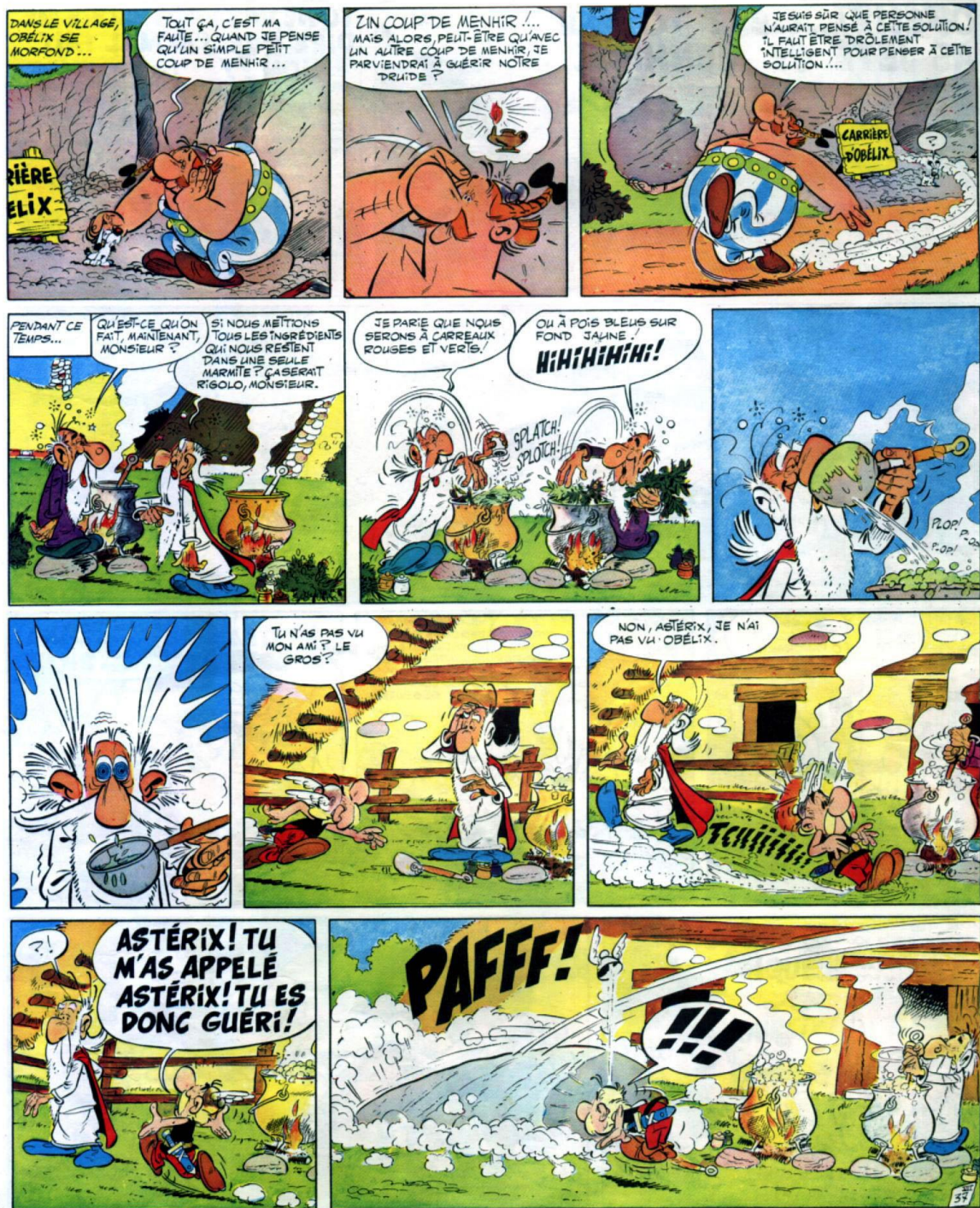
Goscinny H., & Uderzo A., Astérix : le Combat des Chefs , p.41.