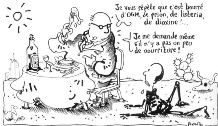
Plantu, Le Monde, 2002