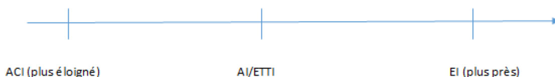
Schéma du continuum du parcours d'insertion au sein des SIAE réalisé par l'auteur

En fonction de l'éloignement des personnes de l'emploi, des catégories de SIAE seraient plus adéquates que d'autres et il existerait un cheminement du.de la salarié.e à travers les différents types de SIAE. Ce schéma et cette notion de continuum sont cependant en débat et ne peuvent pas être généralisée à l'ensemble des SIAE. En effet, comme l'ont évoqué certain.e.s acteur.rice.s, la multitude de parcours d'insertion indique qu'il n'existe pas de « parcours type » au sein des SIAE, des salarié.e.s pouvant passer d'une EI à un ACI ou rester 24 mois au sein d'un ACI. Cependant, même si ce modèle théorique ne peut pas être retenu comme cadre de référence, la notion de « sas » vers l'emploi permet de mettre en avant la