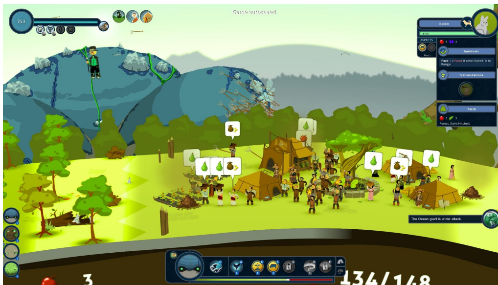
Illustration 6: Reus , Abbey Games, 2013

Ces notions de convoitise, d'accumulation de ressources, de peuples belliqueux qui font la guerre pour asseoir leur domination, tout ça est par ailleurs au centre d'une discussion très vive sur le nom même d'Anthropocène. En effet, le terme d'Anthropocène ne fait pas toujours l'unanimité, certains proposant d'autres appellations pour souligner les réels acteurs de ce changement climatique : Anglocène, Capitalocène, etc. Je m'attarderai donc ici sur deux termes qui appuient justement l'importance de la guerre, et du mode de vie qui a prévalu à sa suite. Dans un premier temps, le Thanatocène ou l'influence de la guerre dans les problèmes environnementaux, notamment la Seconde Guerre Mondiale, la plus meurtrière et étrangement la plus abordable financièrement en terme de coût de destruction de la technologie militaire pour les pays riches.