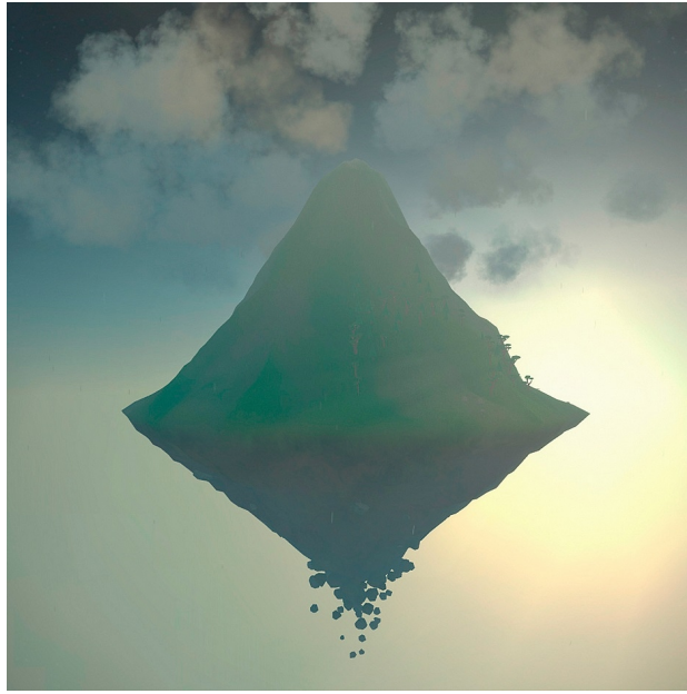
Illustration 11: Mountain , David O'Reilly, 2014

Deuxièmement, le jeu vidéo par son aspect dématérialisé et connecté, pourrait être le représentant idéal du système de production actuel, à l'échelle mondiale. Il suffit de revoir les chiffres que représentent l'industrie vidéo-ludique pour se rendre compte que c'est une source intarissable d'argent, sans oublier tous les produits dérivés liés aux différents studios, l'adaptation au cinéma, l'e-sport qui est en train de créer de nouvelles opportunités financières, les marchés de vente d'objets des jeux – marché entièrement virtuel mais qui nécessite de l'argent véritable et produit également de véritables revenus, certains vivant du farming 125 –, qui s'ajoutent de manière externe aux chiffres officiels des ventes de jeu vidéo.