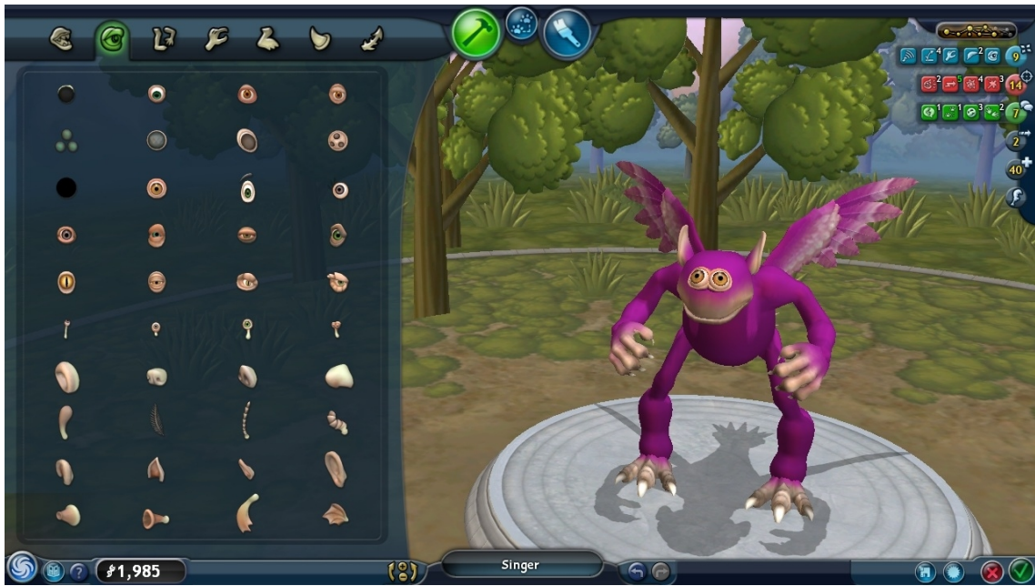
Annexe 3: Spore , EA Electronics, 2008