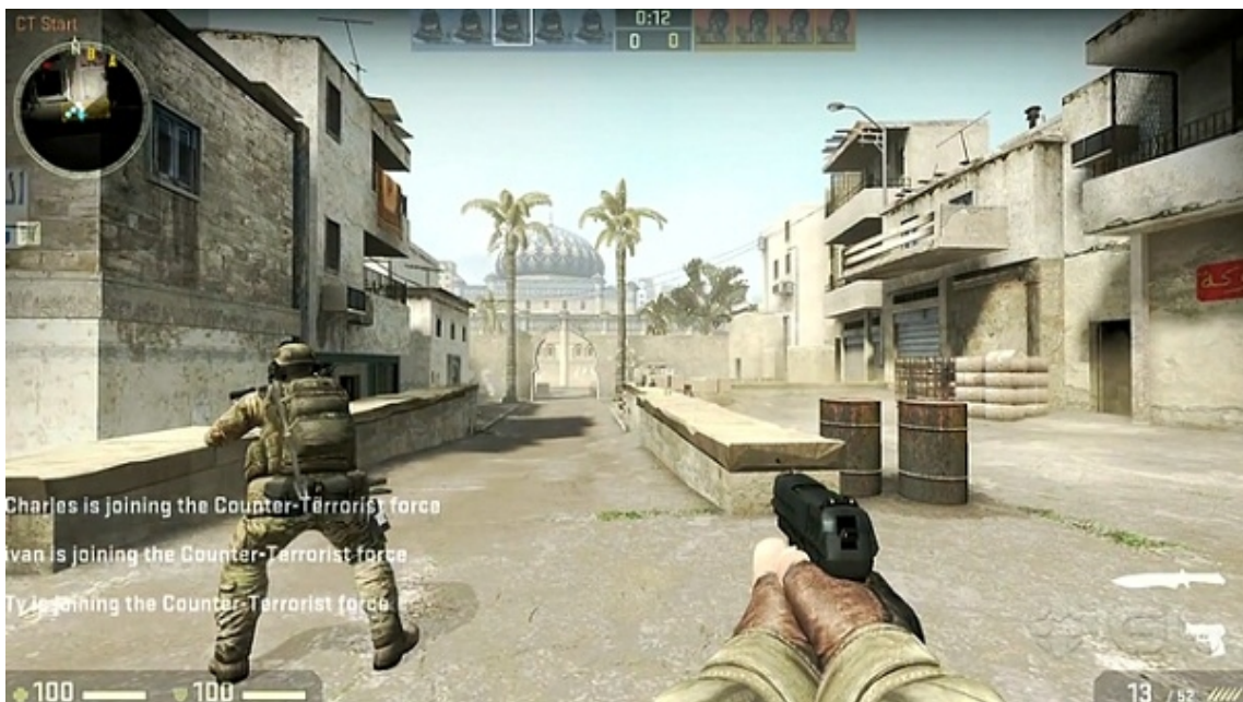
Annexe 4 : Counter-Strike Global Offensive , Valve, 2012