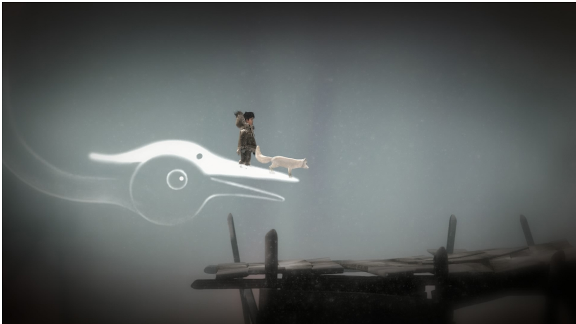
Illustration 3: Never Alone , Upper One Games, 2014

Donc puisque l'incarnation de sujet non-humain est rapidement une impasse pour permettre aux joueurs de s'ouvrir aux autres ontologies du monde, certains jeux vidéo ont tenté d'être explicitement les messagers d'une culture humaine différente, à défaut de s'attaquer à l'épineux problème des non-humains. Le jeu Never Alone (Kisima Inŋitchuŋa) [illustration 3] par exemple prend explicitement le parti pris de se vouloir un jeu vidéo de réflexion certes, mais au fur et à mesure de l'avancée des chapitres, des vidéos sont débloquées dans lesquelles la culture inuite en Alaska est expliquée. Les vidéos sont des mini-documentaires avec des interviews d'inuits, de professeurs qui racontent et expliquent les légendes, les références culturelles qui sont à la base du scénario du jeu. Ce dernier permet déjà une entrée narrative et graphique dans cette culture, mais les vidéos sont un complément, des bonus – si le joueur décide de s'y intéresser, car il n'est pas obligé de visionner les vidéos – pour mieux comprendre le jeu lui-même, qui se veut une ouverture sur une autre culture, une autre langue, d'autres références, où les animaux et les esprits sont très présents, très liés aux humains.