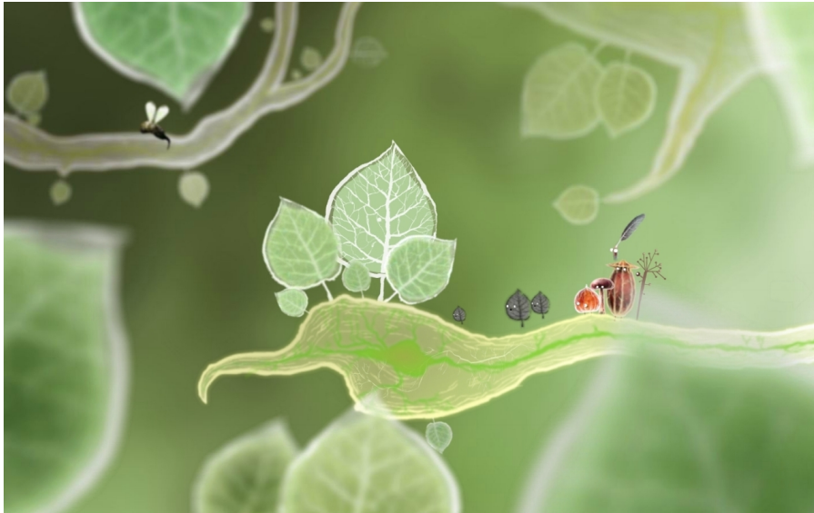
Illustration 2: Botanicula , Amanita Design, 2012

compréhension au sein du jeu, notamment par une certaine anthropomorphisation des avatars. Le jeu Botanicula [illustration 2] est par exemple intéressant, car il met en œuvre un groupe de petits personnages hybrides entre insectes et plantes, qui doivent échapper à une araignée monstrueuse. Ces personnages ne parlent certes jamais dans le jeu, mais ils communiquent par des dessins compréhensibles pour le joueur humain et ont des expressions, réactions assimilables à celles des humains.