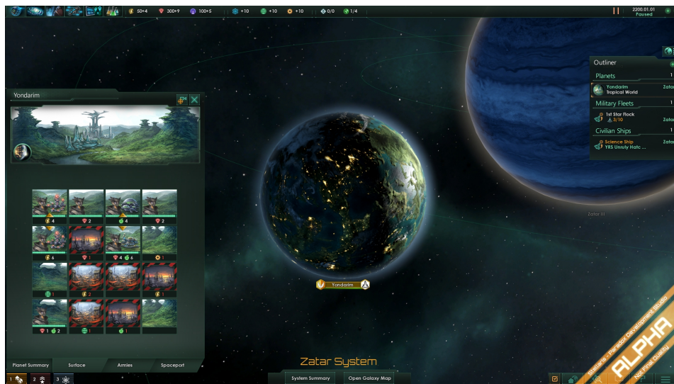
Illustration 8: Stellaris , Paradox Development Studio, 2016

Cette vision du globe est donc particulièrement problématique, nous l'avons vu, mais ce qui pourra paraître étrange est qu'elle est reprise d'une certaine manière par ceux même qui ont développé et protégé les notions de Gaïa et d'Anthropocène. En effet, nous l'avons déjà dit mais James Lovelock qui a le mérite d'aborder la planète dans toutes ses composantes, de prôner une certaine prudence face à nos ignorances, est en même temps tributaire d'une vision cybernétique fermée de la Terre, faisant d'elle un système clos dont seulement quelques éminents scientifiques seraient dans le secret de