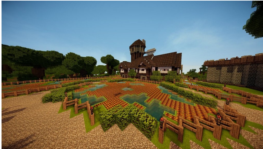
Illustration 9: Minecraft , Mojang, 2011

Le premier a été récemment racheté par Microsoft, dispose donc d'un budget conséquent, de nombreux produits dérivés et d'une très grande popularité parmi les joueurs. Le second est un jeu qui se veut indépendant, donc moins connu et avec moins de budget, ainsi qu'une communauté de joueurs restreinte. Leur point commun est de proposer un monde ouvert, basé sur un graphisme en pixel-art, proposant une expérience de multi-joueurs et qui a pour ressource principale, la nature.