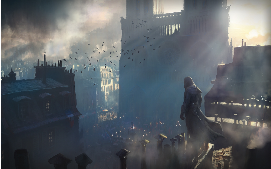
Illustration 1: Assassin's Creed Unity , Ubisoft, 2014

La plupart des jeux de type RPG ( Role Player Game ) se déroulent dans des environnements particulièrement beaux et très réalistes, comme Assassin's Creed [illustration 1] qui a bouleversé le monde des joueurs par son inspiration de la Révolution française, censée être recréée avec précision et force détails. Il est d'ailleurs intéressant de se pencher sur l'exposition L'Art dans le jeu vidéo , qui s'est déroulé courant 2015 au musée Art Ludique à Paris, dans laquelle Assassin's Creed avait une place prépondérante. Premièrement, son titre laissait à présager une exposition qui aurait pour mission de légitimer le médium comme un véritable art, au même rang que la peinture ou l'architecture. Ensuite, le texte d'introduction rédigé par le commissaire d'exposition faisait même l'éloge du jeu vidéo comme étant un art total, mêlant aussi bien le dessin, la musique, le cinéma – ou du moins ses techniques –, l'architecture, etc. [annexe 1] Nous ne pouvons pas nier que le jeu vidéo est peut-être le premier médium à devoir mélanger de façon équilibrée tous ces aspects artistiques pour être réussi mais l'exposition s'est pris les pieds dans l'écueil de justifier des parentés historiques au lieu d'insister sur sa singularité et son évidente modernité. D'autant plus que l'exposition s'est