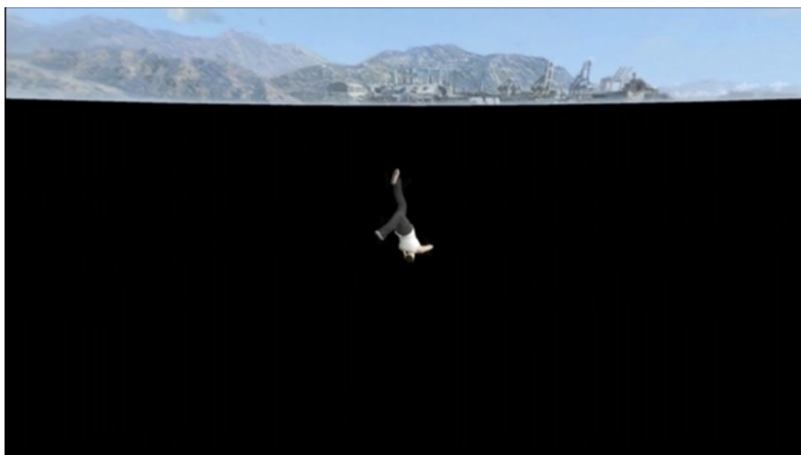
Annexe 2 : Harun Farocki, Parallel II (still image), 2014

Si autrefois les puissances gouvernantes constituaient les commanditaires directs et exclusifs de ces ateliers d'artistes, c'est à présent le grand public, pour lequel sont produites ces œuvres, qui est devenu le commanditaire naturel des studios, offrant ainsi aux artistes un univers de création illimité. (...)'