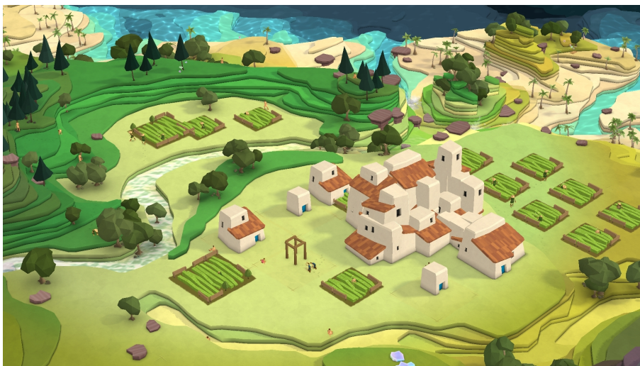
Illustration 4: Godus , 22can, 2013

L'illustration suivante montre comment le game design passe par un principe de strates permettant de créer relief et obstacles. Nous pouvons voir les rochers à détruire, les champs cultivables autour d'un petit regroupement d'habitations et tout ce qui est encore à optimiser en terme d'étendue : en supprimant la bande vert foncé – et en détruisant ainsi les arbres – juste au dessus des habitations, cela crée de nouveaux espaces.