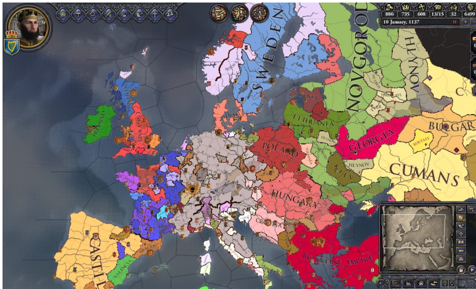
Illustration 7: Crusader Kings II , Paradox Development Studio, 2012